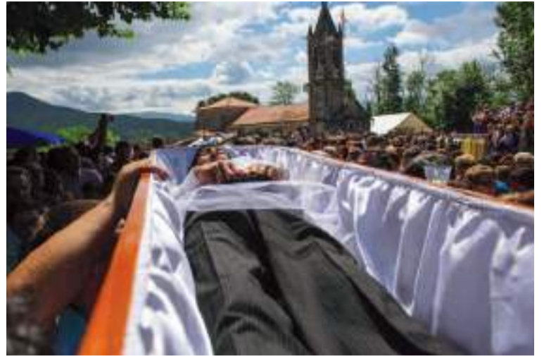
Santa Marta de Ribarteme (As Neves).

Continuamos nuestro recorrido rumbo al municipio orensano de Allariz, una de las villas gallegas mejor conservadas, por la que vale la pena pasear. Alguna de sus calles adoquinadas ha de llevarnos hasta el convento das Clarisas, fundado en 1268 por la reina Violante, mujer de Afonso X O Sabio. En su interior, encontraréis la imagen de marfil de la Virxe Abrideira, de finales del siglo XIII, que representa a una santa sedienta sujetando al Niño. Al abrirse, semeja un retablo destinado a narrar la vida de María. A pocos kilómetros, oculto en un idílico paisaje, nos aguarda el santuario de Santa Mariña de Augas Santas, una de las mejores muestras de la arquitectura gallega de los siglos XII y XIII. Su leyenda os contará la historia de los lugares en los que esta Virgen fue martirizada sin piedad por no corresponder a los amores del prefecto romano Olibrio. La santa