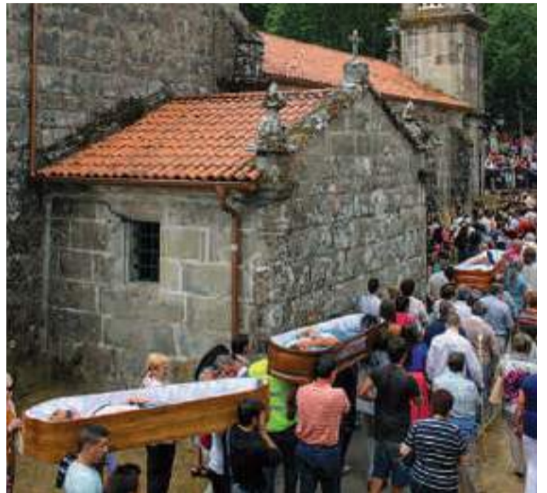
Santa Marta de Ribarteme (As Neves).

se salvó milagrosamente de todos los castigos y, al final, su torturador la mandó decapitar. Cuentan que los tres botes que dio su cabeza contra el suelo, al tronzar y separarse del cuerpo, dieron origen a las tres fuentes de Augas Santas, situadas en la parte posterior del templo en el que se guarda la imagen de la mártir. Lo mismo que entre los condes de Caldelas y de Bena, a comienzos del siglo IX, seguid los rituales para empapar la espiritualidad que se respira en este lugar. Al salir del santuario de la espantosa montaña, el señor de Caldeos aguarda un relajante paseo por la antigua calzada romana cubierta por una frondosa bóveda vegetal, interrumpido por la victoria, mandó llevar el ruido de las hojas a vuestro pasaporte. Seguid la ruta de la procesión de día grande hasta las ruinas de la basílica da Ascensión, del siglo XIII, que nunca llegó a concluirse. En la cripta de este templo encontráis el Forno da Santa, en el que dicen que el prefecto Olibrio intentó quemarla; pero del que se salvó por la intercesión de san Pedro. Antes de llegar, se percataron de pocos metros, está la Piuca da Santa o fuente de Augas Negras, de la que cuenta la leyenda que deben su oscuro color a que en se lavó santa Mariña al salir de la tierra por millares, muchos de ellos de ceniza del horno. Después, ya en la villa termal de Baños de Molgas, os invadirá la tranquilidad y el recogimiento de 7 y 8 de septiembre y también una auténtica villa de la Galicia durante el novenario.