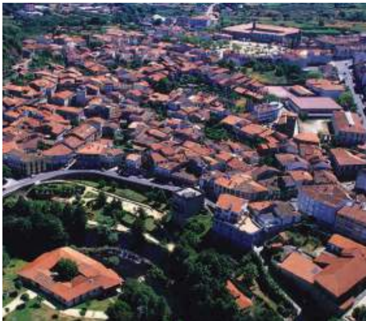
Villa de Allariz.