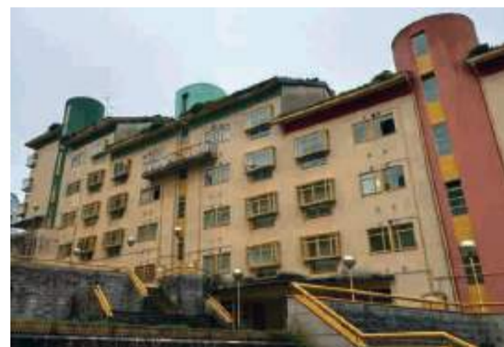
Edificio en el número 17 de Avenida Xoán Vicente Viqueira.

Paralelamente, el gobierno local de Sada apunta que continúa trabajando con el Gobierno autonómico para estudiar otros posibles usos públicos para los dos locales que no cumplen con los requisitos técnicos para su transformación en vivienda, con la finalidad de recuperar estos espacios para el interés general y dar respuesta a diferentes necesidades del municipio.