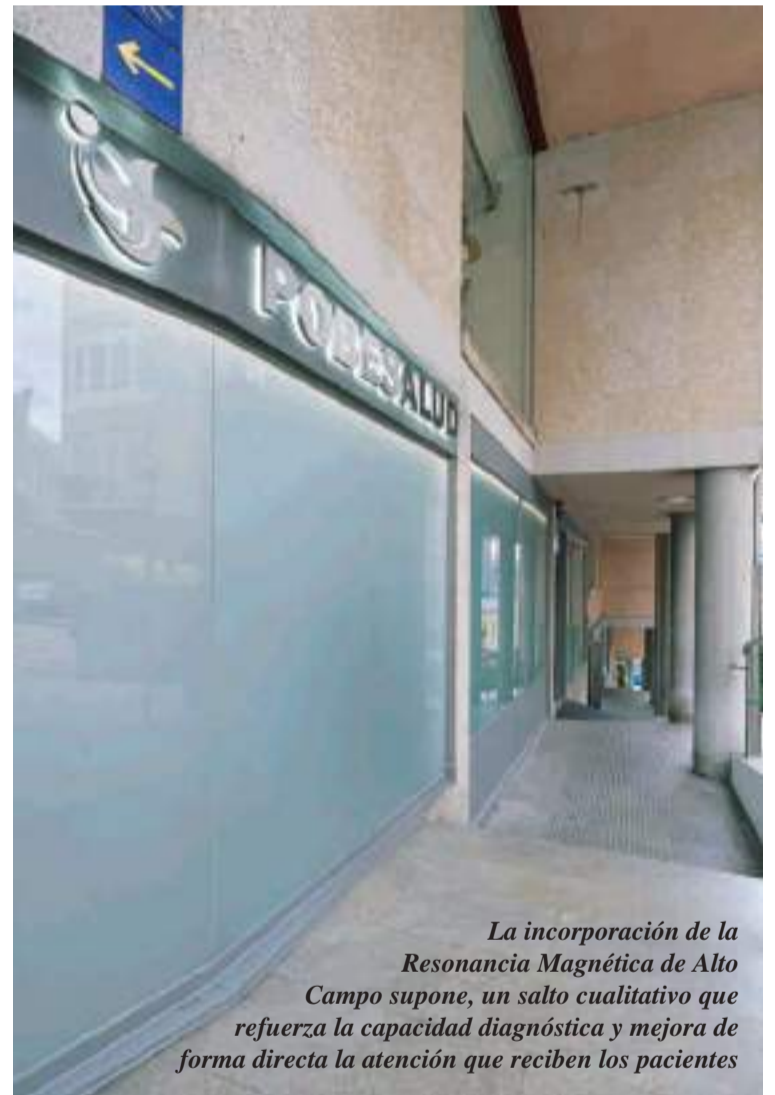
La incorporación de la Resonancia Magnética de Alto Campo supone, un salto cualitativo que refuerza la capacidad diagnóstica y mejora de forma directa la atención que reciben los pacientes

La tecnología no es el único aspecto relevante, ya que la nueva resonancia incorpora unacabina humanizada, diseñada para que la experiencia del paciente sea más agradable. Uno de los grandes temores de quienes se someten a una Resonancia Magnética es la sensación de encierro, por eso este espacio