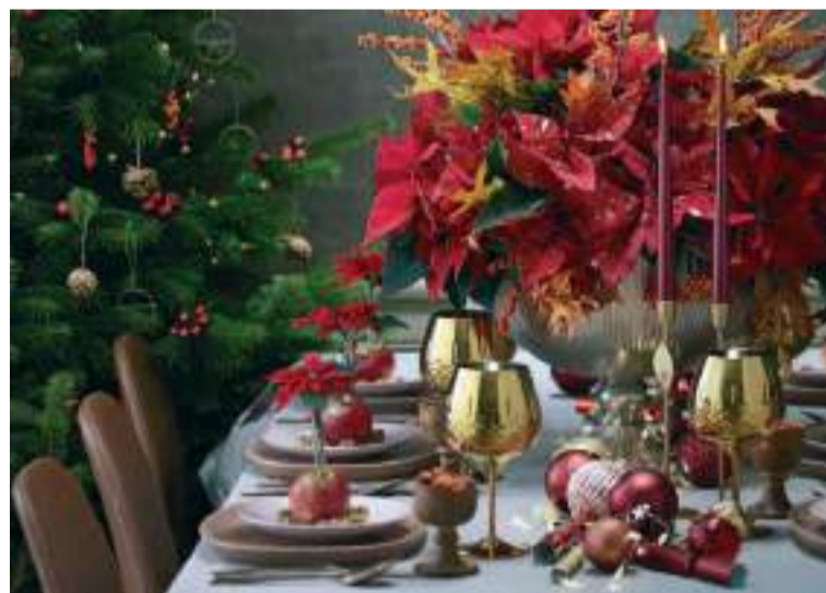
En Navidad hay espacio para todos los estilos.