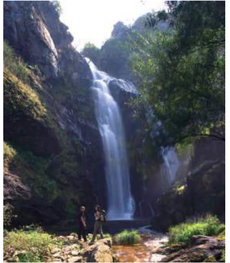
Cascada del río Toxa.

Internándonos ahora en el ayuntamiento de Dozón, la iglesia de San Pedro de Vilanova de Dozón es una joya del románico gallego, edifica-