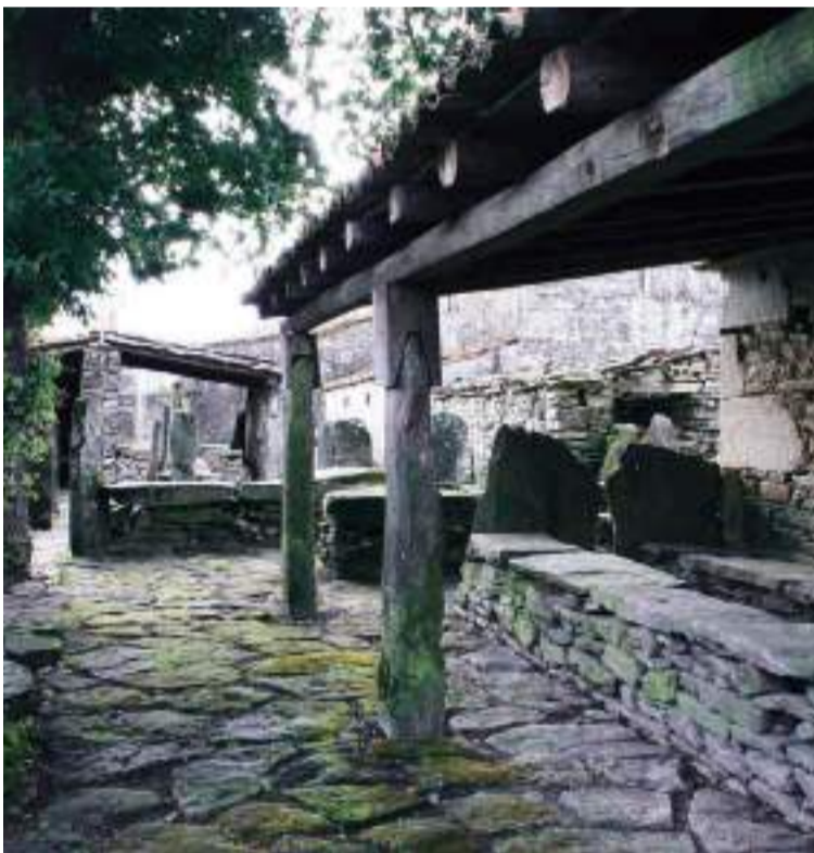
Pendellos de Agolada.

La siguiente parada de nuestro itinerario es el convento benedictino de Carboeiro, en pleno corazón de Silleda. Para llegar hasta él deberemos sumergirnos en un frondoso y bello paisaje y atravesar un puente medieval. A la altura de un escarpado promontorio de un meandro del río Deza descubriremos, escondido entre la naturaleza, esta joya arquitectónica del románico tardío (o románico de transición) más destacable de Galicia. El nombre de Carboeiro le viene dado por la vegetación forestal de la zona, que desde antiguo fue empleada para la elaboración de carbón vegetal. Como remate a esta jornada, nada mejor que visitar la cascada del Toxa. Guíaos por el murmullo del agua que consigue colarse entre los abundantes fresnos y abedules, y que os ha de conducir hasta una caída de agua de las más altas de Galicia. Allí, sentados en la playa fluvial y adormilados por los sonidos de la naturaleza podréis desconectar de todo lo que os rodea gracias a la paz que se respira en el corazón de la Galicia interior.