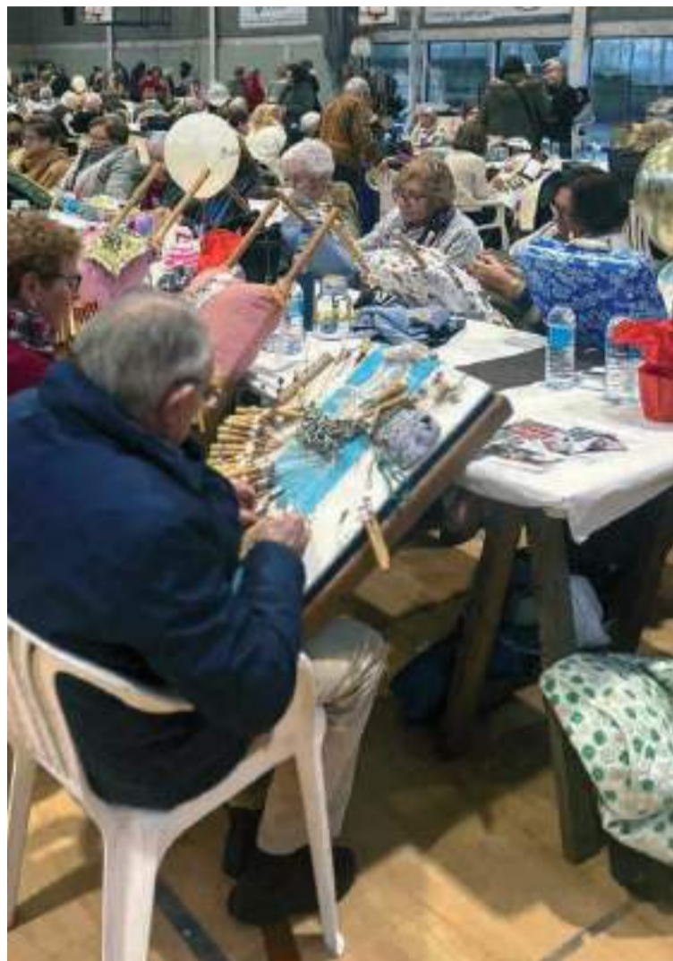
El 3º Encuentro de Bolillos, una jornada dedicada a la artesanía tradicional que tuvo lugar en el pabellón Sofía Toro.