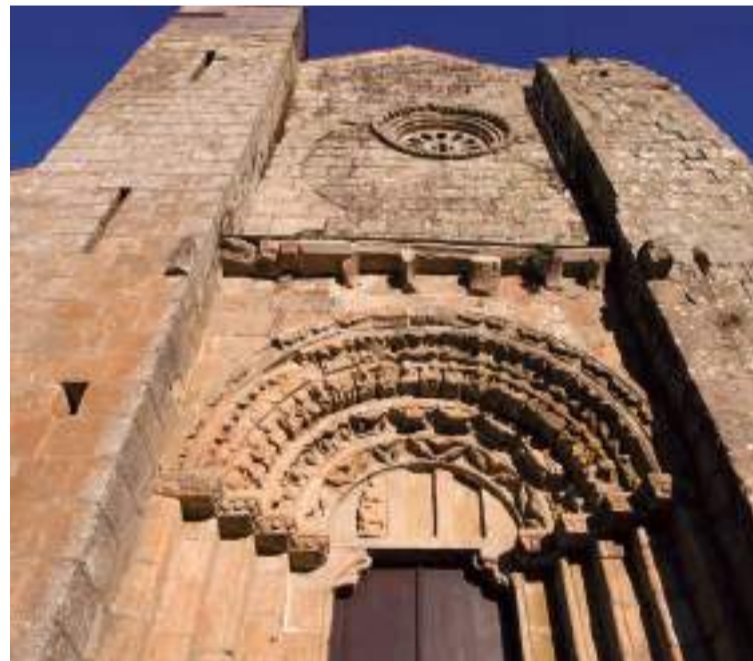
Fachada del monasterio de Carboeiro.