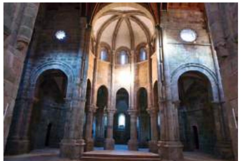
Monasterio de Carboeiro.