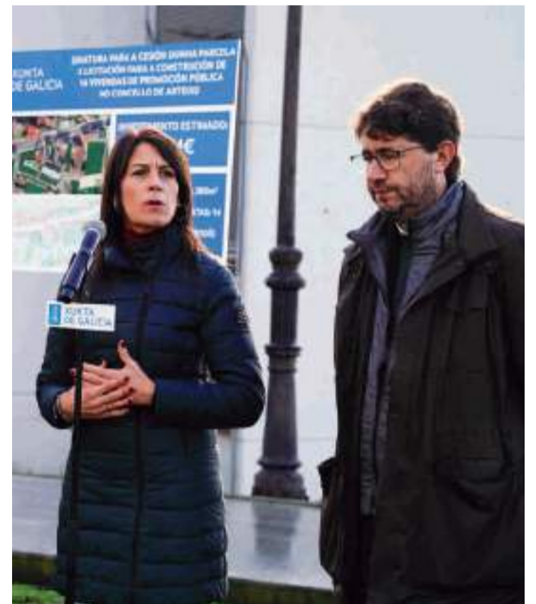
Firma entre la Xunta y el Concello de Arteixo para la cesión de suelo para construir vivienda pública.

Tras la firma, Allegue destacó que el Gobierno gallego ya ha firmado 12 convenios con A Coruña, Pontevedra, Lugo, Ames, A Estrada, Lalín, Teo, Vilagarcía, Carballo, San Cibrao das Viñas y Narón para facilitar la vivienda protegida. Con estas de Arteixo, hay cerca de 3.000 en marcha en toda Galicia. En su mayoría están planteadas para personas jóvenes y, en este sentido, la titular de Vivenda subrayó el trabajo de la Xunta para aumentar la oferta de vivienda que repercutirá en los precios de los alquileres.