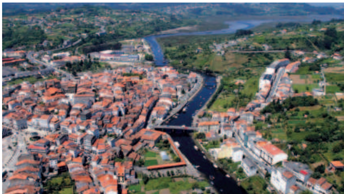
Centro histórico de Betanzos.

gallego), la iglesia de Santiago do Burgo en Culleredo, el convento de San Salvador en Bergondo, las iglesias de San Paio y San Pedro en Aranga y la iglesia ojival de Santiago en Betanzos.