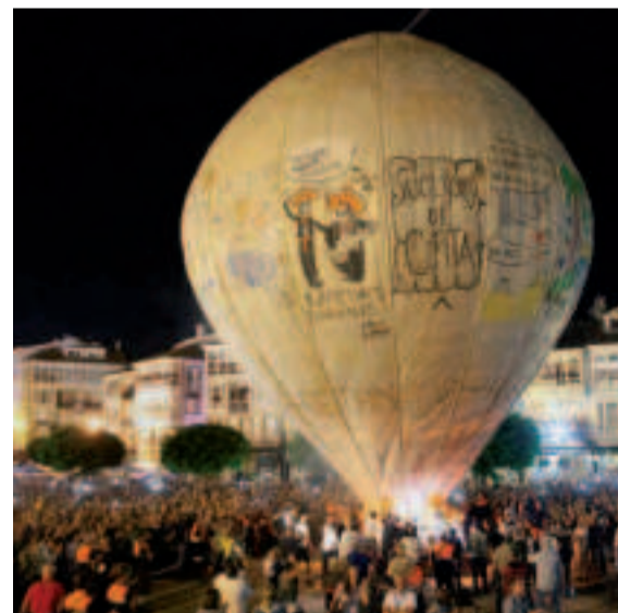
Globo de Betanzos.