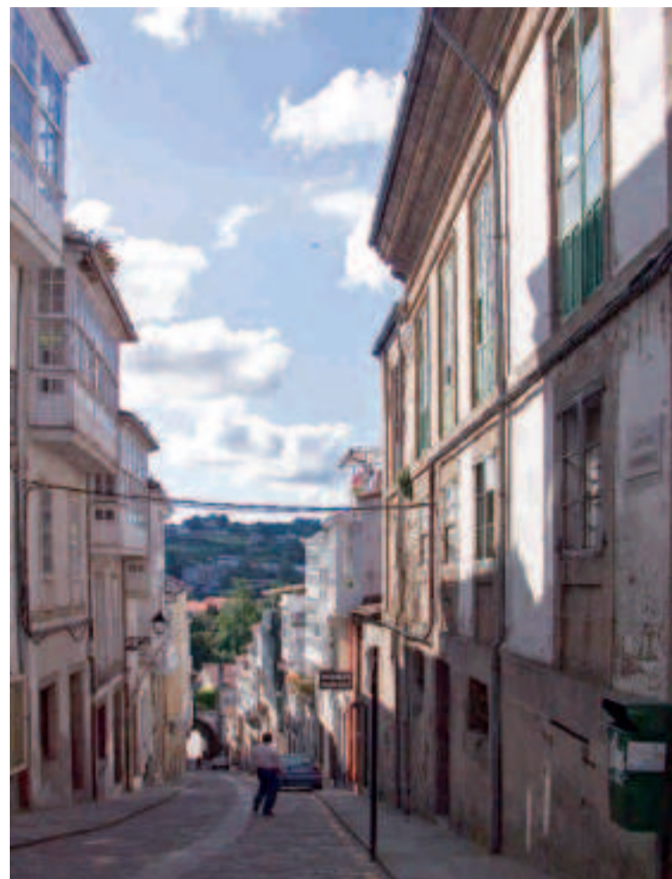
Centro histórico de Betanzos.

La arquitectura religiosa de la zona atesora importantes construcciones que, en buena parte, forman parte del inventario de Bienes de Interés Cultural. Tal es el caso de iglesias como las de Santa María de Azogue y San Francisco en Betanzos, la iglesia del antiguo monasterio de San Nicolao de Cis en Oza-Cesuras o la iglesia de Santa María de Dexo en Oleiros. Otros monumentos de gran relevancia en la zona son Santa María de Cambre (una auténtica joya del románico