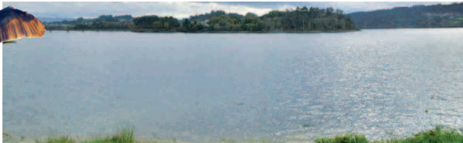
Encoro de Cecebre-Abegondo.

del golfo Ártabro (A Coruña, Ares-Betanzos y Ferrol). Tienen también protección la confluencia de los ríos Mendo y Mandeo y el espacio natural del Encoro de Abegondo-Cecebre, que abarca más allá del propio embalse que se despliega aguas arriba de los ríos Mero y Barcés. Se debe hacer una mención especial a la Reserva de la Biosfera de As Mariñas Coruñesas e Terras do Mandeo que abarca todos los municipios de este geodestino.