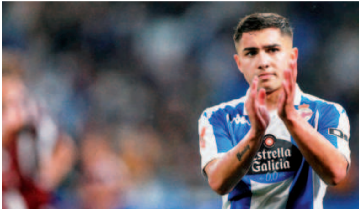
Yeremay abrió ante el Albacete el catálogo de virguerías.

El paso por los vestuarios no le pudo salir mejor al Dépor, que nada más poner un pie en el campo se encontró con el tercer gol, obra de Eddahchouri con una buena maniobra en el área. El neerlandés se reivindicaba así después de ser