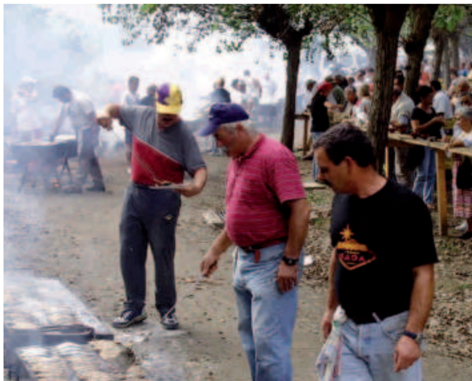
Festas Patronais de San Roque de Sada.

Desde el faro de Mera, balcón privilegiado del monumento natural de la Costa de Dexo (en el ayuntamiento de Oleiros) se pueden observar la entrada de las tres rías