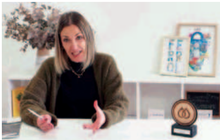
La entidad se encuentra en la actualidad en pleno proceso de expansión.

ramiento y soporte emocional a pacientes con cáncer y a sus familias; informar y sensibilizar sobre el proceso de donación de médula ósea y colaborar en proyectos de investigación contra el cáncer.