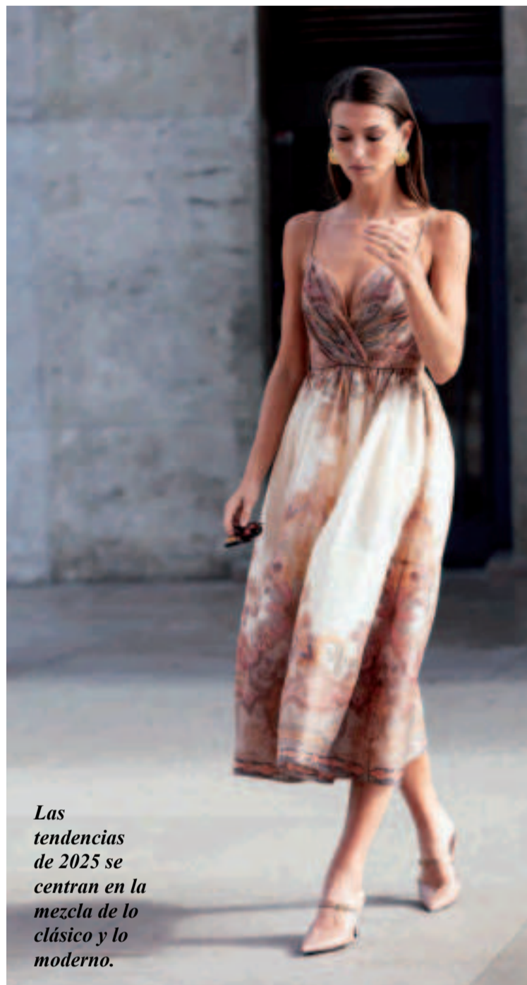
Las tendencias de 2025 se centran en la mezcla de lo clásico y lo moderno.

Las tendencias de este año proponen una gran variedad de opciones que van a jugar un papel fundamental en el resultado final del conjunto. El encaje sigue siendo un clásico, pero este año se combina con otros materiales como el