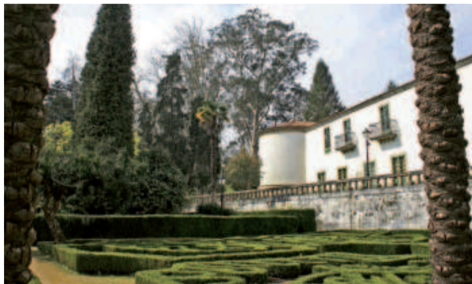
Pazo de Mariñán.