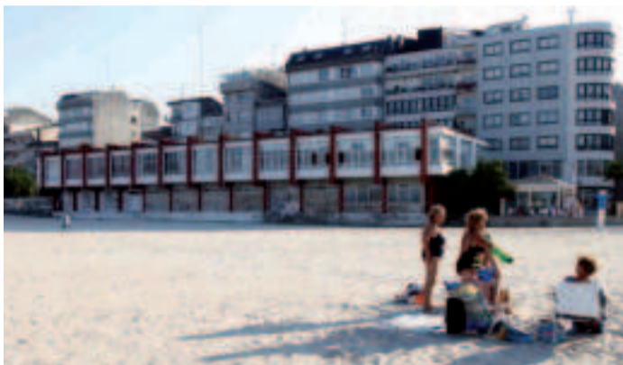
Sede de La Sociedad en Sada.

El pleno de Sada dio luz verde a una moción del PSOE para abrir expediente y catalogar dos edificios diseñados por el reconocido arquitecto Andrés Fernández-Albalat: la sede de La Sociedad y las casas de los marineros de Fontán. La propuesta prosperó con el apoyo de todos los partidos de la Corporación salvo del PP, que se abstuvo. Estas dos edificaciones carecen actualmente de protección, al contrario que otras obras de Albalat, como la iglesia de San Martín de Meirás o el Museo Carlos Maside. El PSOE defendió en la sesión la necesidad de solventar esta carencia y dar pasos para salvaguardar el edificio de La Sociedad y las casas de los marineros de Fontán por su «valor histórico, artístico y simbólico» y por constituir un «testimonio inequívoco de la evolución cultural, social y urbana» de Sada. Su petición prosperó