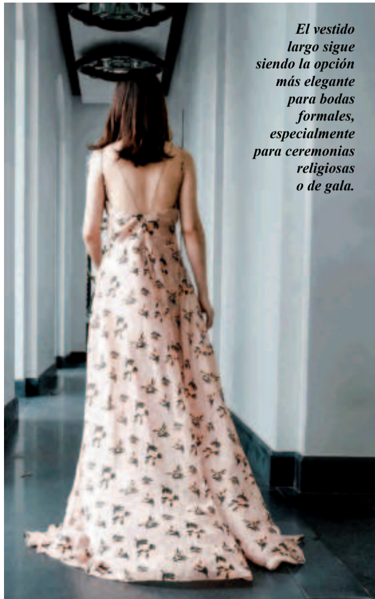
El vestido largo sigue siendo la opción más elegante para bodas formales, especialmente para ceremonias religiosas o de gala.

En cuanto a los cortes y estilos, las tendencias de 2025 se centran en la mezcla de lo clásico y lo moderno, con opciones que van desde lo más minimalista hasta lo más elaborado.