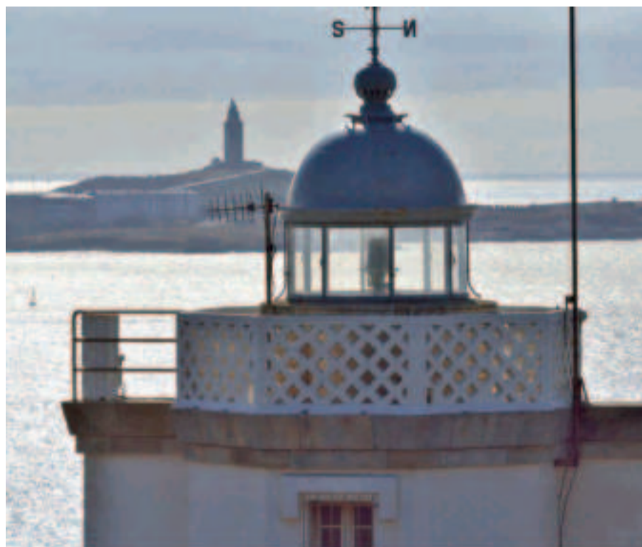
Faro de Mera (Oleiros).

Muy cerca de Betanzos, en el municipio de Bergondo, se erige el majestuoso Pazo de Mariñán (declarado en 1972 Conjunto Histórico Artístico) con su jardín de estilo francés de gran variedad botánica. Plátanos de más de 50 metros de altura, eucaliptos centenarios, cipreses de Portugal, chopos negros y coloridas camelias decoran esta joya arquitectónica que alberga también el llamado Jardín de la Palabra en donde cada árbol conserva a su pie el mensaje de algunos ilustres visitantes, la mayoría poetas, que lo plantaron.