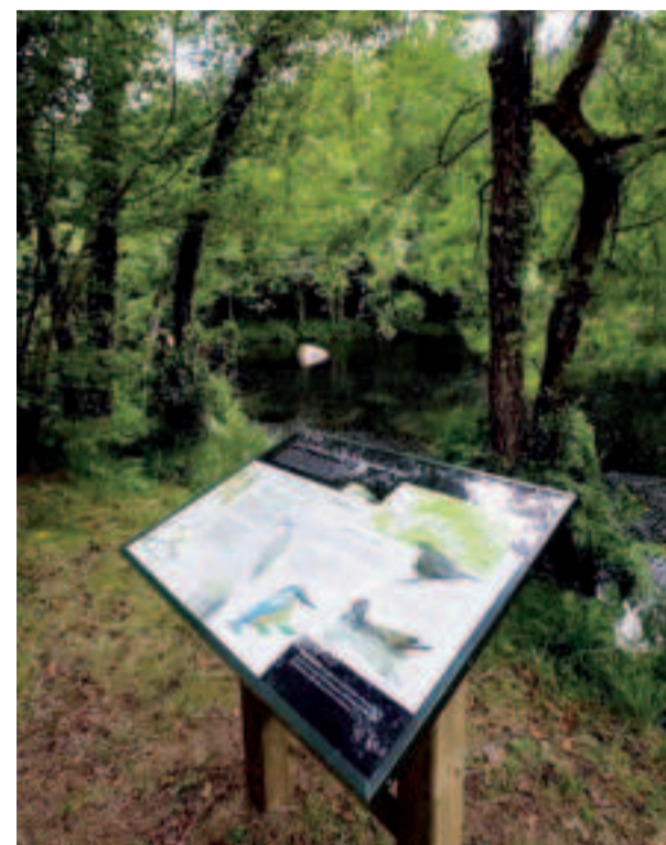
Lugar de Chelo.