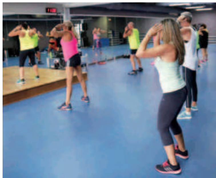
Clases de zumba en el complejo deportivo de Acea de Ama.

Las plazas son limitadas y se da preferencia a aquellas familias empadronadas en el municipio.