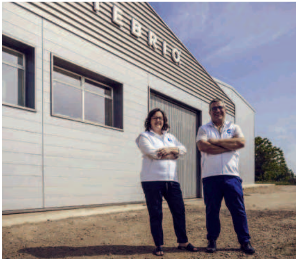
Tebrio es actualmente, la planta de cría y transformación de insectos más grande del mundo.

Adoptar un modelo de residuo cero y trabajar hacia una huella de car-