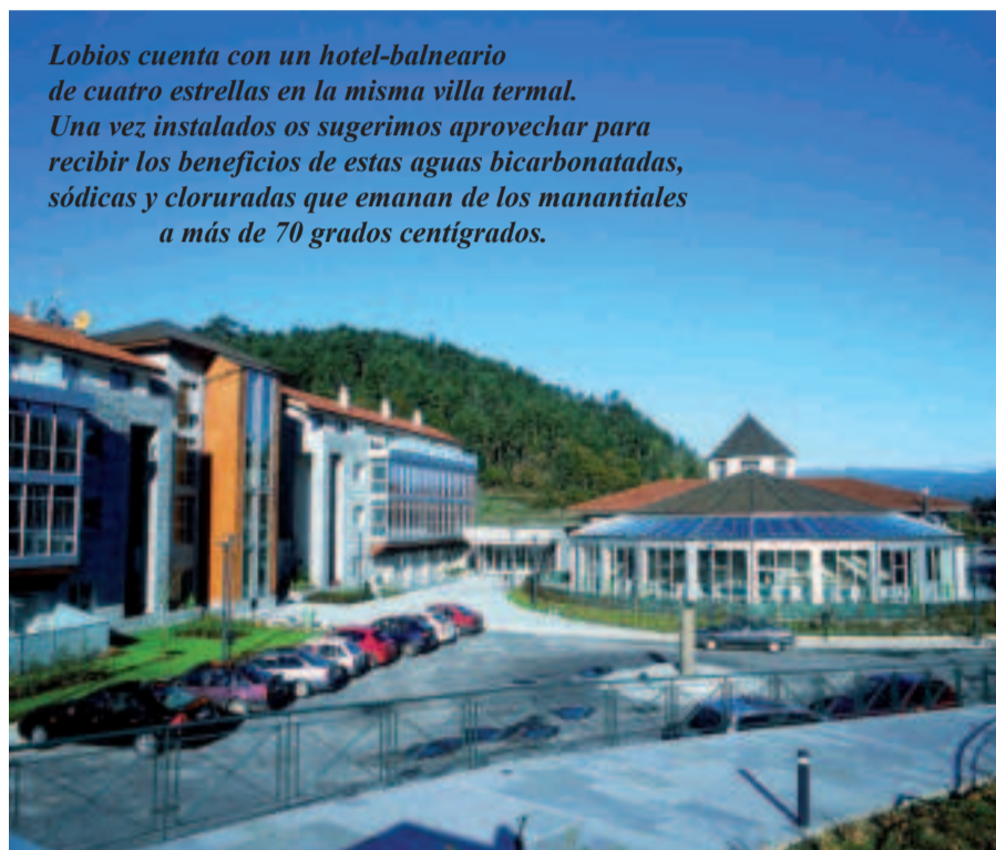
Balneario de Lobios.

Lobios cuenta con un hotel-balneario de cuatro estrellas en la misma villa termal. Una vez instalados os sugerimos aprovechar para recibir los beneficios de estas aguas bicarbonatadas, sódicas y cloruradas que emanan de los manantiales a más de 70 grados centígrados.