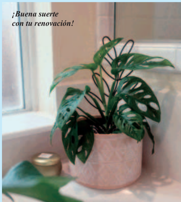
¡Buena suerte con tu renovación!

Añade cuadros, una colección de fotografías, una escultura o elementos decorativos como velas y jabones artesanales para personalizar el espacio. Se trata de que un cuarto de baño anodino gane en interés decorativo, ya que, actualmente, hemos pasado a considerar el baño como cualquier otra estancia de la casa y no como un lugar aséptico y aburrido. Pon en práctica alguno de estos consejos y podrás transformar tu cuarto de baño en un espacio más agradable y acogedor.