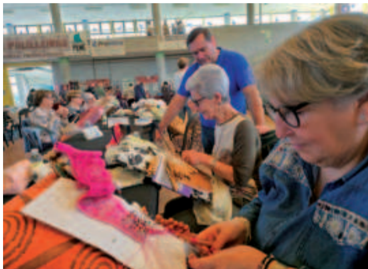
Imagen de la Xuntanza de Palilleiras del año pasado.

técnicas. Las personas interesadas en tomar parte pueden solicitar más información e inscribirse a través del número de teléfono: 981 492 767 .