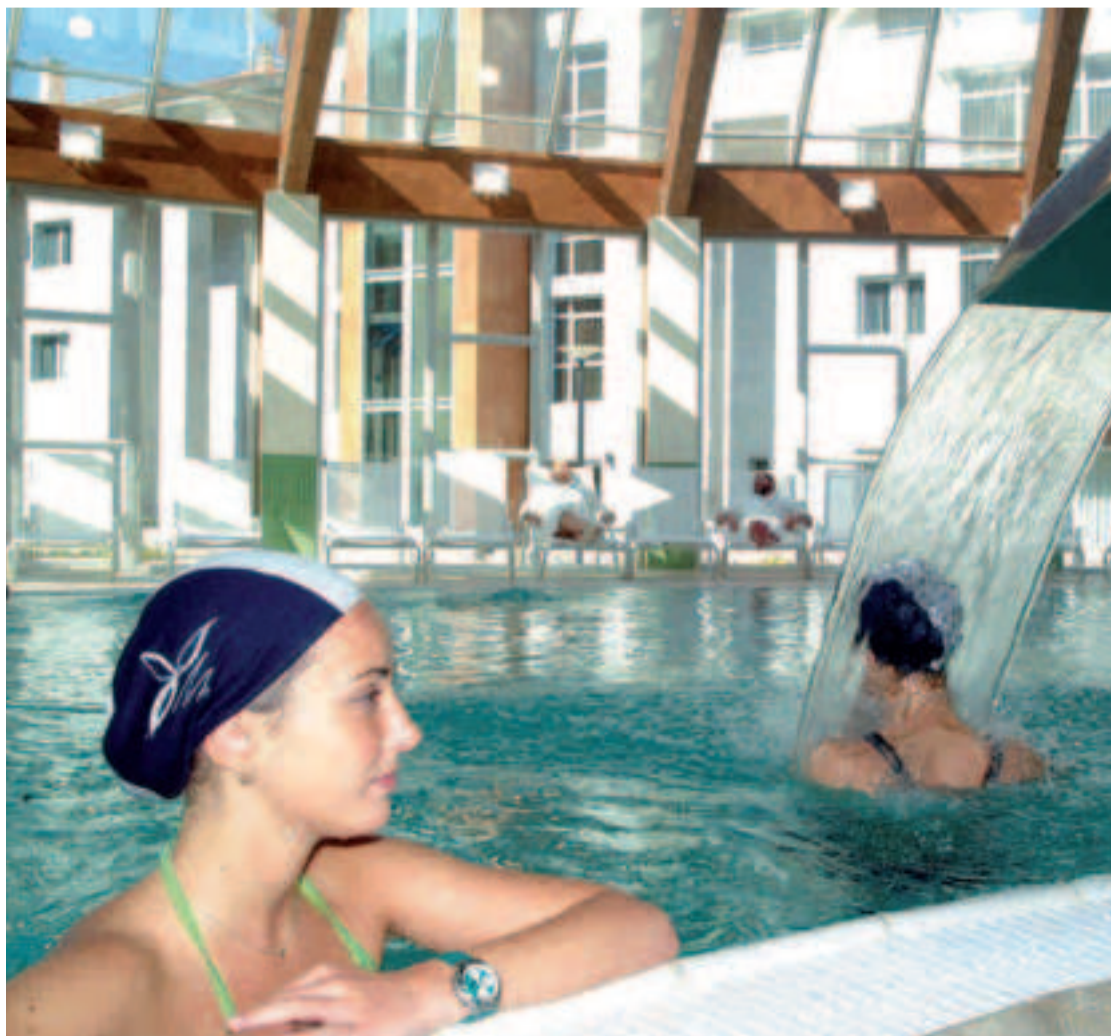
Balneario de Lobios.