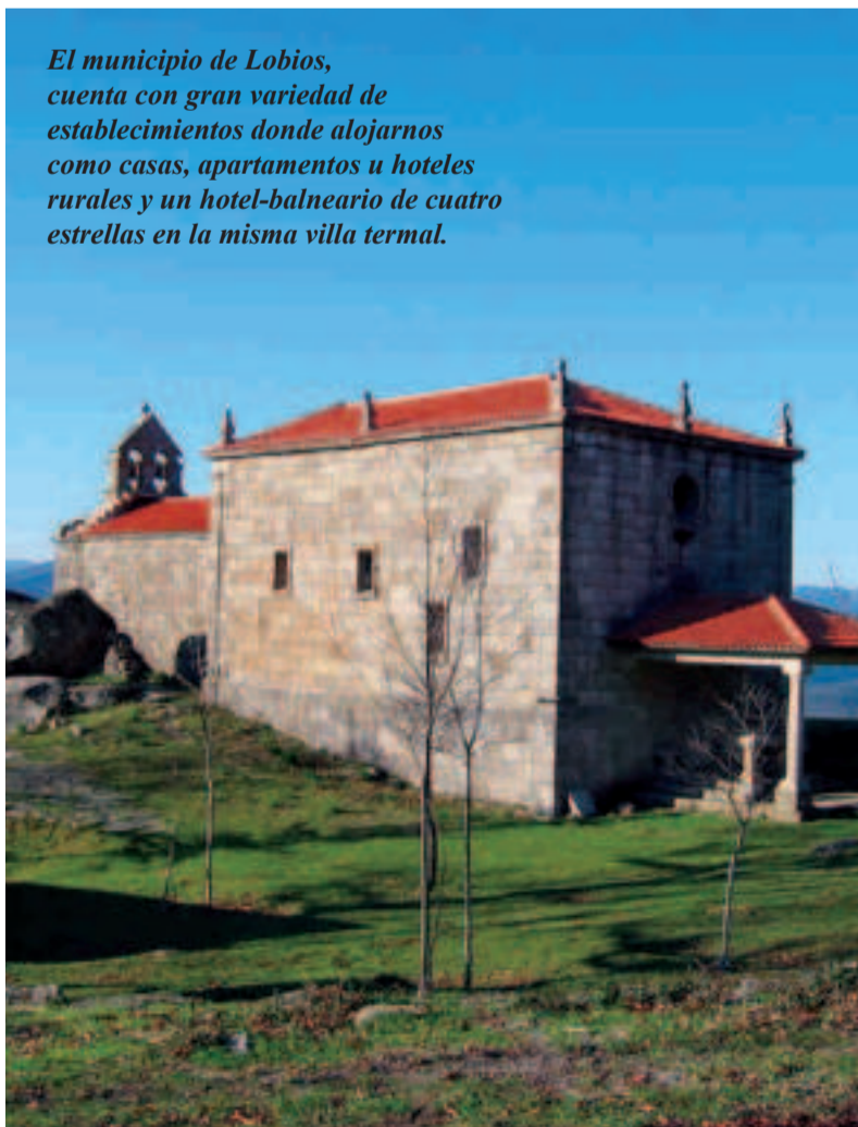
Ermita de Nosa Señora do Xurés.

El municipio de Lobios, cuenta con gran variedad de establecimientos donde alojarnos como casas, apartamentos u hoteles rurales y un hotel-balneario de cuatro estrellas en la misma villa termal.