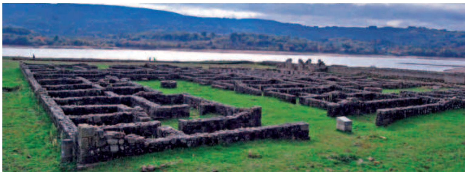
Yacimiento romano Aquis Querquennis.