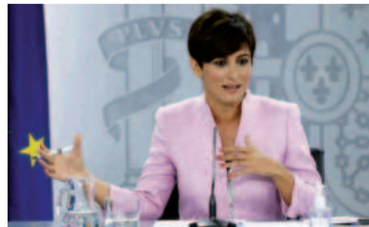
Isabel Rodríguez durante la sesión de control al Gobierno en el Congreso de los Diputados.

España cuenta con 8,2 casas vacías por cada 100 ciudadanos, según el mismo estudio, que certifica que entre 2011 y 2021 el número de inmuebles vacantes ha aumentado en 400.000 unidades, alrededor de un 10%. A esta cuantía, hay que sumar cerca de un millón más de pisos y chalés, cuyo consumo eléctrico es mínimo y están ocupadas menos de 15 días al año, parámetro utilizado por el organismo público para discernir si se trata o no de una vivienda vacía. "Ojalá podamos emitir licencias en menos tiempo del que tardamos en construir una promoción, de media 18 meses. No hay nadie más interesado en esto que la ministra de Vivienda y Agenda Urbana, y aquí tiene mucho que decir el PP, que gobierna la mayoría de las comunidades y ayuntamientos", añadió.