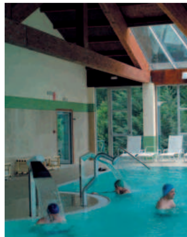
Balneario de Lobios.