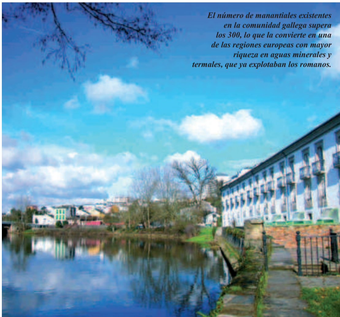
Balneario de Lugo.

El número de manantiales existentes en la comunidad gallega supera los 300, lo que la convierte en una de las regiones europeas con mayor riqueza en aguas minerales y termales, que ya explotaban los romanos.