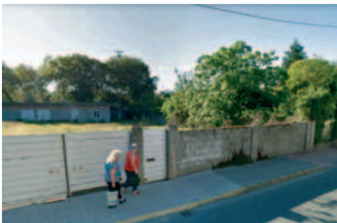
Terrenos previstos para el futuro centro de salud de Sada.

La Junta de Gobierno Local del Ayuntamiento de Sada ha aprobado inicialmente el Plan Especial de Reforma Interior (PERI) de la rúa da Lagoa. El proyecto tiene como objetivo, señalan fuentes municipales, terminar la estructura urbana del municipio y permitirá dotarse de una parcela de más de 2.600 m 2 que será cedida a la Xunta para la construcción del nuevo centro de salud de Sada. El plan contempla la construcción de viviendas plurifamiliares en bloque abierto con una altura máxima de cuatro plantas (bajo y tres pisos), destinando el 30% del aprovechamiento residencial a vivienda protegida. También servirá para consolidar los espacios libres y zonas verdes, con una superficie de algo más de 1.300 m 2 y nuevas zonas de ocio para la población que servirán