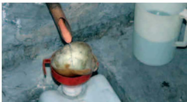
El mezcal va cayendo gota a gota en la garrafa.