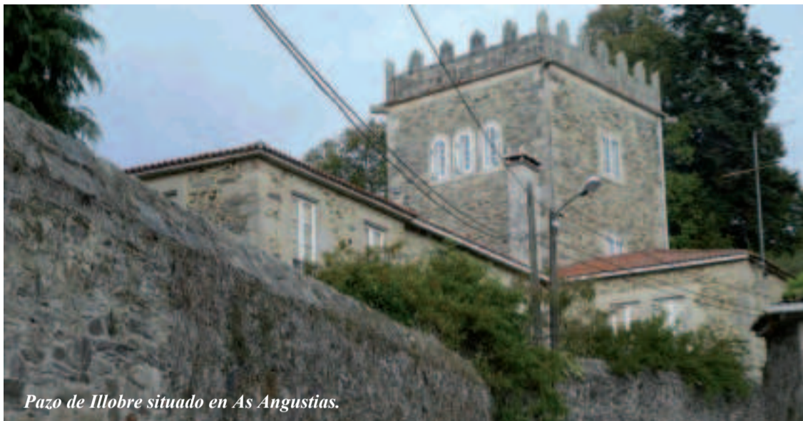
Pazo de Illobre situado en As Angustias.