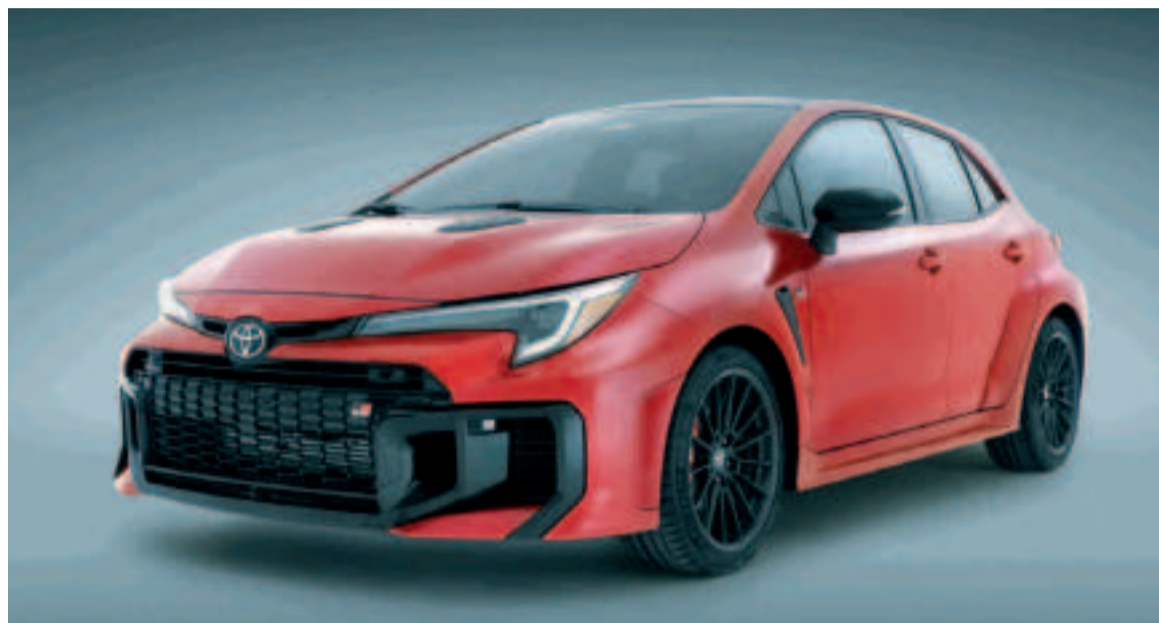
Toyota GR Corolla 2025.

Otra novedad es que el GR Corolla no solo estará disponible con cambio manual de seis velocidades,