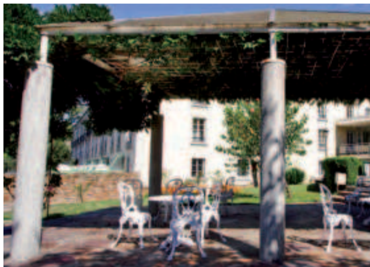
Balneario de Lugo.