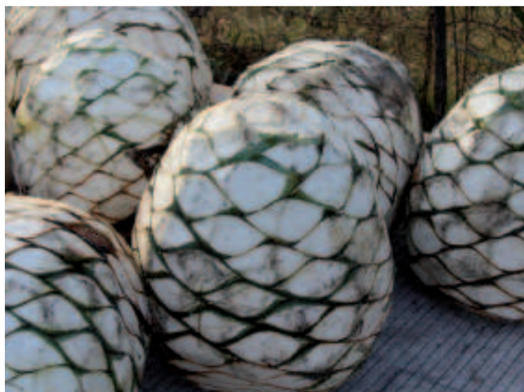
Piñas del Agave de donde se extrae el mezcal.