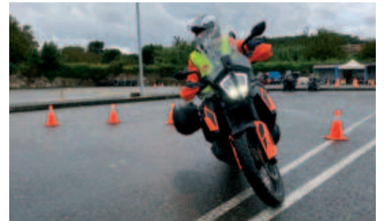
Clase práctica de conducción segura.

La Consellería de Vivenda e Planificación de Infraestructuras, a través de la Axencia Galega de Infraestructuras, tiene en marcha, en colaboración con colectivos y con el resto de las administraciones el "Plan de Seguridad Vial 2022-2025. Visión cero", que persigue la eliminación de fallecidos y heridos graves provocados por los accidentes de tráfico.