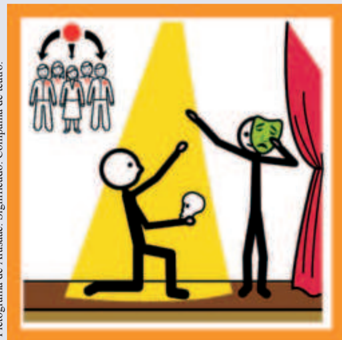
*Pictograma de Arasaac. Significado: Compañía de teatro.

*Texto dedicado a mis compañeros y artistas de Asociación Diversos.