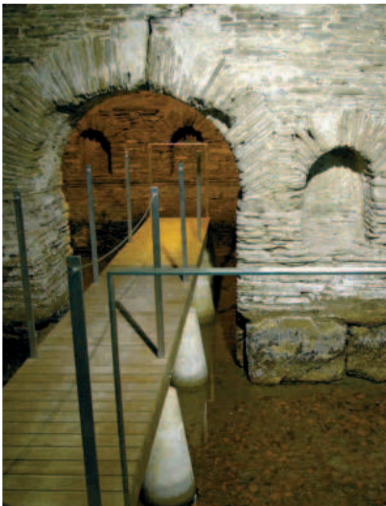
Balneario de Lugo - Termas Romanas.

Adentrarse en la catedral nos llevará a un interior único ya que, de las cinco sedes episcopales gallegas, sólo Lugo conserva la sillería del coro en el centro del templo. En la cabecera nos aguarda otra sorpresa, la capilla de la Virgen de los Ojos Grandes, de gran devoción en la ciudad.