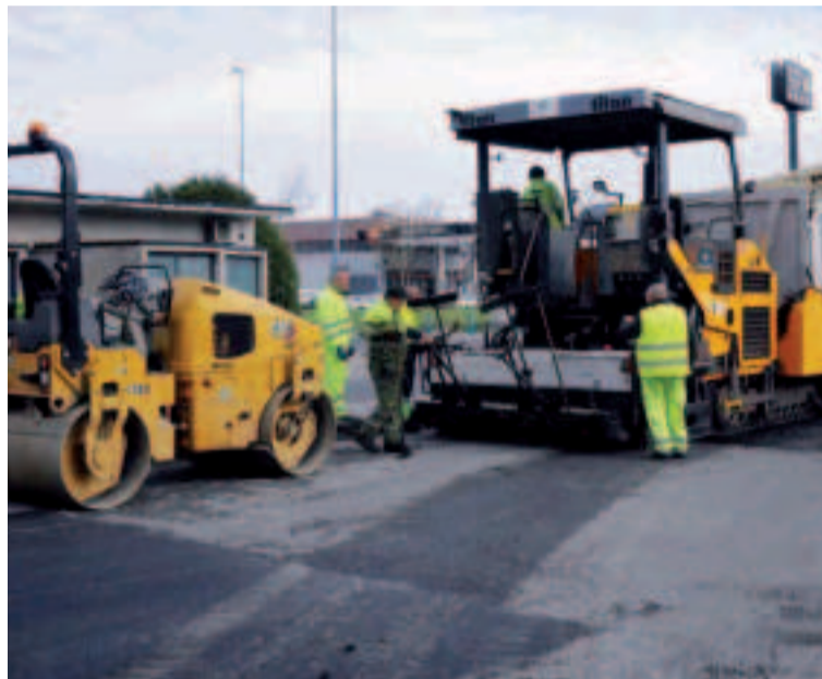
El Concello está ejecutando la mejora de las calles.

Culleredo ha tenido que esperar nueve años para que se haga efectivo el rescate de la concesión del Centro Logístico de Transportes (CLT), situado en Ledoño, a un paso de la A-6. Un proceso que aún no ha finalizado porque le falta por recibir el aparcamiento de vehículos pesados y la báscula.