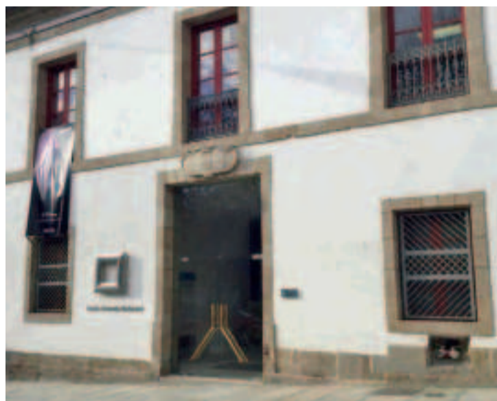
Centro Cultural Torrente Ballester en Ferrol.