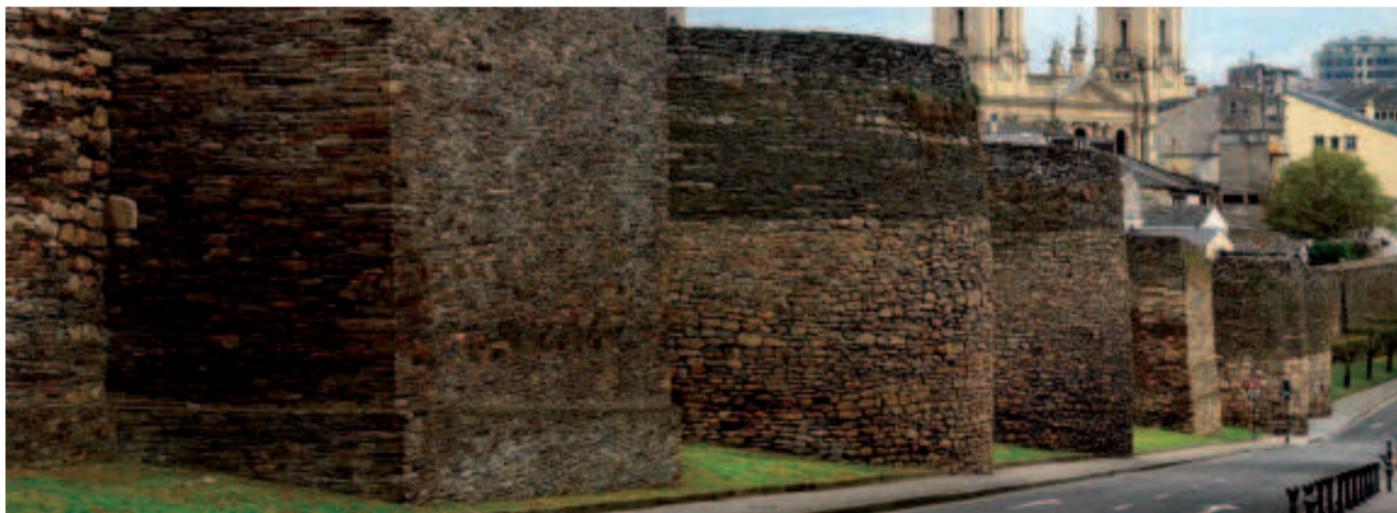
Muralla romana de Lugo.