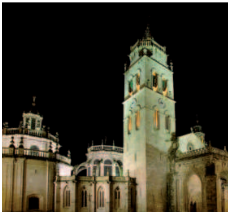
Catedral de Lugo.

Haremos una última foto familiar junto al monumento que representa a los fundadores de la ciudad. Luego regresaremos al hotel para recoger las maletas y poner punto final a este recorrido por la historia de Galicia, la naturaleza y los beneficios de nuestras aguas mineromedicinales.