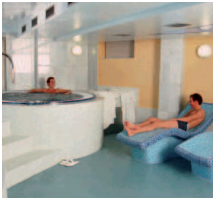
Balneario de Lugo.