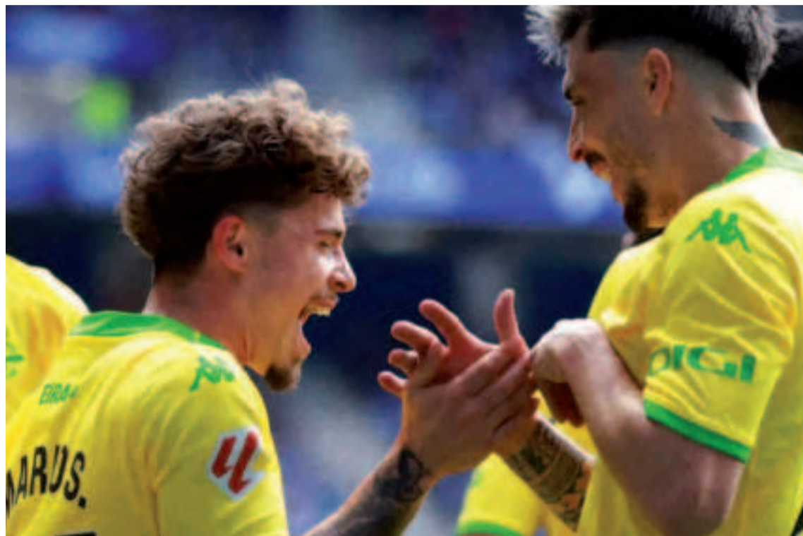
Los jugadores del Deportivo se abrazan celebrando un gol en el Tartiere.

En uno de los saques de esquina generados por los azules funcionó