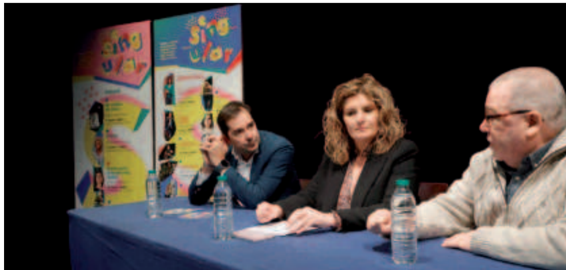
Habrán ocho espectáculos para público adulto y cuatro para infantil.

entender(nos) mellor" y, por último, "Lúa quere viaxar a... Marte!", el día 30. Todas ellas darán comienzo a las 18.00 horas y tendrán lugar en el Café Teatro do Pazo da Cultura. Además, se llevarán a cabo actividades paralelas como un obradoiro, del 10 al 13 de marzo, "O actor e o seu proceso creativo", de la mano de Beatriz Viñas o la cita "Encontro con programadores nacionais e internacionais (miembros de Redelae) e compañías de teatro galego", durante la jornada del día 22.