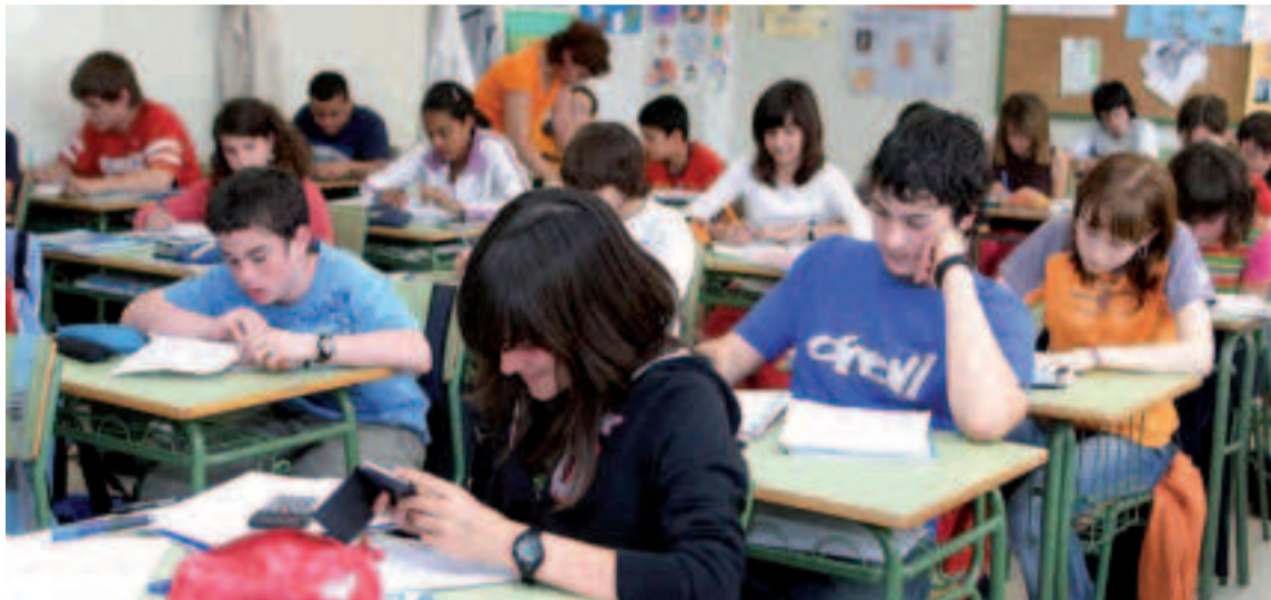
Alumnos de ESO.

Los alumnos españoles de 2º de la ESO sacan mejor puntuación en competencia digital (495) que la media internacional (476), aunque se sitúa por debajo de otros países europeos como República Checa (525), Dinamarca (518), Bélgica (511) o Portugal (510). Los alumnos coreanos son los que sacan mejor puntuación (540) y los de Azerbaiyán, la peor (319). Así lo refleja el estudio ICILS 2023 elaborado por la Asociación Internacional para la Evaluación del Rendimiento Educativo, que evalúa la competencia digital de los estudiantes de segundo de Educación Secundaria Obligatoria.