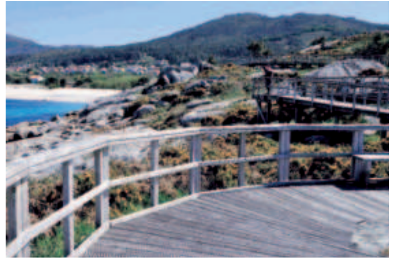
Da Praia de Mar de Lira a Portocubelo.

Para los que tengan un interés cultural, desde la praia Mar de Lira pueden subir hasta la iglesia y gozar de las vistas, así como del hórreo de su Casa Rectoral, uno de los más largos de Galicia junto con el de O Araño en Rianxo y el de Carnota.