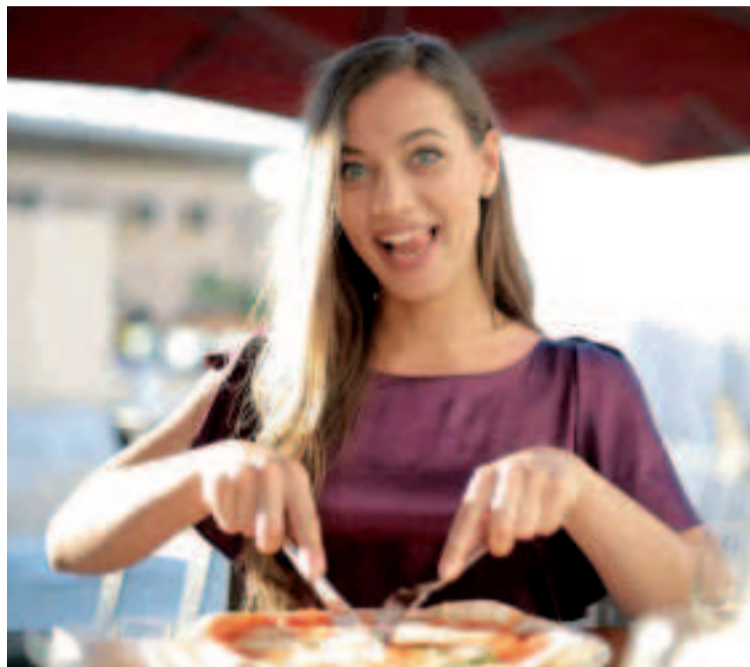
Ni se te ocurra comerte una pizza con cuchillo y tenedor en Nueva York.