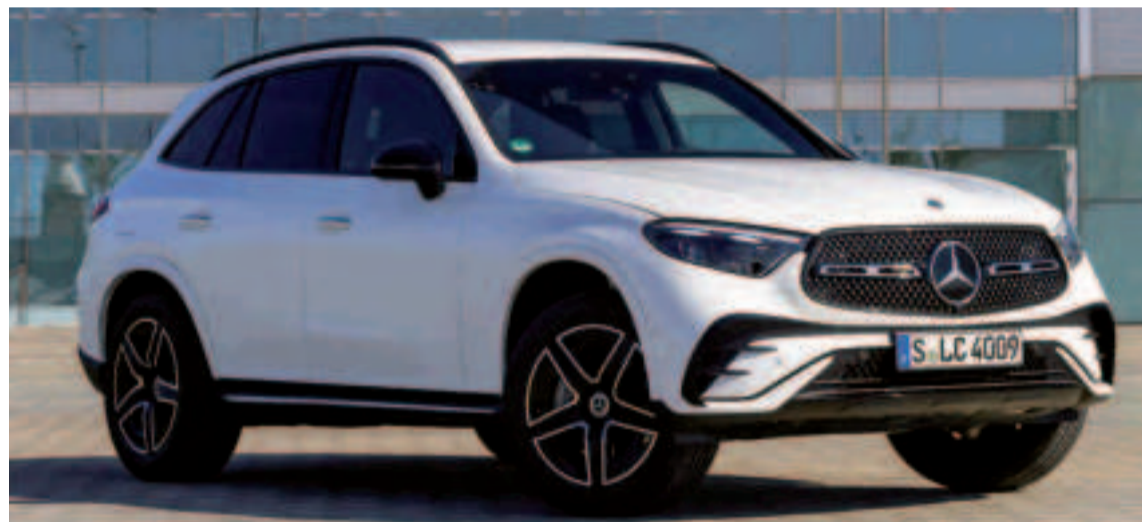
El GLC, junto al Clase E, serán más baratos en 2025 para recuperar la demanda.