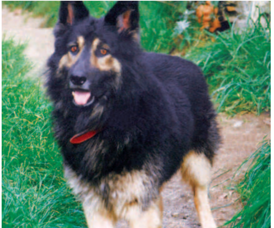
Apolo, mi perro.

¡Que los animales compartan nuestra vida es una bendición!