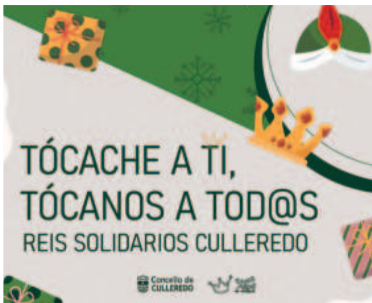
Cartel promocional de la campaña.

Para más información, los canales de contacto habilitados son el número de Whatsapp 620 008 450 o el correo electrónico omvol@culleredo.es