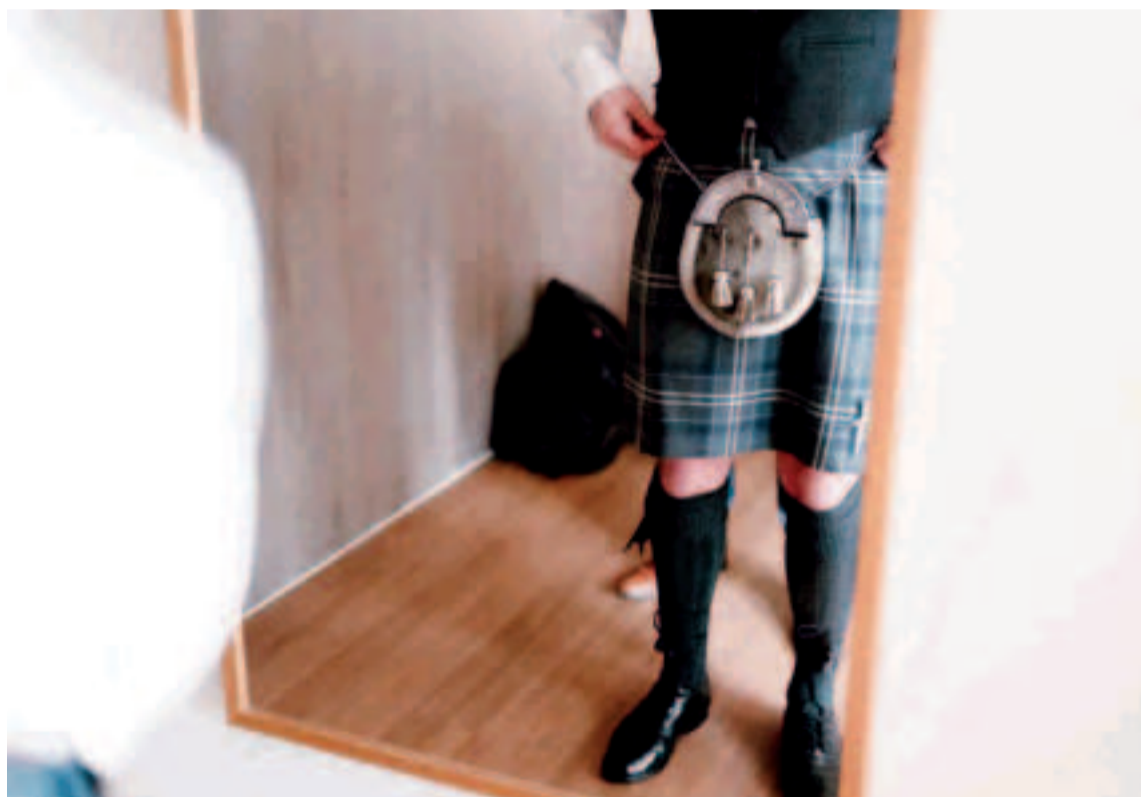
Ojo, si estás en Escocia con un kilt y ropa interior, prepárate para invitar a tus amigos.