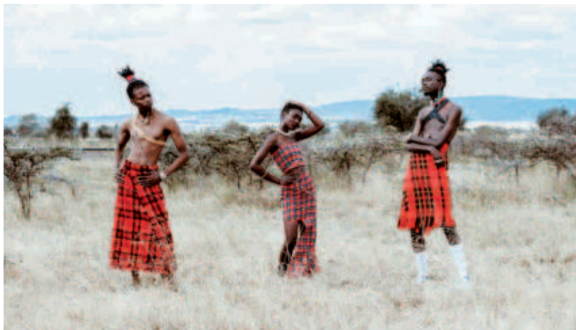
En Kenia, la cerveza... ¡Caliente!

haces después. Mascar chicle en público está prohibidísimo, a menos que te lo haya recetado un médico. ¿Sorprendido? Singapur es uno de los lugares más limpios del mundo, y esta ley es parte de esa política de limpieza.