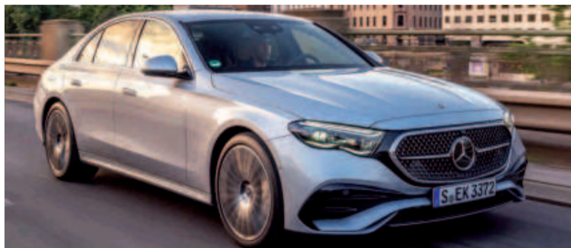
El nuevo Mercedes Clase E será más accesible en 2025 con un nueva opción diésel.

Caja cambios: Aut. 9v 0-100 Km/h: 9 s V. Máxima: 214 km/h Consumo: 5,7 - 5,0 Tracción: Total