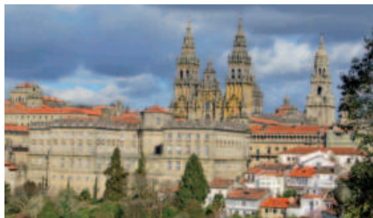
Catedral de Santiago desde la Alameda.

Os recomendamos despediros de Santiago con una mirada sorprendente de la ciudad a vista de pájaro, programando una visita a las cubiertas de la catedral a vista de pájaro, programando una visita a las cubiertas de la catedral. Una experiencia única en la que, acompañados por un guía, recorreremos las salas del Pazo de Xelmírez, xoia do Románico civil.