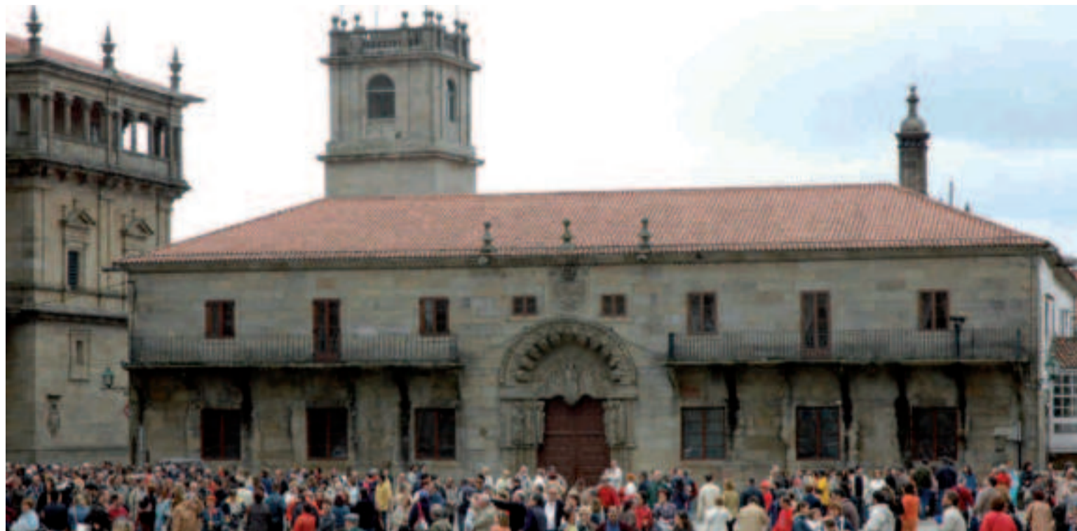
Colexio de San Xerome.

Cerca de la catedral, en el ala del Pazo de San Xerome que mira a la Rúa Fonseca, podemos realizar el mismo rito que suele practicar todo universitario que llega a Santiago por primera vez ante el "árbol de la ciencia". Se trata de señalar con el brazo, de espaldas al árbol, una de sus ramas de conocimiento. Al volvernos para mirar descubrimos para qué disciplina de las artes, las letras o las ciencias estamos dotados, según los diseños del árbol. Después podemos pasear por la céntrica y transitada Rúa do Vilar, donde se ubicaba el entrañable Cine Yago, en el que se proyectaron las primeras películas de manos de la compañía Lumière y donde se hacían los espectáculos de variedades. También se encuentra una de las tiendas más antiguas de Santiago, una coqueta sombrerería de un siglo de existencia, que sigue conservando el toque auténtico de época. Luego nuestros pasos nos llevarán hasta la Alameda. Aquí obtendremos una de las más bellas panorámicas de la ciudad. Además, tendremos la oportunidad de probar la especial acústica de un banco semicircular situado junto al palco de música, tal como lo hacían los enamorados en la época decimonónica para dedicarse palabras de amor en la distancia pero que so-