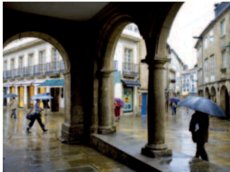
Rúa do Vilar.

En el casco histórico, cerca unos de otros, encontramos desde restaurantes selectos y de autor a casas de comidas, mesones, tabernas tradicionales o tentadoras marisquerías. Todas las opciones están abiertas: irse de vinos y tapas o decantarse por platos más elaborados, como los pescados en caldeirada o los mariscos al vapor y a la parrilla, sin olvidar la excelencia de la ternera gallega.