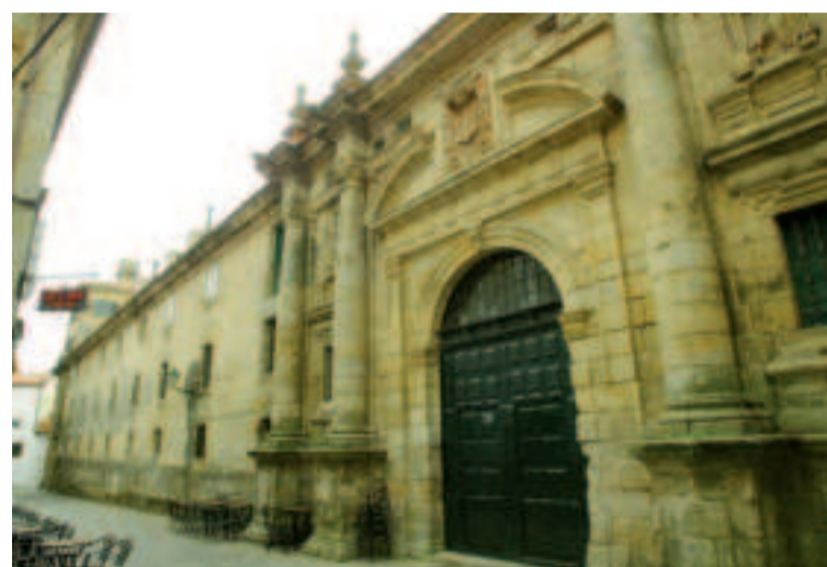
San Paio de Antealtares.