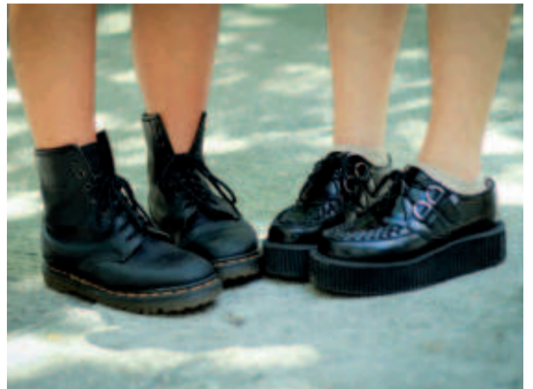
Botas / Mocasines.

La estética colegial vuelve con fuerza, y si hay una pieza que nos transporte a nuestra infancia esa es este