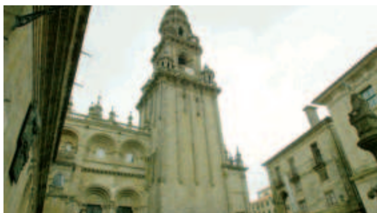
Torre do Reloxo.