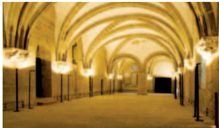
Pazo de Xelmírez.