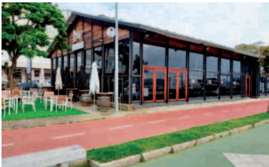
Club Náutica de Sada.

deportivas el Gobierno gallego otorga ayudas a doce concellos por instalación y equipamiento por más de 380.000 euros. En toda el área metropolitana son en concreto 174 clubes y entidades deportivas las que reciben estas ayudas.