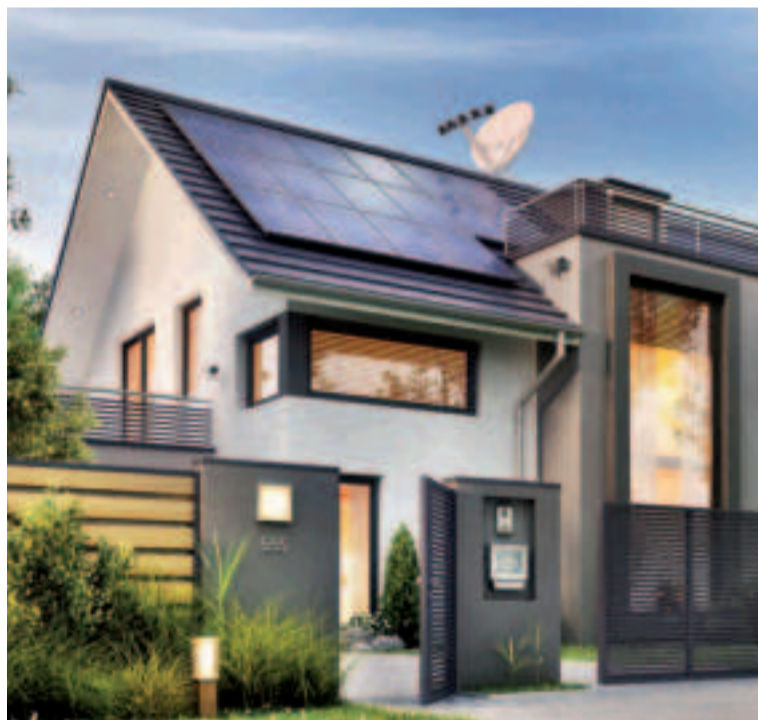
La desagregación de resultados por nacionalidades permite observar cómo aquellas que suelen estar en cabecera han perdido peso relativo porcentuales.

Pese a que el resto de nacionalidades ha comprado menos de 1.000 casas, su peso ha aumentado frente al trimestre pasado como son polacos (3,92%), rusos (3,43%), chinos (3,09%), suecos (2,94%), ucranianos (2,72%) o irlandeses (1,66%).