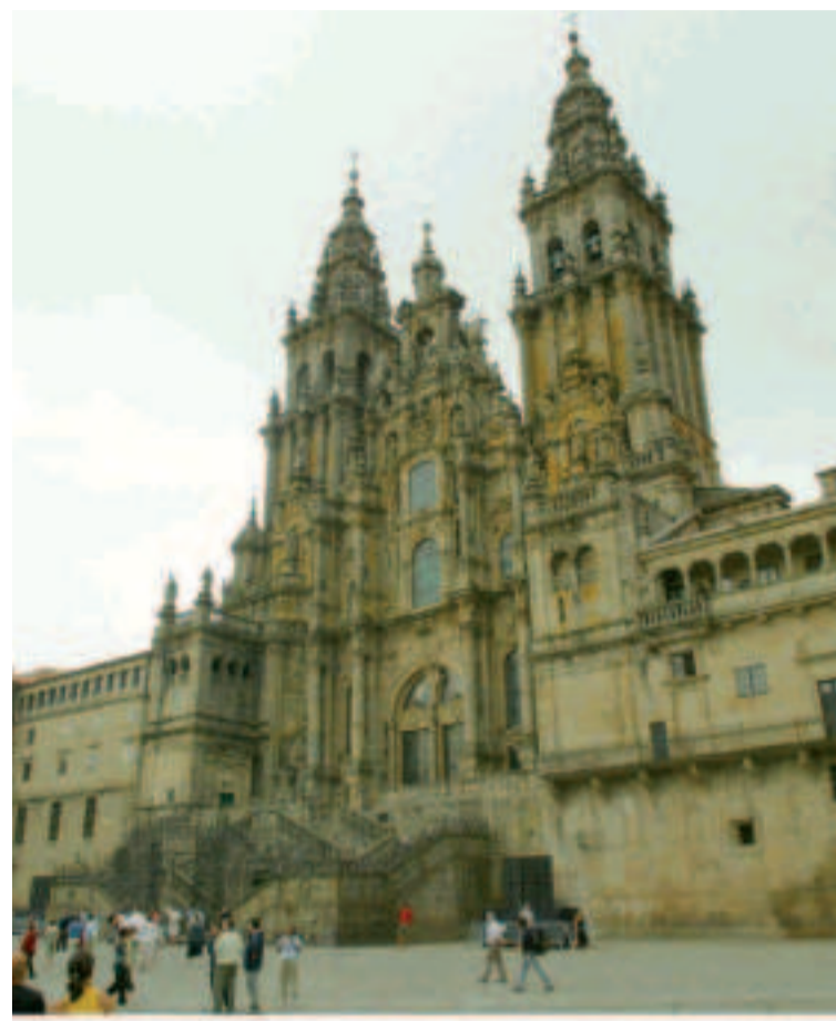
Catedral de Santiago de Compostela.

En la Oficina también podréis sellar las "credenciales de peregrino", que además os sirven para obtener descuentos en algunos de los lugares que visitéis y solicitar el certificado tradicional de la peregrinación, la famosa "Compostela", de origen medieval. Se concede a aquellos que han recorrido a pie o a caballo los últimos 100 kilómetros del Camino o 200 kilómetros en bicicleta y manifestar, como mínimo, que se hace por motivo religioso. Si vuestra llegada coincide en fechas litúrgicas señaladas tendréis la suerte de vivir una experiencia única y emocionante: ver el vuelo pendular del botafumeiro. Tened en cuenta que en la catedral está permitido fotografiar y grabar en los espacios de libre acceso pero sin flash ni trípode. Además de la obra más universal del templo, el Pórtico da Gloria, su interior guarda una gran riqueza artística que iremos descubriendo. Es tradicional la visita al Santo subiendo al camarín del altar mayor y darle el habitual abrazo a su estatua.