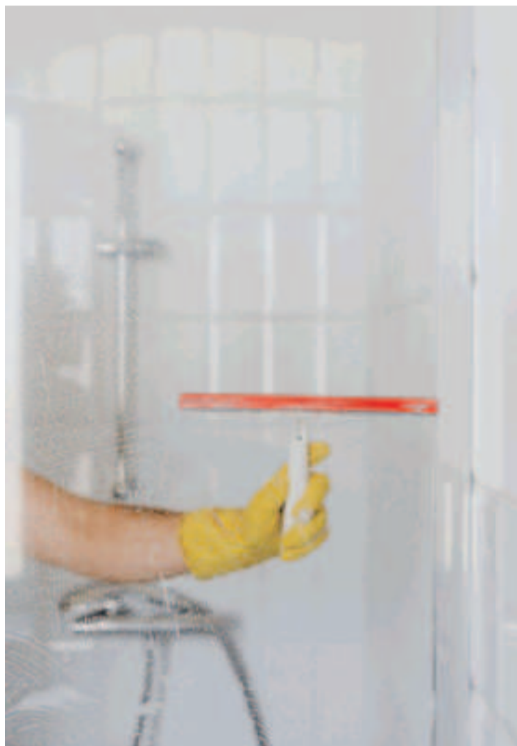
Limpieza de una mampara de baño con una escobilla limpiacristales.

Dejar actuar la solución sobre el cristal unos minutos.