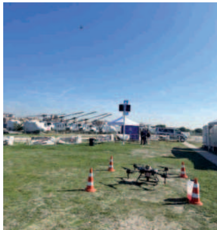
El inventariado de áreas de interés paisajístico, la inspección de carreteras, la aplicación de vehículos no tripulados para uso forense y policial o el seguimiento de especies y hábitats en medio marino en el Parque Nacional de las Islas Atlánticas son algunas de las nuevas soluciones identificadas.

La Airspace Integration Week fue el escenario en el que la directora de la Agencia Gallega de Innovación, Patricia Argerey, anunció el lanzamiento de una consulta preliminar para desarrollar un nuevo programa de soluciones que opte a la línea de Fomento de la Innovación desde la Demanda (línea FID) del Ministerio de Ciencia e Innovación. Este llamamiento a las empresas tecnológicas para co-