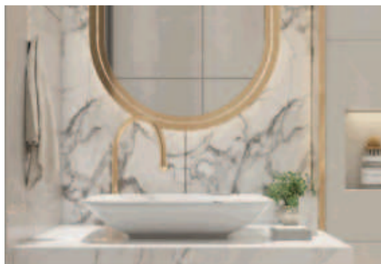
El espejo es pieza fundamental y foco de todas las miradas que, a la facilidad de cambiarse una la cualidad de poder aportar otro aire al espacio.