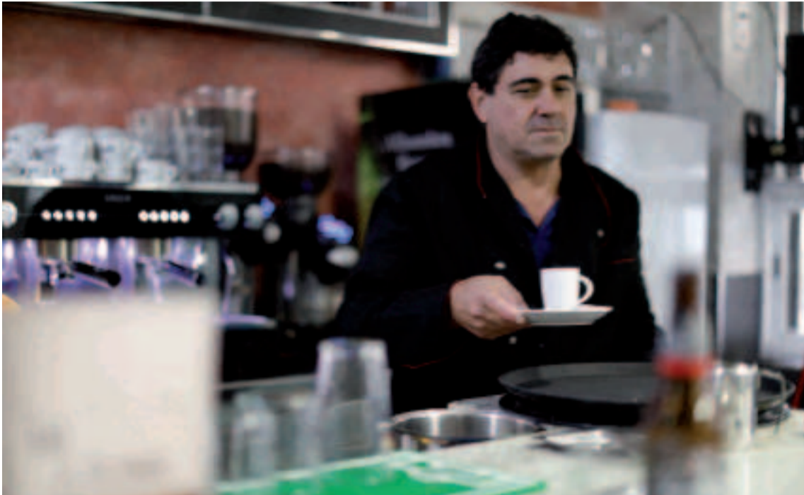
Imagen de una cafetería.