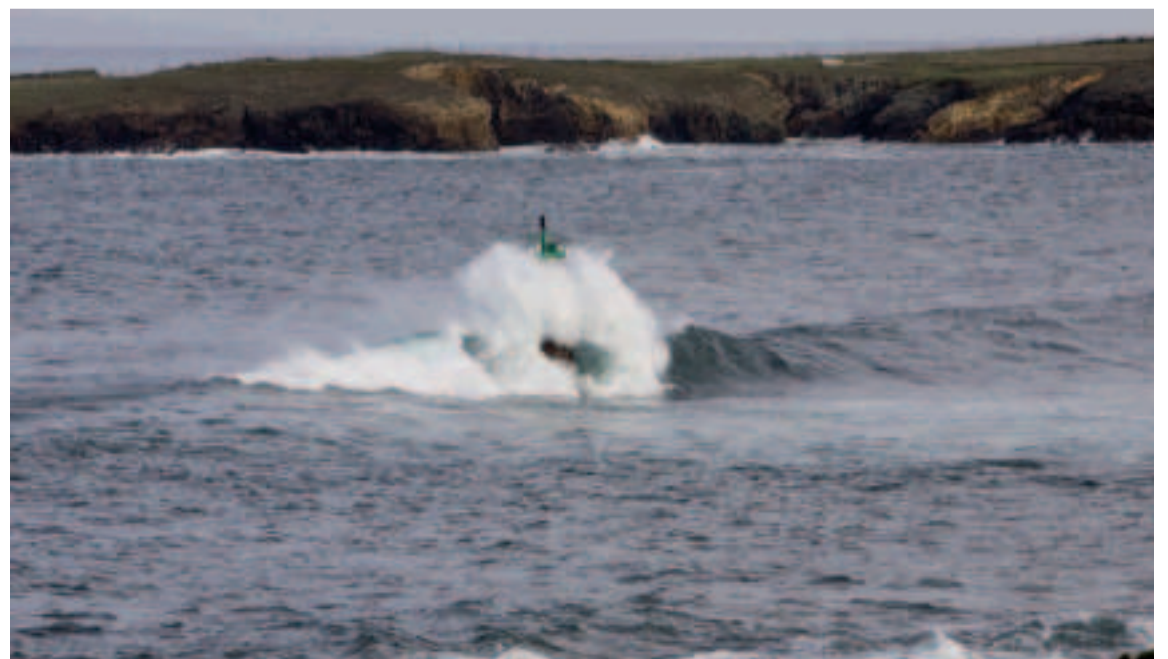
Faro. Ría de Foz.