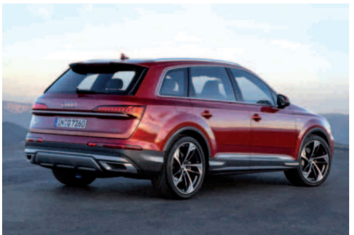
Las claves del segundo facelift del Audi Q7.

En esta recreación puedes ver este segundo facelift al que se está sometiendo el buque insignia de los SUV de los cuatro aros.