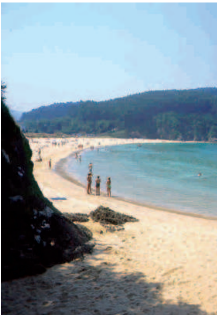
Playa de Xilloi (O Vicedo).