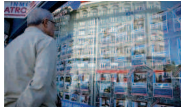
Los precios de venta son bajos en relación a los de alquiler.