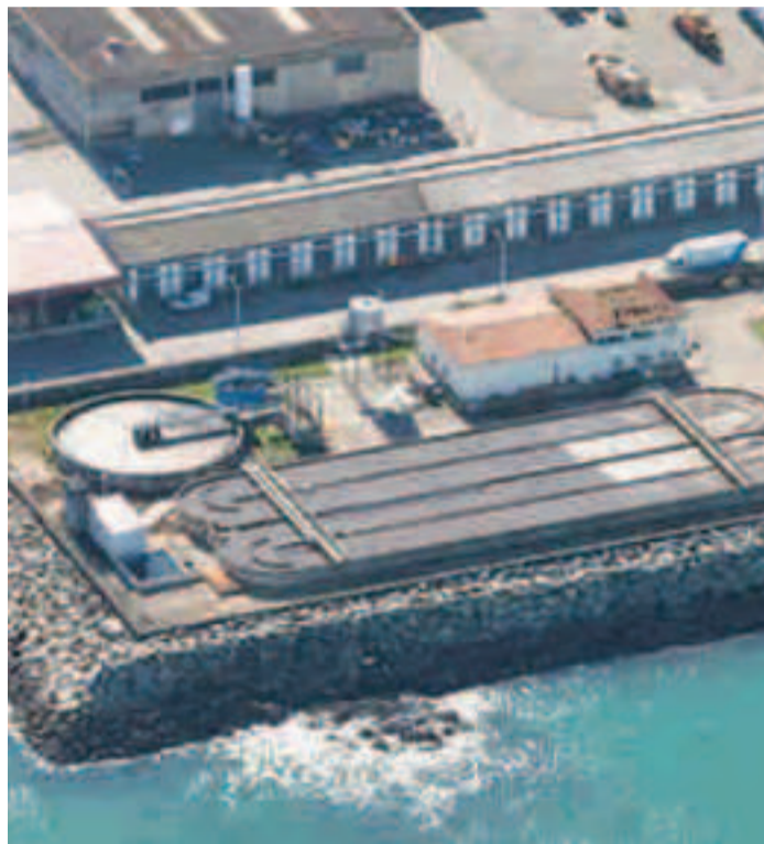
Los trabajos tienen un plazo de ejecución de 33 meses.

rectamente al mar, sin estar conectado actualmente con el emisario submarino”. Apuntaba también a diversas deficiencias en bombeos y colectores. El alcalde, Benito Portela, destaca que se trata de una obra “fundamental y prioritaria para Sada con un doble beneficio: social y ambiental”.