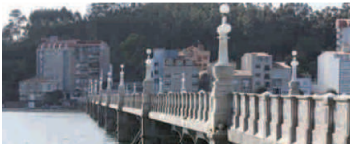
Pontevedra sigue liderando el mercado inmobiliario del litoral gallego.

El panorama en los kilómetros de costa de Lugo es el de la contención: en precios, en compraventas y en promociones nuevas. 941 euros se paga el metro cuadrado en esas viviendas de costa, donde la construcción inmobiliaria es prácticamente inexistente, dice Tinsa. En esta zona predomina la compra para uso propio.