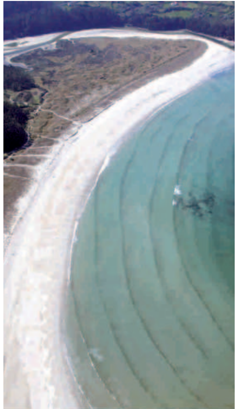
Playa de Vilarrube - Ría de Cedeira.

Entre Cabo Ortegaleira y Estaca de Bares se abre la sinuosa Ría de Ortigueira. Salpicada de playas y calas vírgenes, Ortigueira es una ría de exuberante vegetación y agrestes paisajes, coronada por la sierra de A Capelada, donde abundan los caballos salvajes y la "herba de namorar". Frente a la isla de San Vicente, a la que se puede llegar a pie con la marea baja, se extiende la espectacular praia de Morouzos, de más de 2 km. y rodeada de pinares. Frente a Cabo Ortegaleira están Os Aguillóns, unos espectaculares farallones que superan los 1.160 millones de años, convirtiéndose en unas de las rocas más antiguas de la tierra.