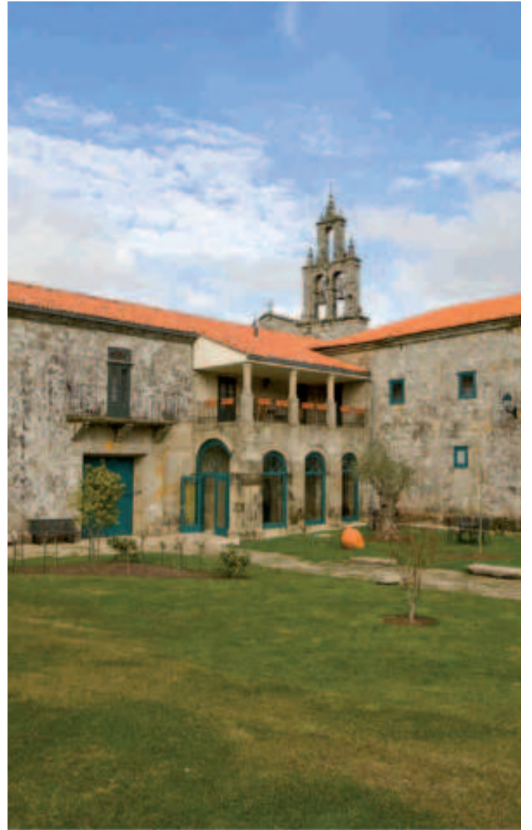
Monasterio de Santa María de Aciveiro.

La sierra de O Candán es un espacio singular y protegido como Zona Especial de Conservación desde el año 2014, Lugar de Interés Comunitario desde 2004 y forma parte de la Red Natura 2000.