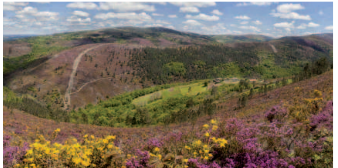
Serra do Candán.