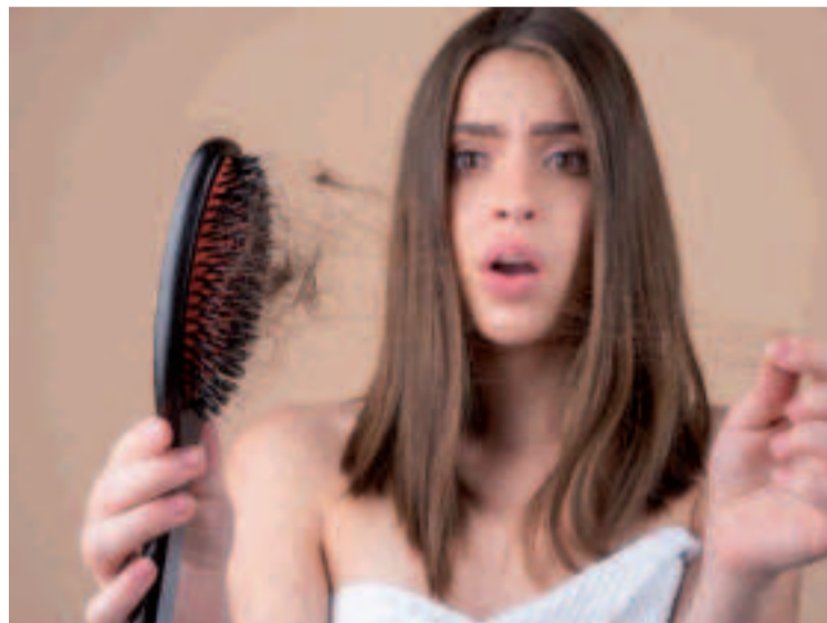
Llevar una vida sedentaria posee unas complicaciones que agravan el estado de nuestra salud general.

Pero, sobre todo, llevar una vida sedentaria posee unas complicaciones que agravan el estado de nuestra salud general, motivando patologías que también inciden en la caída del cabello. La principal es la de la obesidad, "un factor fundamental del síndrome metabólico, que deriva en riesgo cardiovascu-