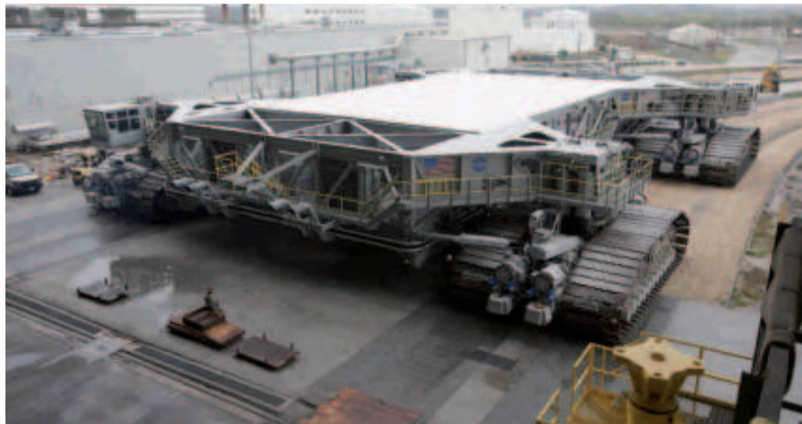
Crawler Transporter 2 El Crawler Transporter 2 consume 296 litros cada 100 km.

Se trata de un vehículo antiguo. De hecho, los Crawler Transporter 1 y 2 son originalmente de 1965, cuando el organismo aeroespacial presentó a la pareja como los encargados de transportar sus cohetes desde las plantas de ensamblaje hasta las plataformas de lanzamiento. Sin embargo, fue el número dos el que en 2012 empezó un proceso de actualización para poder llevar las naves modernas, todavía más pesadas. Y, por el camino, sumó