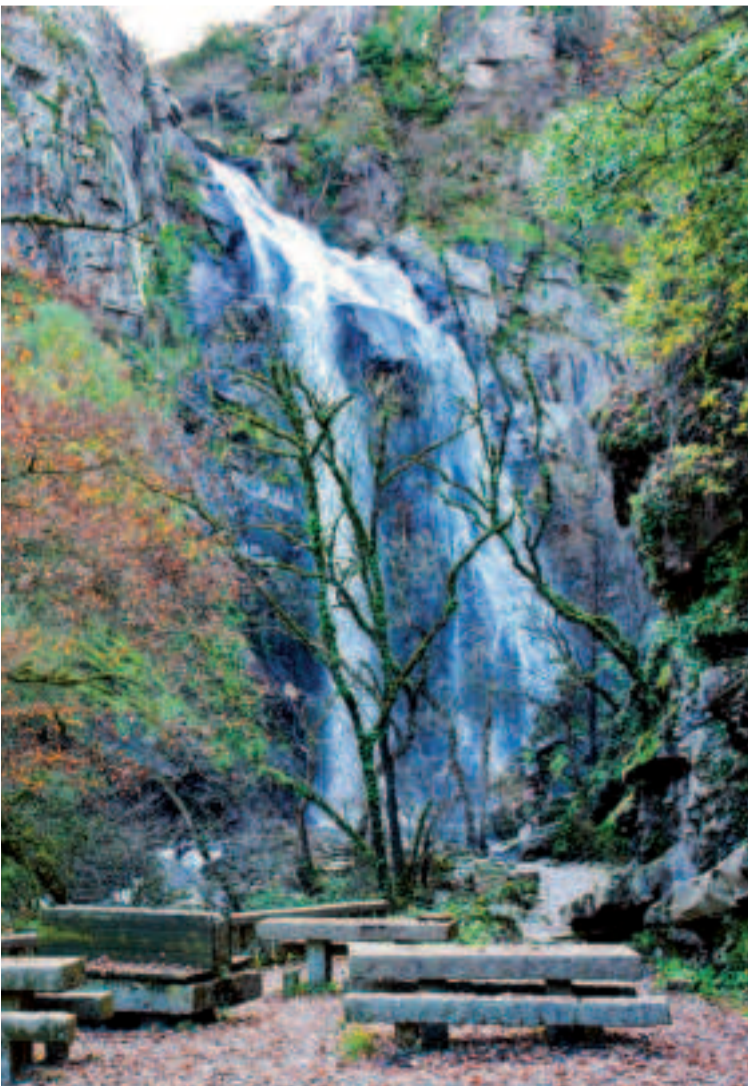
Cascada en el río Toxa, en Silleda.