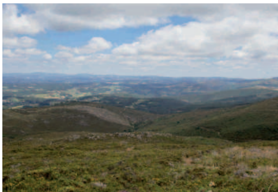
Mirador de O Candán.

El puerto de O Candán ofrece una amplia perspectiva de la comarca de Deza. Con las sierras de Faroy Farelo en la lejanía, la amplitud de vistas permite apreciar los valores naturales, estéticos y productivos de la comarca. El gran valle de Deza, rodeado por sierras y montes, constituye una sub-cuenca hídrica propia que forma parte de la vertiente del río Ulla. Ríos de tamaño medio, como el Arnego o el Asneiro, surcan el territorio creando una densa red de arroyos y riachuelos. El conjunto forma parte del Sistema fluvial Ulla-Deza, espacio natural protegido por sus bosques de ribera y por la acreditada presencia de peces.