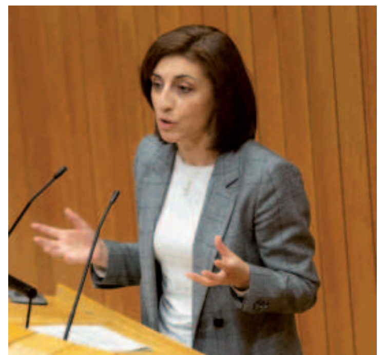
La conselleira de Medio Ambiente, Ángeles Vázquez.

La ley permite actividades "estratégicas" en la costa, entre ellas establecimientos de turismo litoral, como hoteles, siempre que sean en edificaciones "preexistentes". También permitirán los establecimientos de la cadena mar-industria, la actividades vinculadas a interacción entre puerto y ciudad, las dotaciones públicas para abastecimiento, saneamiento y depuración, las infraestructuras energéticas y las instalaciones de generación eléctrica que tengan que ocupar el mar, como las eólicas.