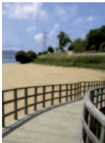
Playa de Caranza.

En la actualidad, este tramo cuenta con aceras deterioradas por el paso del tiempo, vehículos estacionados sobre ellas y “reparación puntuais efectuadas en distintos momentos”. El proyecto propone la demolición del pavimento de la actual acera norte del Camiño do Regueiro y la construcción de una nueva, ejecutada con baldosa hidráulica, “incluíndo novos bordos e recrecido de pozos e arquetas á nova cota, ademais da ampliación nas zonas máis estreitas para cumprir os parámetros de itinerario peonil accesible”. El conjunto de las intervenciones en los concellos asciende a 473.131 euros.