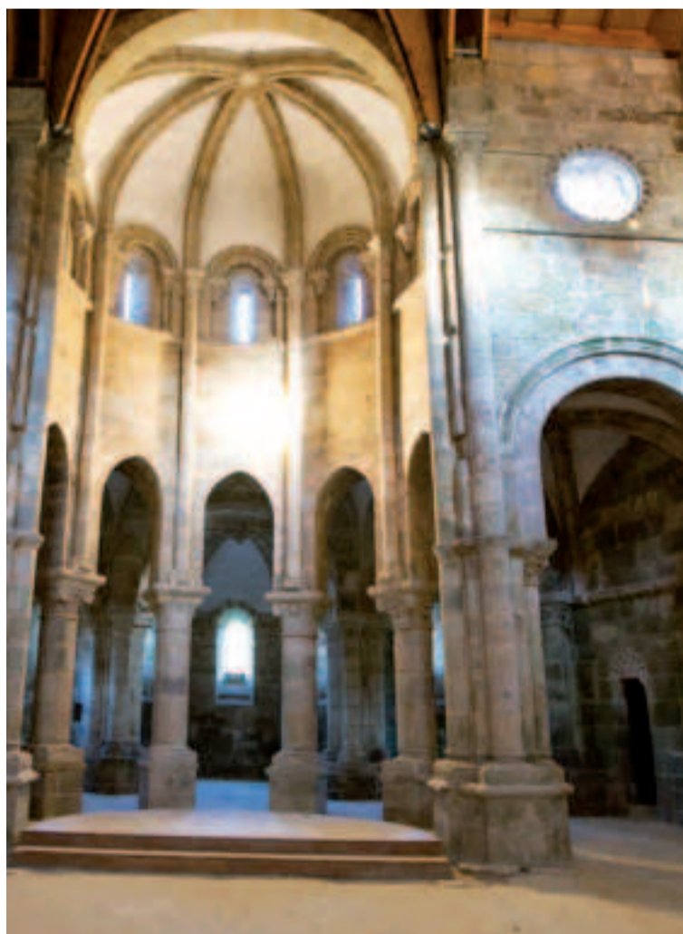
Monasterio de Carboeiro.