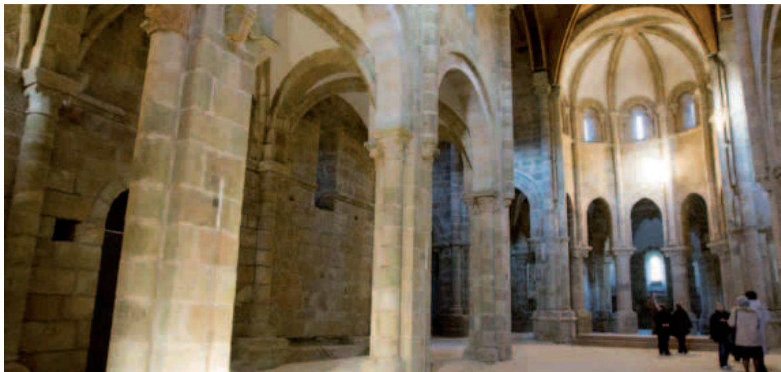
Monasterio de Carboeiro.

El monasterio de Carboeiro se esconde en un frondoso bosque, perfectamente integrado en un meandro del río Deza. Fundado en el siglo X como monasterio benedictino, es una de las obras más representativas del románico gallego, con pinceladas de transición al gótico. Su localización en un paraje lejano y abrupto nos traslada a épocas pretéritas, poniendo fin a este itinerario.