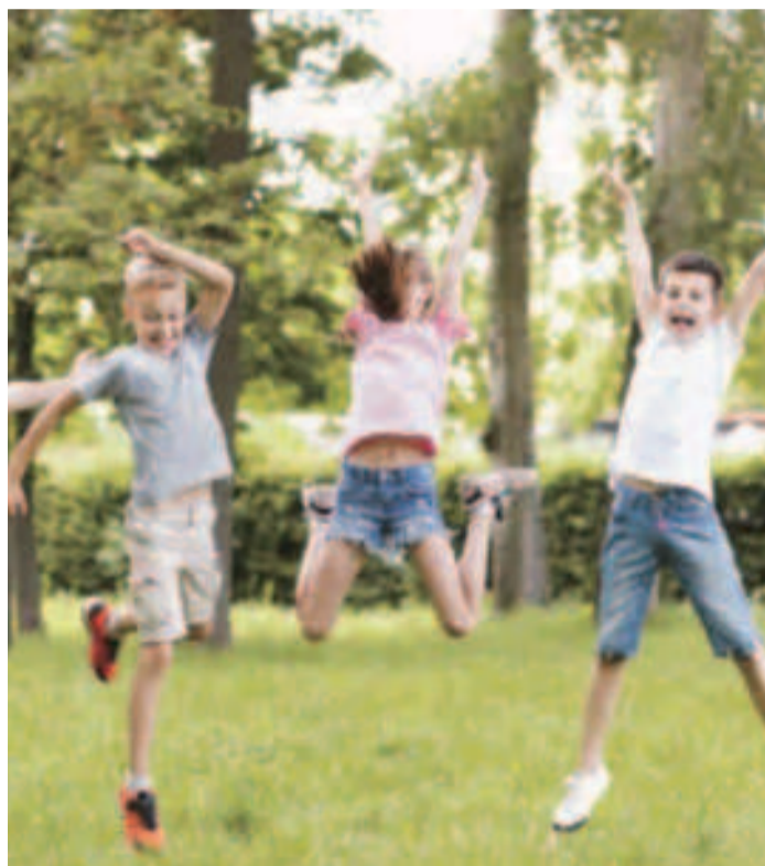
Igual que en anos anteriores, convócase a oferta de 140 prazas.