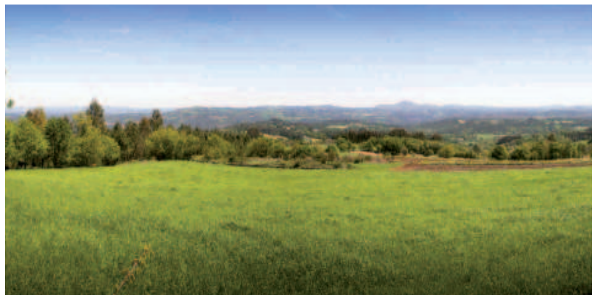
Paisaje de Galicia Central.