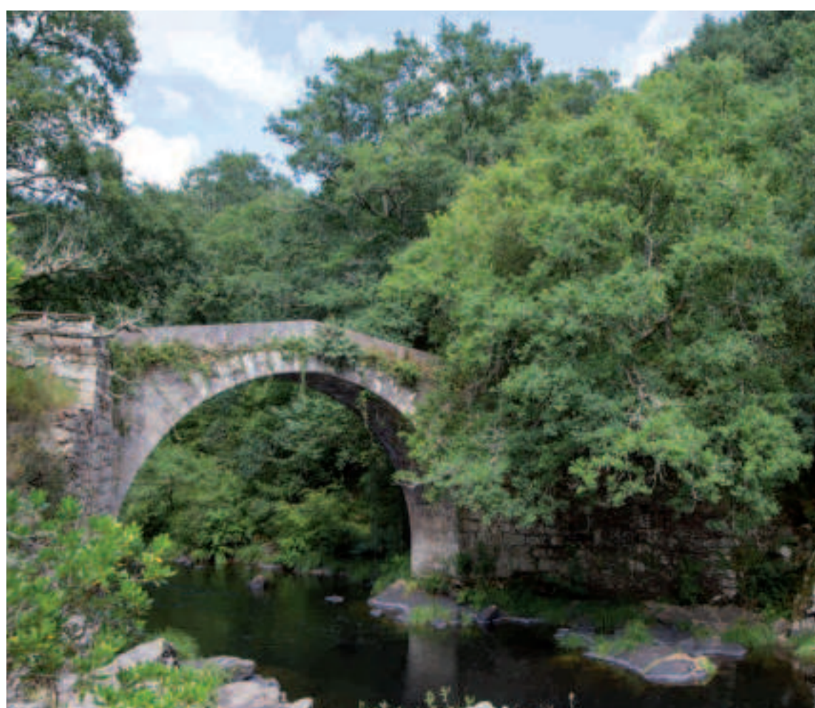
Puente de O Demo.