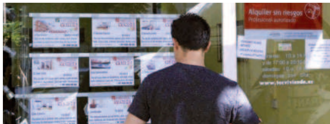
Desde Fegein solicitan a las diferentes administraciones que las viviendas de protección oficial se promuevan con la colaboración público-privado.

Al margen, desde Fegein apuntan a la necesidad de promover la rehabilitación de viviendas, algo que en su opinión favorecería que entrasen en el circuito de alquiler. “Sin embargo, la no llegada de los fondos europeos afecta drásticamente a la rehabilitación, penalizada ya por la larguísima travesía burocrática y administrativa que enfrentan los proyectos”, explican. “Los tipos de interés se moverán hacia el 4%, lo que expulsará del mercado al 15% de las familias gallegas”.