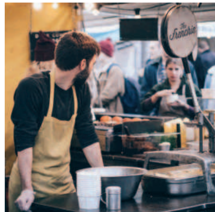
Ya no hay topes de cotización según la edad de los autónomos.

Por esto, la Seguridad Social le reclamará al autónomo, lo que le haya faltado por cotizar o le devolverá el exceso, pero siempre en función de sus ingresos reales y no de su edad.