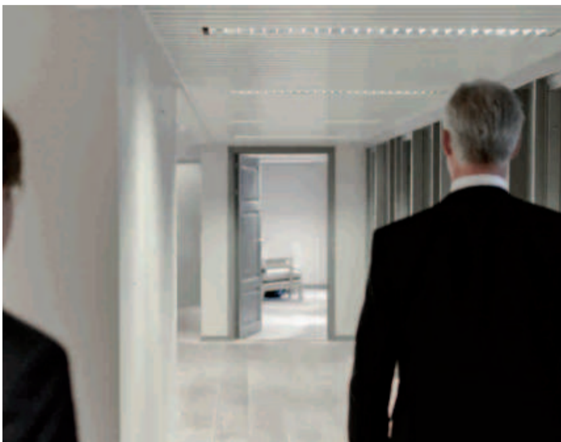
La jubilación de los autónomos.