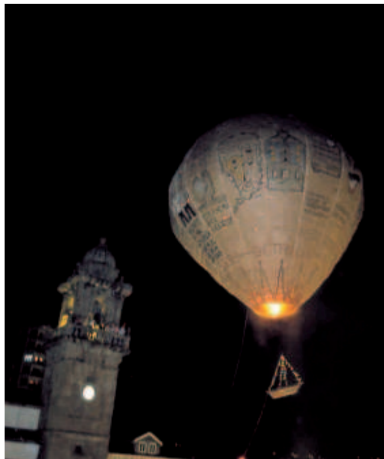
Festas Patronais de San Roque de Betanzos.