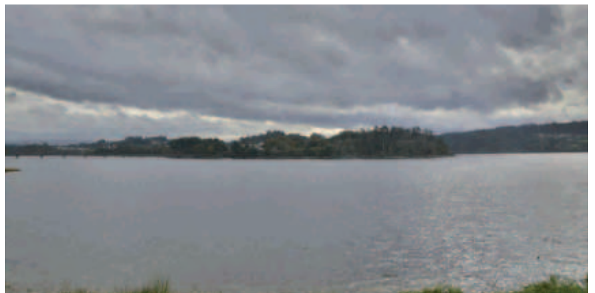
Encoro de Cecebre - Abegondo.