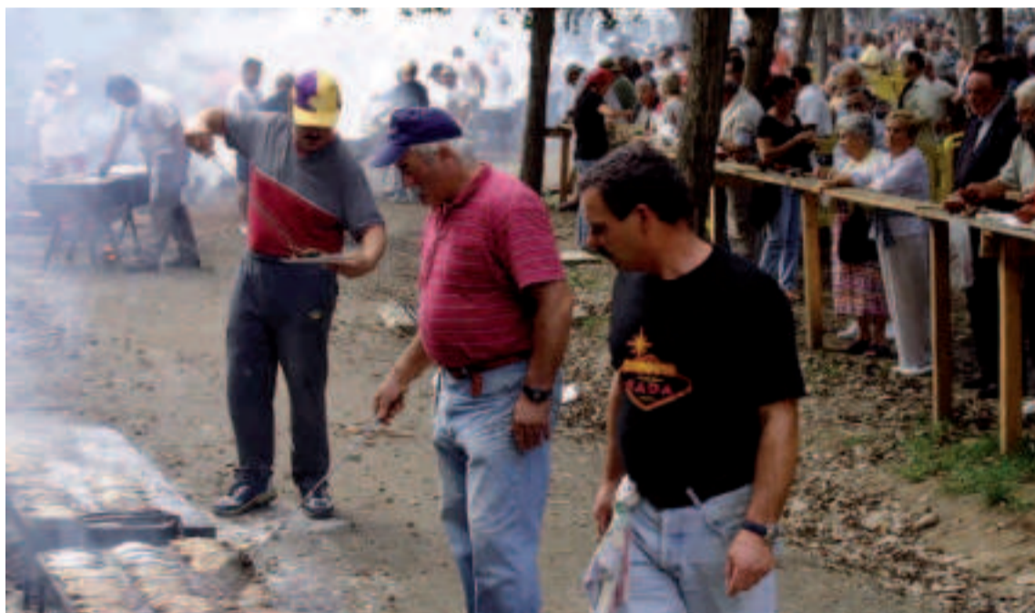
Festas Patronais de San Roque de Sada.

Muy cerca de Betanzos, en el municipio de Bergondo, se erige el majestuoso Pazo de Mariñán (declarado en 1972 Conjunto Histórico Artístico) con su jardín de estilo francés de gran variedad botánica. Plátanos de más de 50 metros de altura, eucaliptos centenarios, cipreses de Portugal, chopos negros y coloridas camelias decoran esta joya arquitectónica que alberga también el llamado Jardín de la Palabra en donde cada árbol conserva a su pie el mensaje de algunos ilustres visitantes, la mayoría poetas, que lo plantaron.