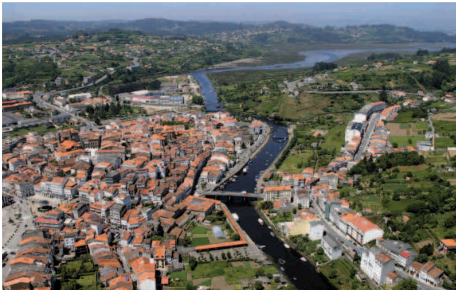
Centro histórico de Betanzos.

Custodiado por los ríos Mendo y Mandeo, el casco histórico de Betanzos constituye uno de los más bellos centros monumentales de Galicia. En algún tiempo fue ciudad amurallada y hoy conserva hermosas muestras de arquitectura popular asoportada de tradición medieval. En sus recoletas calles con sus tradicionales balconadas y galerías se percibe el esplendor de la que fue en un tiempo una de las antiguas provincias del Reino de Galicia.