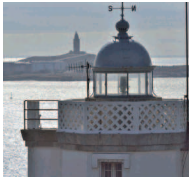
Faro de Mera.