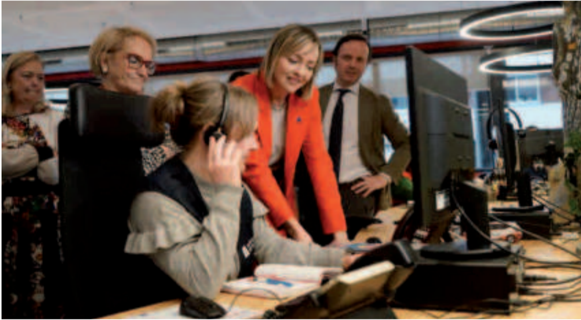
La conselleira de Política Social e Xuventude, Fabiola García.