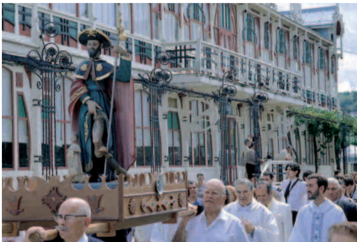
Festas Patronais de San Roque de Sada.