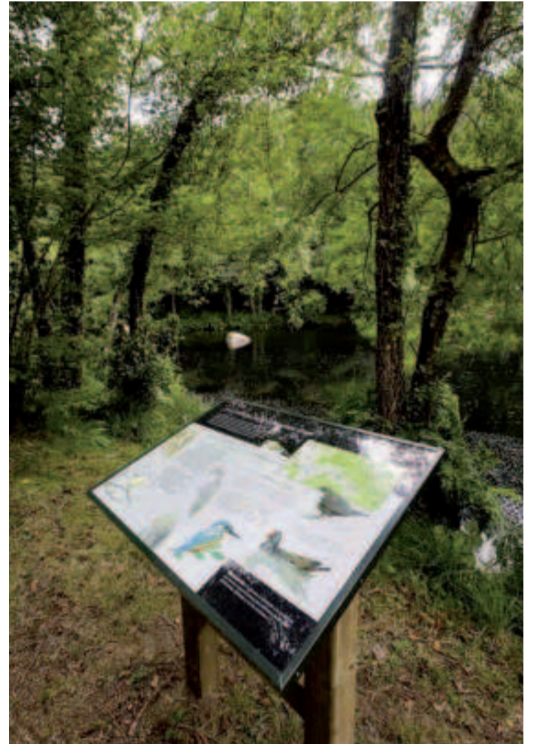
Lugar de Chelo.

Desde el faro de Mera, balcón privilegiado del monumento natural de la Costa de Dexo (en el ayuntamiento de Oleiros) se pueden observar la entrada de las tres rías del golfo Ártabro (A Coruña, Ares-Betanzos y Ferrol). Tienen también protección la confluencia de los ríos Mendo y Mandeo y el espacio