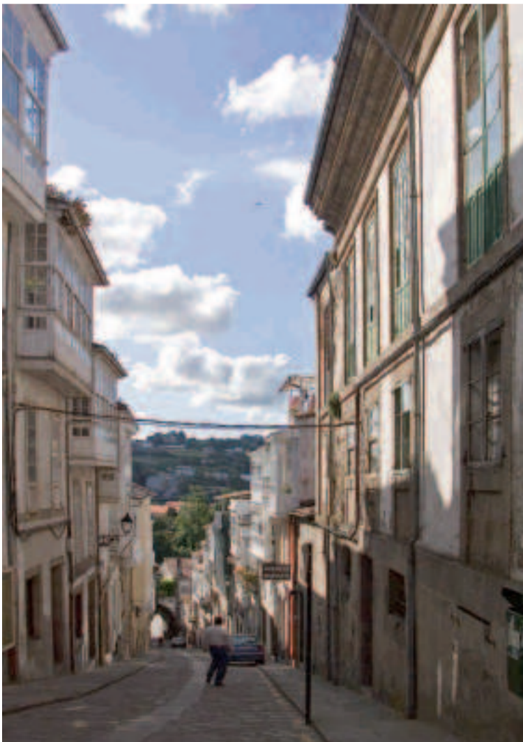
Centro histórico de Betanzos.