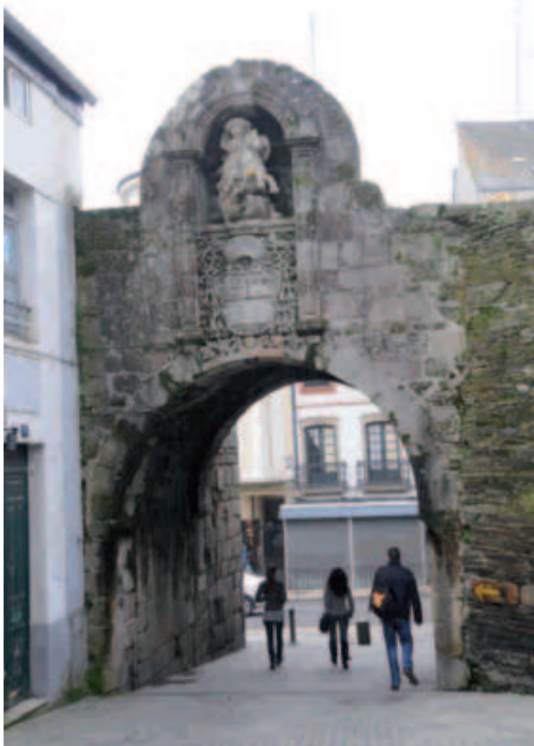
Puerta de Santiago.