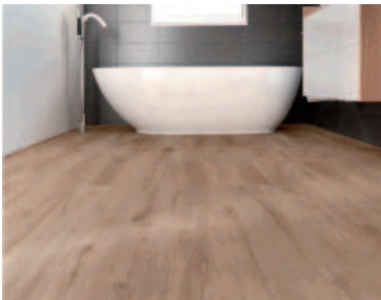
Suelo laminado Artens Extrem Zaragoza.

Cada vez más demandados por sus características, los suelos vinílicos son una opción perfecta para decorar tu casa, ya que cuentan con muchas ventajas: son aptos para interiores o exteriores protegidos del sol, son fáciles de instalar sobre el suelo existente, son impermeables y lavables, por lo que se