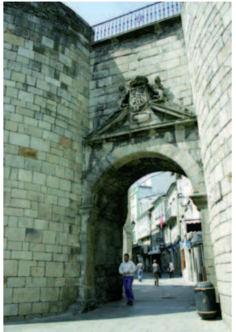
Puerta de San Pedro.

Con motivo de la inauguración de la nueva cárcel en 1887, se hizo necesaria la apertura de esta nueva puerta para facilitar el cambio de guardia y el acceso al juzgado. También conocida como Puerta de la Cárcel, fue la tercera puerta que se abrió durante el siglo XIX. Mide 4,32 metros de ancho, la altura hasta la clave es de 7,15 metros y hasta el adarve, de 8,10 metros. Esta puerta sustituye a unas escaleras de acceso, lo que condicionó sus dimensiones. Hubo que derribar estas escaleras (seguramente romanas) y el cubo en el que estaban alojadas, así como una pequeñísima parte del Reducto Cristina.