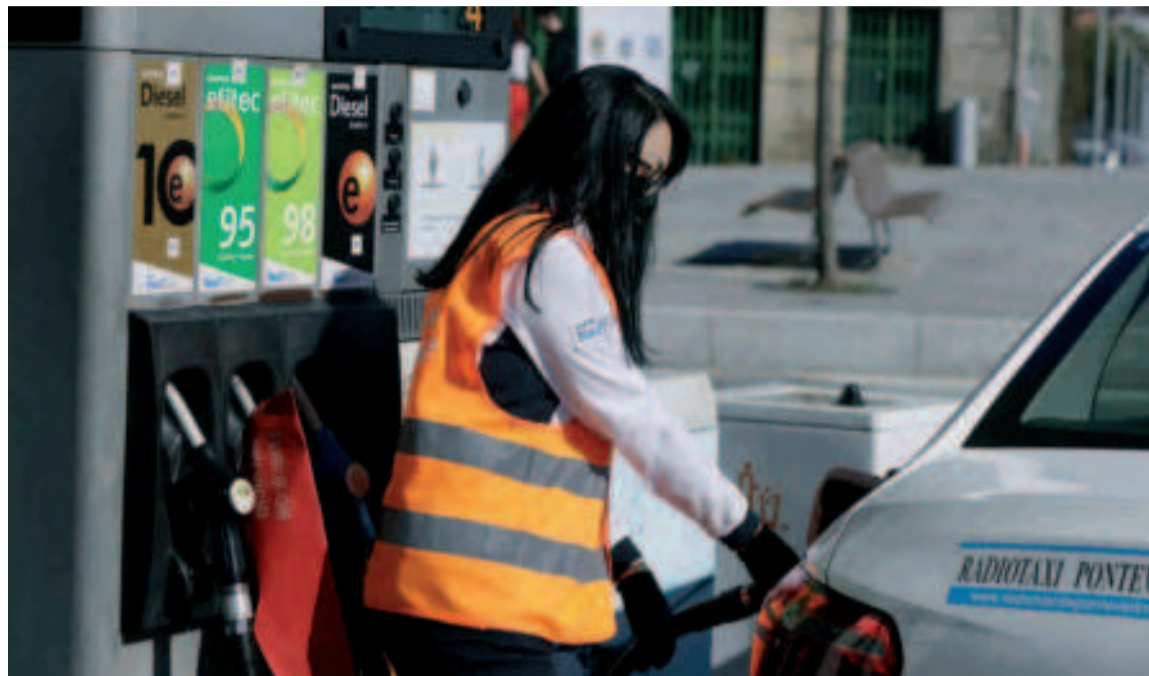
El dato de diciembre, es cinco puntos inferior al pico alcanzado el pasado mes de julio.

Así, con la moderación registrada en diciembre, la inflación suma cinco meses consecutivos de descensos en su tasa interanual después de que en agosto bajara tres décimas, hasta el 10,5%; en septiembre disminuyera 1,6 puntos, hasta el 8,9%, en octubre se redujera 1,6 puntos, hasta el 7,3% y en noviembre recortara medio punto