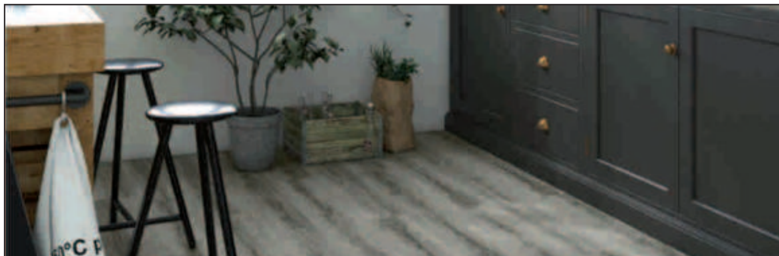
Suelo vinílico acabado madera gris.