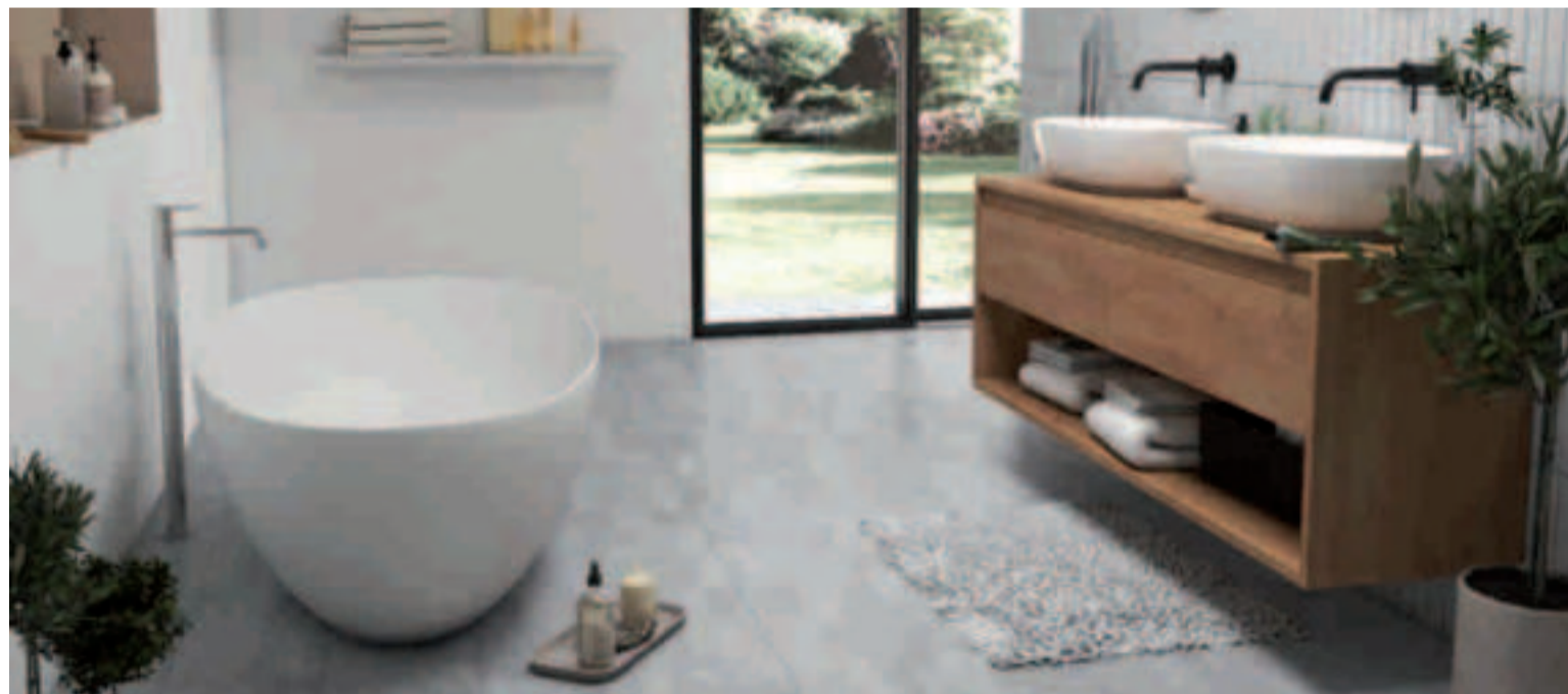
Suelo vinílico acabado hormigón.

Una gran oportunidad de renovar por completo la imagen de nuestro hogar por un precio incomparable.