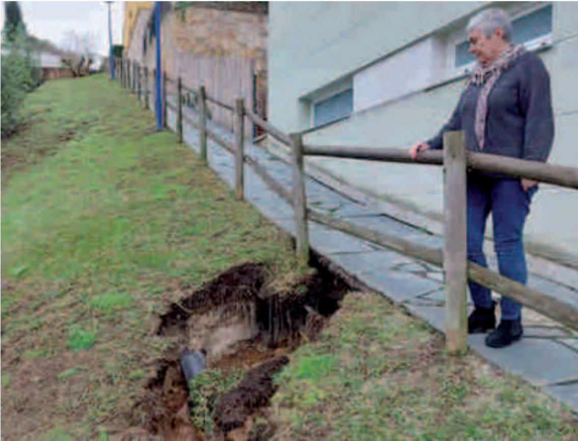
Undimienta do solo na urbanización Aguas Mansas.