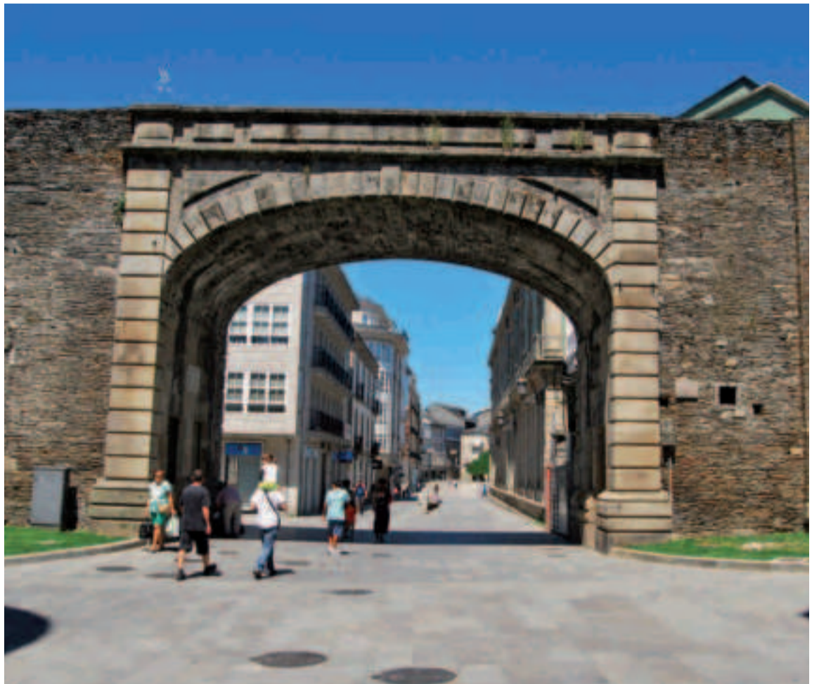
Puerta del Obispo Aguirre.

dado que la anterior estaba en estado ruinoso y amenazaba la seguridad de los viandantes. Para la construcción de esta puerta nueva hubo que derribar un cubo de la Muralla. Situada en una ladera, mide 4,60 metros de ancho, la altura hasta la clave es de 8 metros y el alto hasta el adarve mide 8,95 metros. En este punto desde el adarve de la Muralla se contempla una típica estampa de la ciudad con las torres de la Catedral al fondo. Atravesando la puerta, a la derecha encontraremos unas escaleras que nos permiten subir a la Muralla.