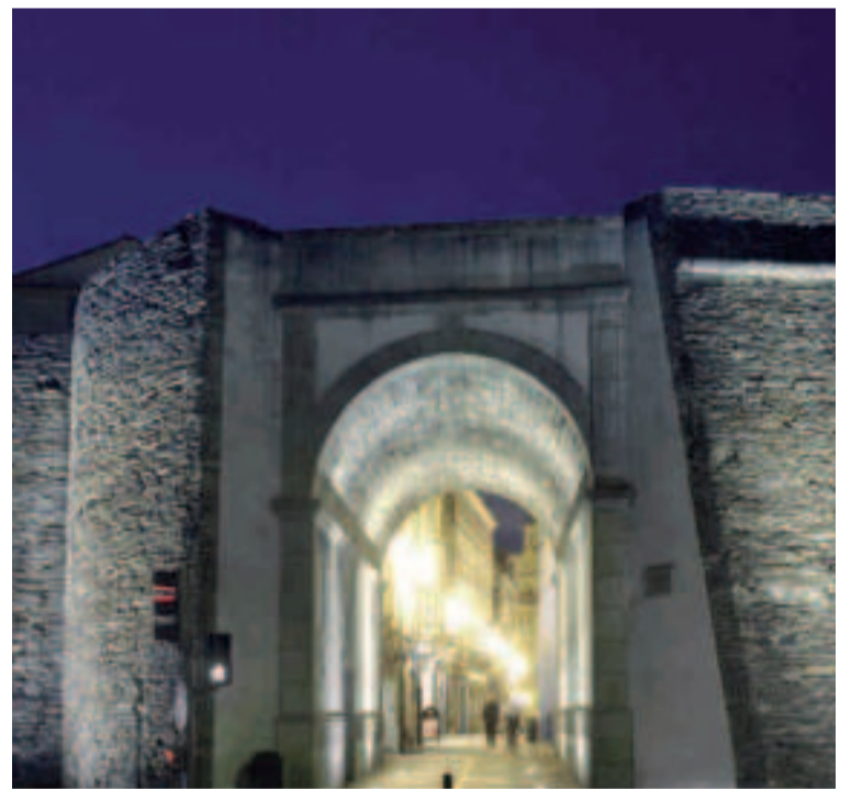
Puerta del Campo Castelo.