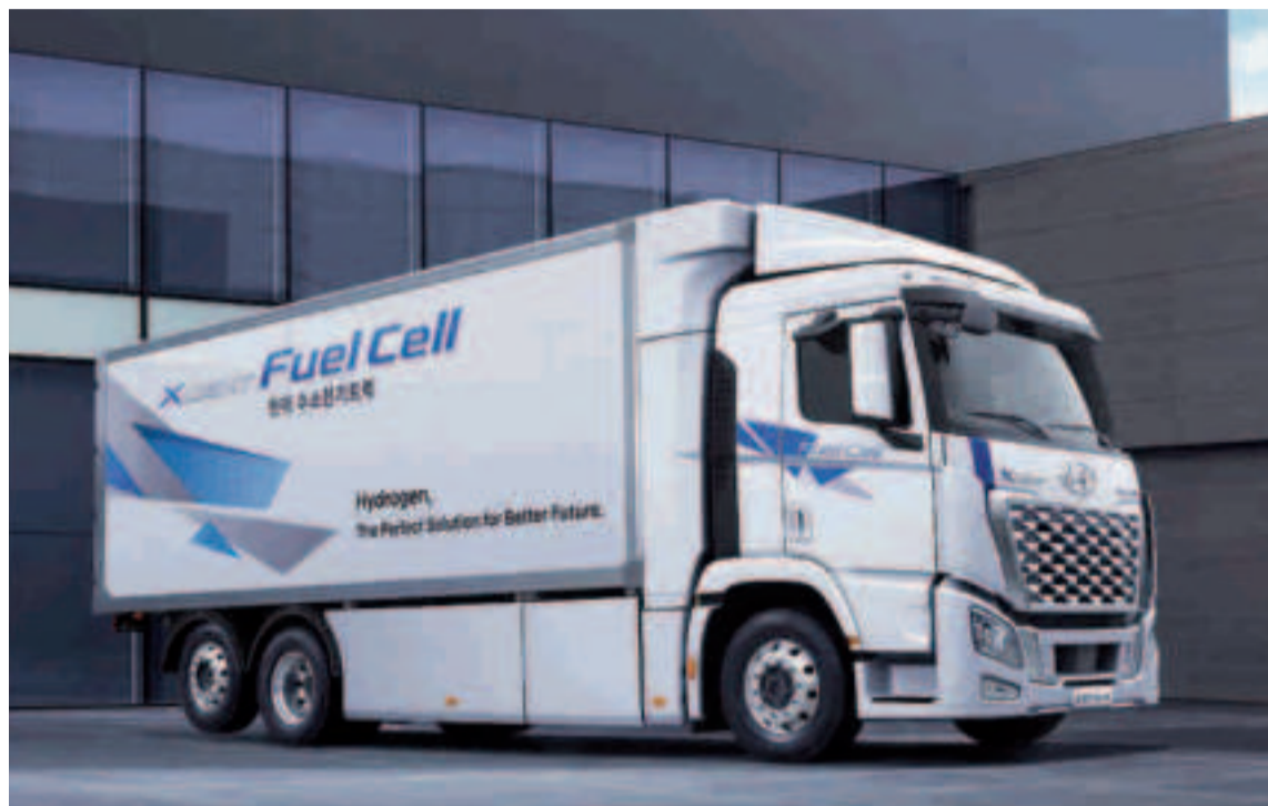
Hyundai XCIENT Fuel Cell.

El nuevo Hyundai XCIENT Fuel Cell estrena una imagen más sólida