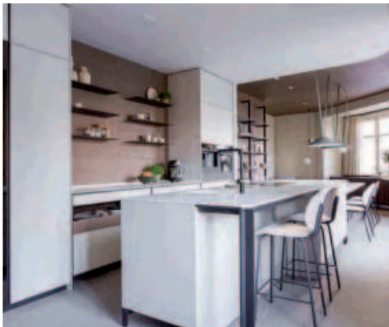
Las cocinas de hoy se equipan con electrodomésticos eficientes.

La tendencia, sobre todo cuando se trata de cocinas abiertas, es que los electrodomésticos queden totalmente integrados, logrando que no desentonen en estilo con el salón ni el comedor.