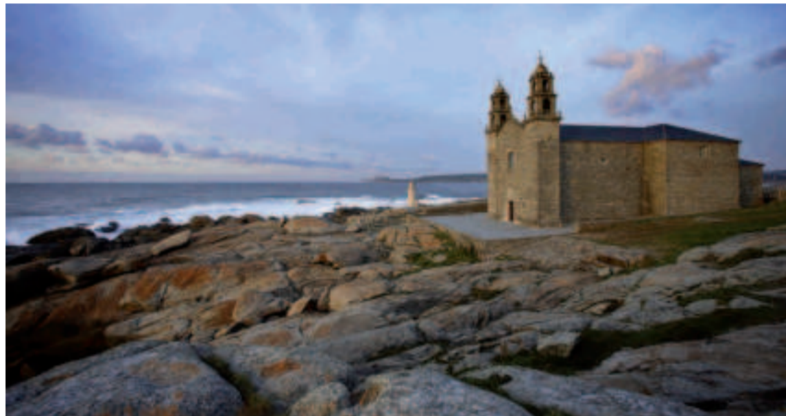
Santuario da Virxe da Barca.

Ponemos rumbo ahora cara a la costa para visitar el hórreo de Ozón, en el ayuntamiento de Muxía. Contad vosotros mismos los 21 pares de pies de esta calabacera gigante construida en granito en el siglo XVIII, antes de dirigimos a la iglesia de San Xíán de Moraime. Una vez allí, os recibirá un recinto sagrado en el que encontrareis vestigios de un pasado brillante y esplendoroso. Levantado en el medievo, el templo del siglo XII estaba integrado en el único monasterio histórico de la Costa da Morte, ya exclaustro desde antiguo.