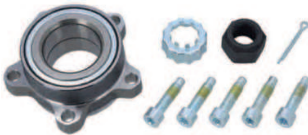
Sus juegos no requieren mantenimiento gracias a una lubricación permanente.

Las unidades que la marca de Diesel Technic ofrece al mercado del recambio industrial y comercial están hechas de un acero especial que se somete a un tratamiento térmico muy especial para endurecer el material y garantizar una larga vida útil.