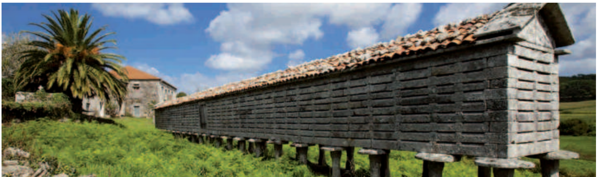
Hórreo de Ozón (Muxía).