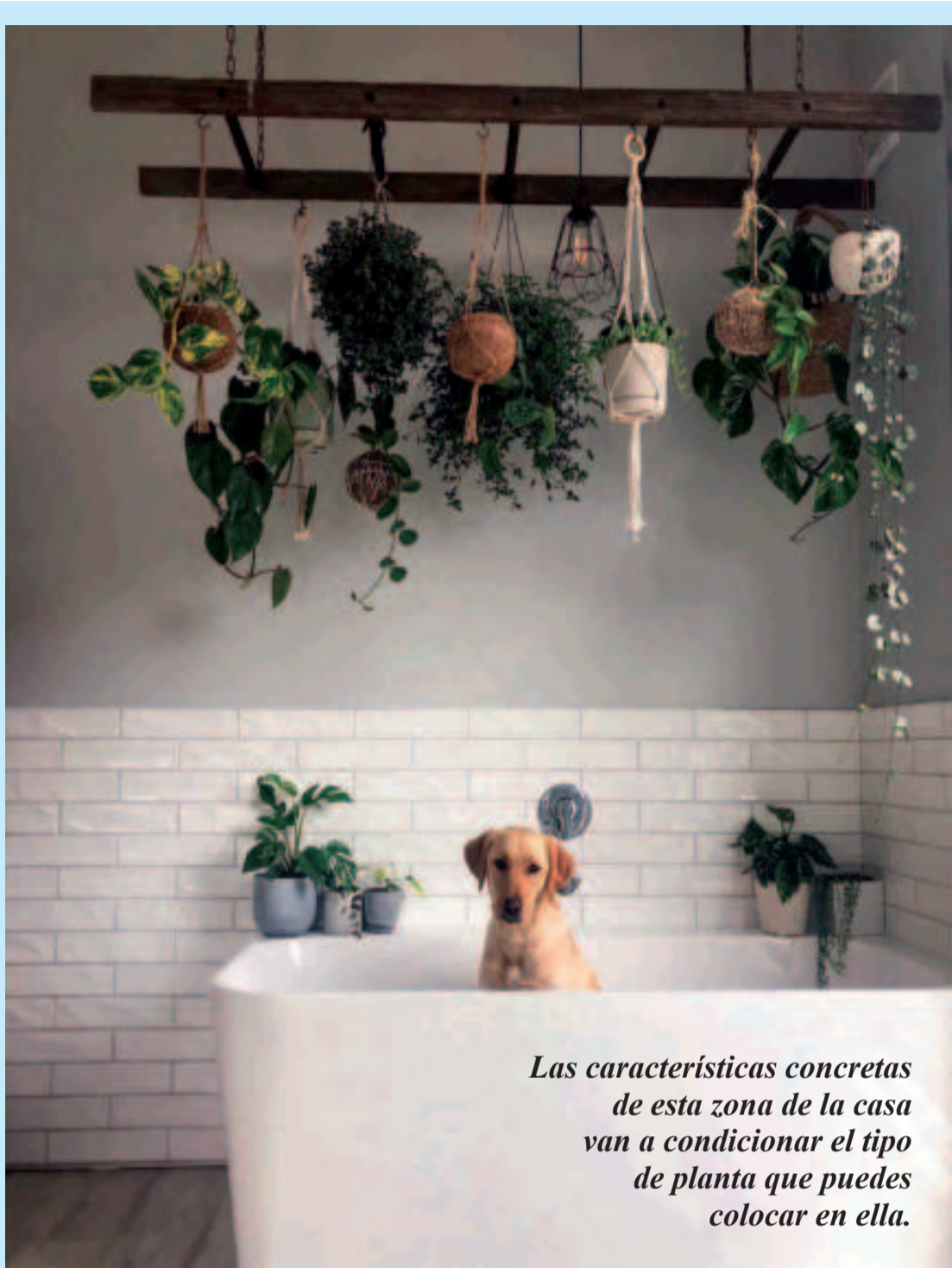
Las características concretas de esta zona de la casa van a condicionar el tipo de planta que puedes colocar en ella.

No necesita mucha luz y con su variedad de verdes, da mucha vida al cuarto de baño. Le encanta la humedad y resulta muy útil para dificultar la aparición de mohos.