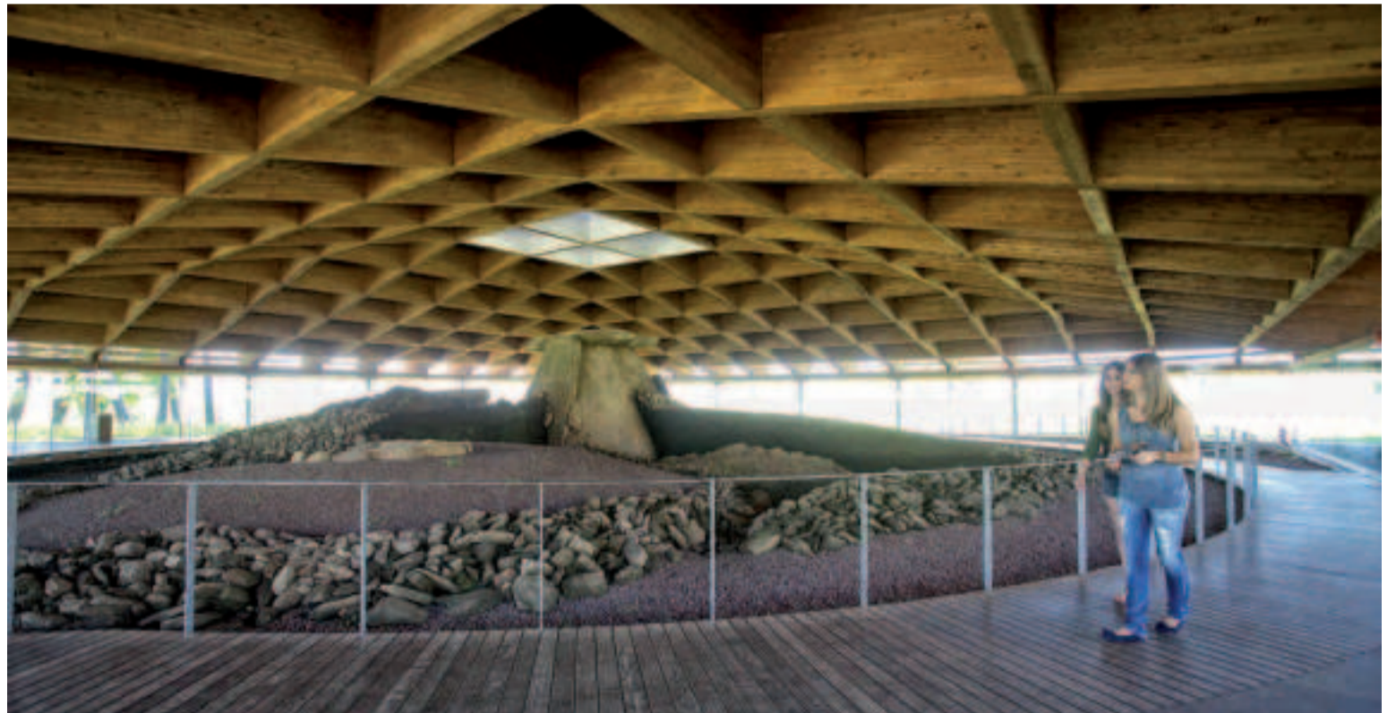
Dolmen de Dombate.