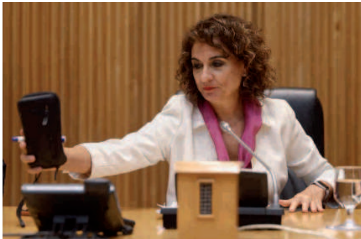
Hacienda ha adelantado a 2022 la entrada en vigor del impuesto de 'solidaridad' para las grandes fortunas.

La Autoridad Independiente de Responsabilidad Fiscal (AIReF) advirtió de que el impuesto tendría que entrar en vigor ya este mismo año, dado que el plan presupuesta-