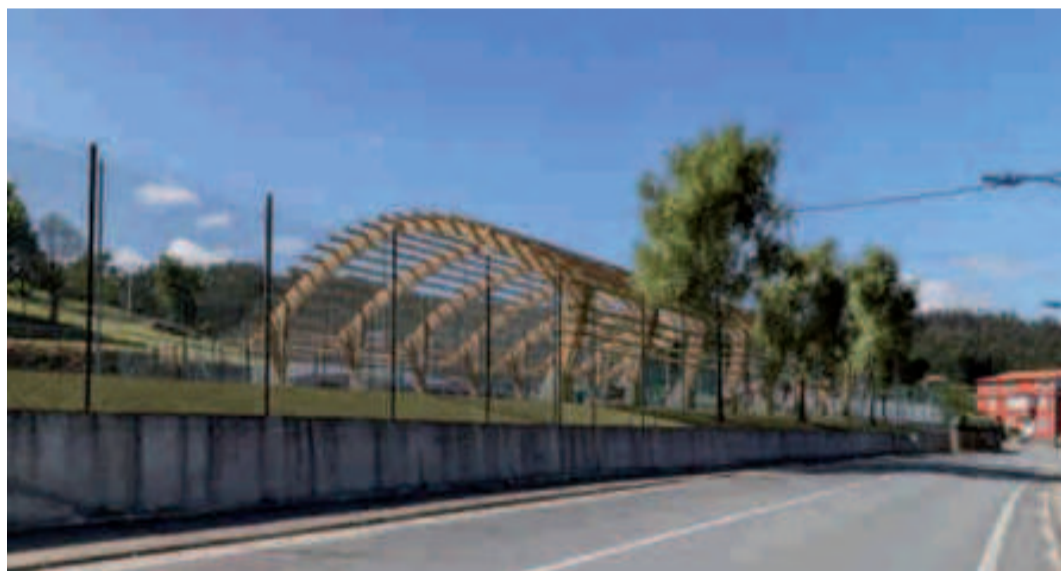
Imagen virtual de la cubierta.

Rioboo explica que se conseguirá "unha área con pista e parque infantil cubertos onde poder programar as competicións