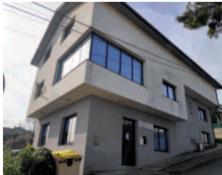
Estado actual del Centro Sociocultural de Brexo-Lema.