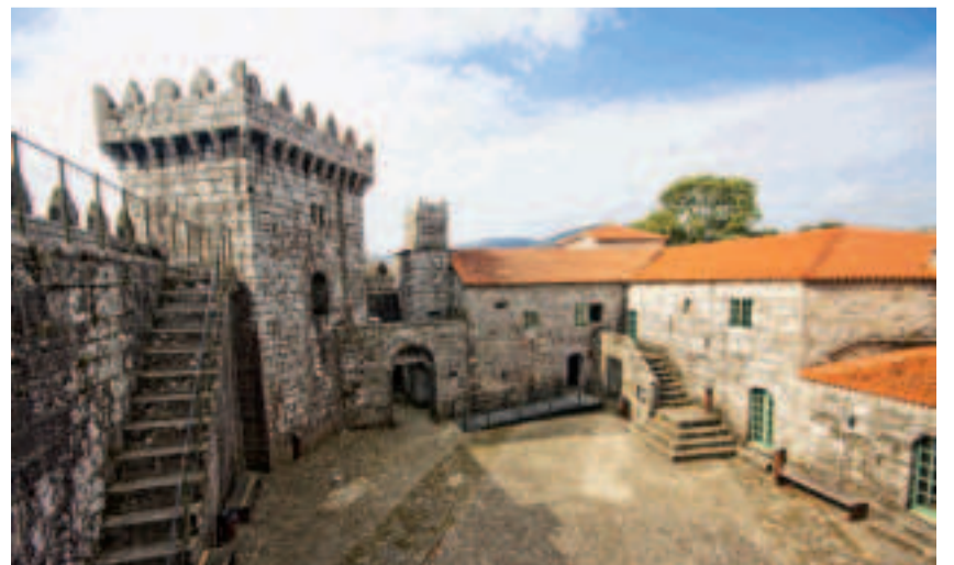
Castelo de Vimianzo.

El mar de Muxía está muy cerca de aquí. Ya en la villa, un final mágico para este segundo día sería visitar uno de los santuarios marianos más emblemáticos de toda la Costa da Morte y de Galicia, el santuario da Nosa Señora da Barca. Este sobrio templo, mandado construir por iniciativa de los Condes de Monforte, recuerda el lugar al que la Virgen llegó en una barca de piedra para animar al apóstol Santiago a continuar con su predicación. En este gran atrio de piedra natural que mira al mar, podréis tocar y acariciar los vestigios sagrados de esta aparición: la pedra dos cadrís, que se identifica con la barca; la pedra de abalar, que simboliza la vela y la pedra do timón. Todas ellas piedras mágicas de la milenaria embarcación a las que se les atribuyen propiedades curativas y adivinatorias que sólo se sabrán ciertas de seguir los rituales.