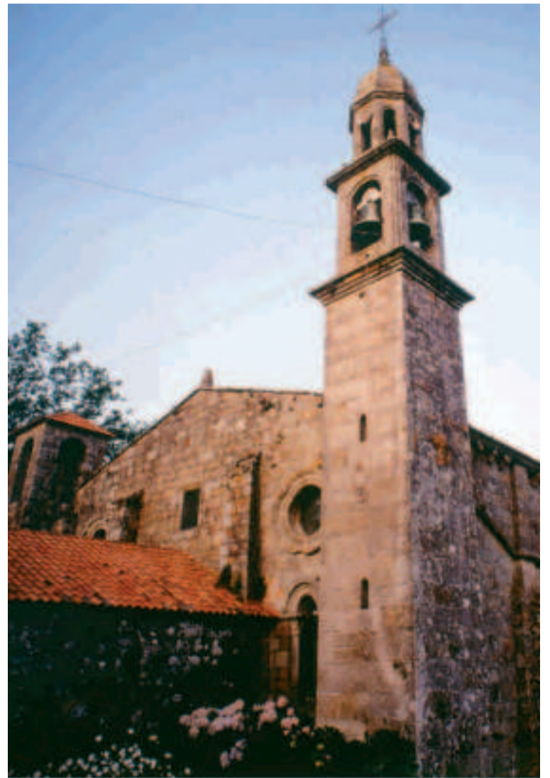
San Xulián de Moraime.

Y de Zas vamos hacia Vimianzo para descubrir otra maravilla del megalítico, el dolmen de Pedra Cuberta. Esta es la única anta en Galicia que presenta restos pictóricos, descubiertos por los arqueólogos alemanes Georg y Vera Leisner en los años 30 del siglo XX dándole fama internacional.