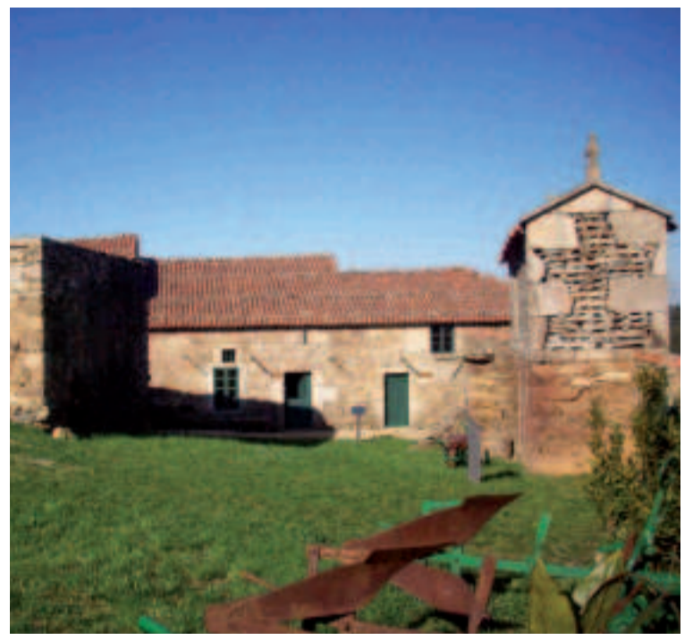
Ecomuseo Muíño do Forno do Forte.