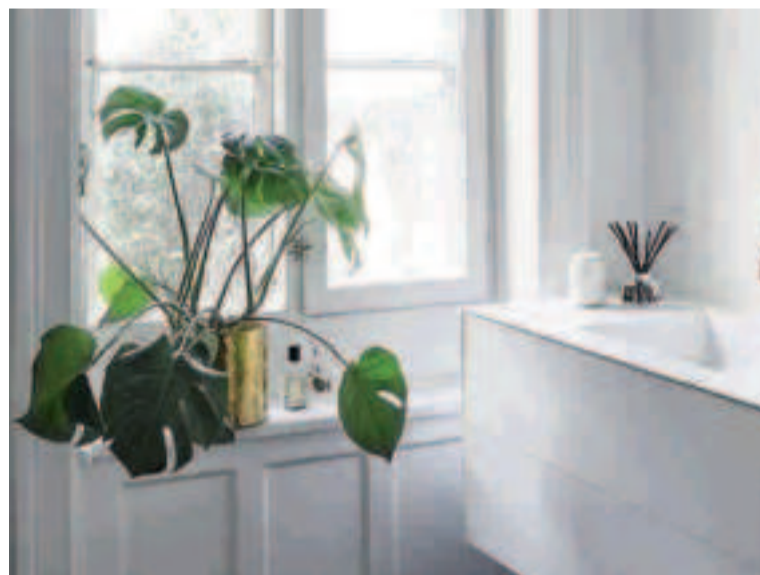
El truco es elegir variedades que crecen sin casi sol y en ambientes muy húmedos.