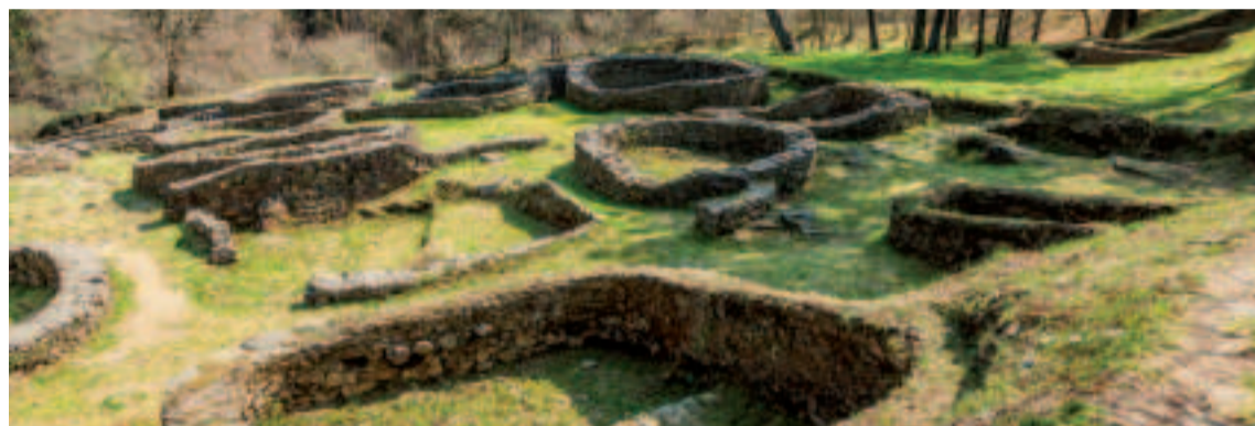
Castro de Borneiro.