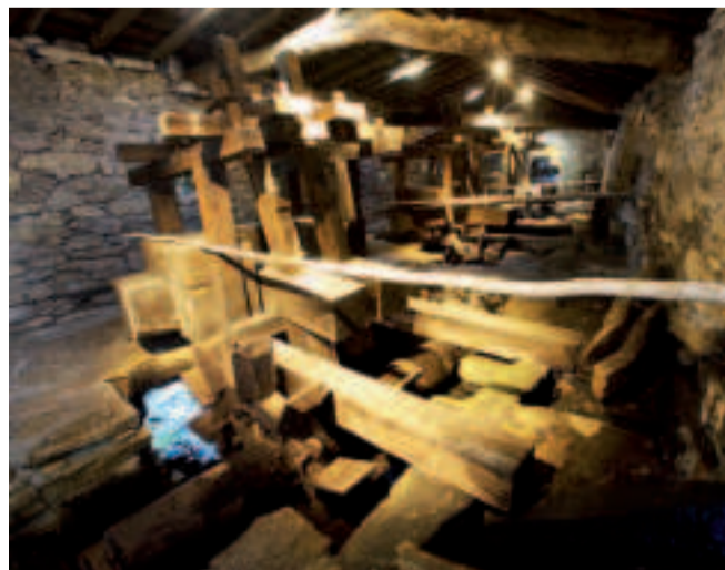
Molinos y batáns do Mosquetín.