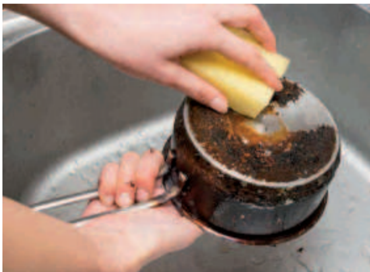
Hay muchos remedios caseros que pueden dar buenos resultados como el bicarbonato, el detergente de lavavajillas, el limón o un refresco de cola.

Y además, los alimentos se calentarán de una manera más uniforme. Así que, si tienes la oportunidad, hazte con una de ellas.