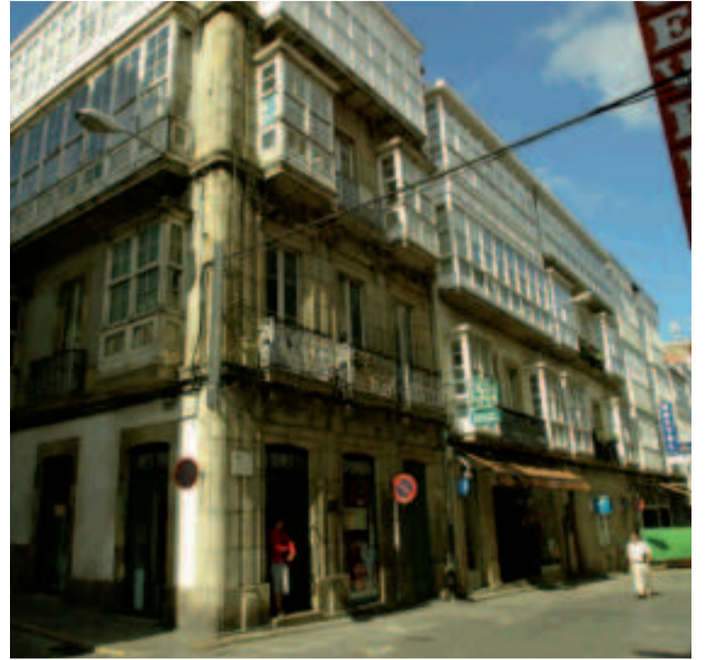
Barrio de la Magdalena (Ferrol).