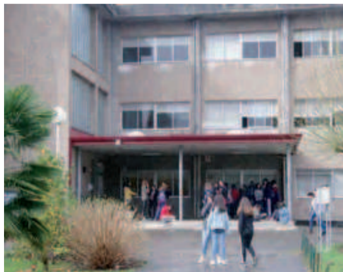
Instituto Francisco Aguiar en Betanzos.

curso, tienen más o menos suerte, a la hora de vivir diariamente unas incomodidades en sus jornadas escolares por la situación de los centros educativos, ya que, por ejemplo, en el Vales Villamarín hay una zona en la que, después de mucho insistir, la Xunta acometió hace unos años obras demandadas por la comunidad educativa y el Concello, pero hay otra zona del edificio que sigue padeciendo notables problemas”. La alcaldesa ha mostrado su malestar por lo que considera una actitud “irrespetuosa” del conselleiro de Educación, ya que le solicitó “dos reuniones, la primera hace dos meses, sin que hasta ahora nos haya recibido, ni él ni nadie de su consellería para tratar unas cuestiones que, creo, son importantes y necesarias a corto plazo y para el futuro educativo de Betanzos”.