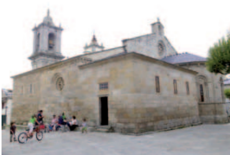
Convento de As Concepcionistas (Viveiro).