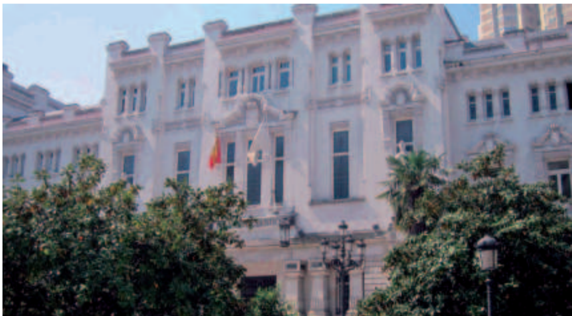
La sede del TSXG en A Coruña.

El programa Educar en Xustiza se retomará el próximo curso y en él pueden participar los centros educativos de Galicia que formalicen su solicitud a través del Gabinete de Comunicación del TSXG.