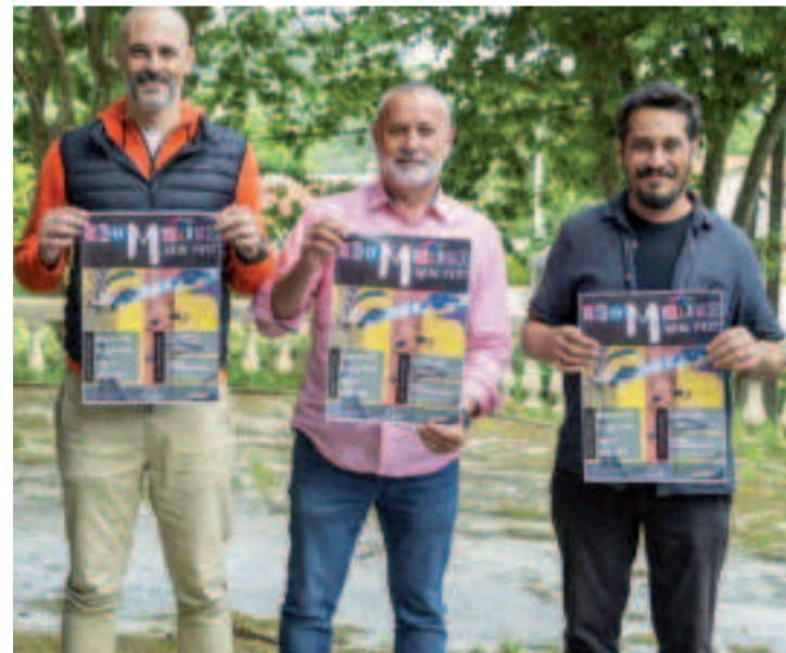
Presentación del Cromático Mural Fest en Casa Arrigada.