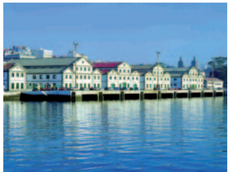
Arsenal de Ferrol.