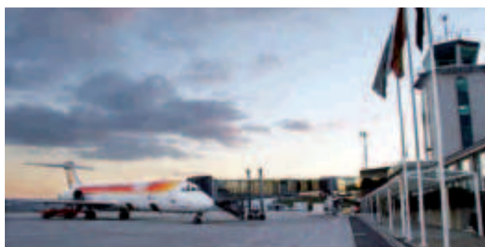
El saneamiento y asfaltado de la pista paró las operaciones.

bajaron en cada turno de manera ininterrumpida durante 80 horas.