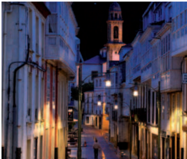
Centro histórico de Ortigueira.