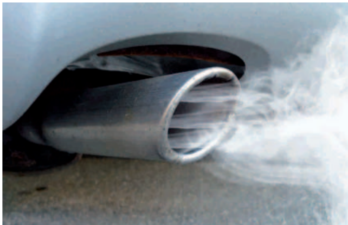
La propuesta europea fue aprobada el pasado 8 de junio en el Parlamento Europeo.

La ministra para la Transición Ecológica ha resaltado que "no hay una oposición a 2035" y ha apuntado la importancia de "mandar mensajes claros" ya que se está