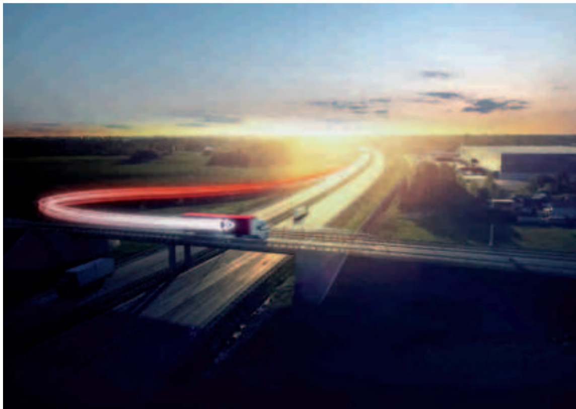
La solución integrada de neumáticos y gestión de flotas Fleetcare proporciona una serie de beneficios a los clientes.

«Las flotas exigen la máxima eficiencia, comodidad y sostenibilidad a medida que se adentran en el futuro de la movilidad, y la cartera de soluciones de Bridgestone está evolucionando rápidamente para satisfacer estas demandas y crear