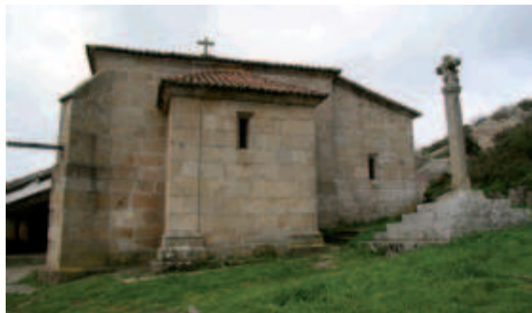
Ermita de la Virxe de Chamorro.

La mejor opción para acercarse al lugar, combinando verdaderas sensaciones de emoción y de vértigo, es hacer a pie el sendero desde el famoso crucero del Cristo dos Carrís. Para iniciar los rituales vinculados a esta peregrinación, deberéis cargar con una piedra y depositarla en uno de los "milladoiros" (pequeños montones de piedras) que encontraréis en los alrededores del crucero y del sendero. De esta manera, cuando llegue el día del Juicio Final, Dios sabrá que estuvisteis aquí pues, como le prometió al santo: " Queda aquí, san Andrés, / que de vivos ou de mortos / todos te virán ver " ("Queda aquí, santo Andrés / que de vivos o de muertos / todos te vendrán a ver"). Por esto se dice que va de muerto, en forma de reptil, el que no fue de vivo.