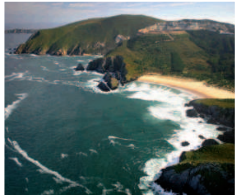
Cabo de Estaca de Bares y playa de Esteiro.