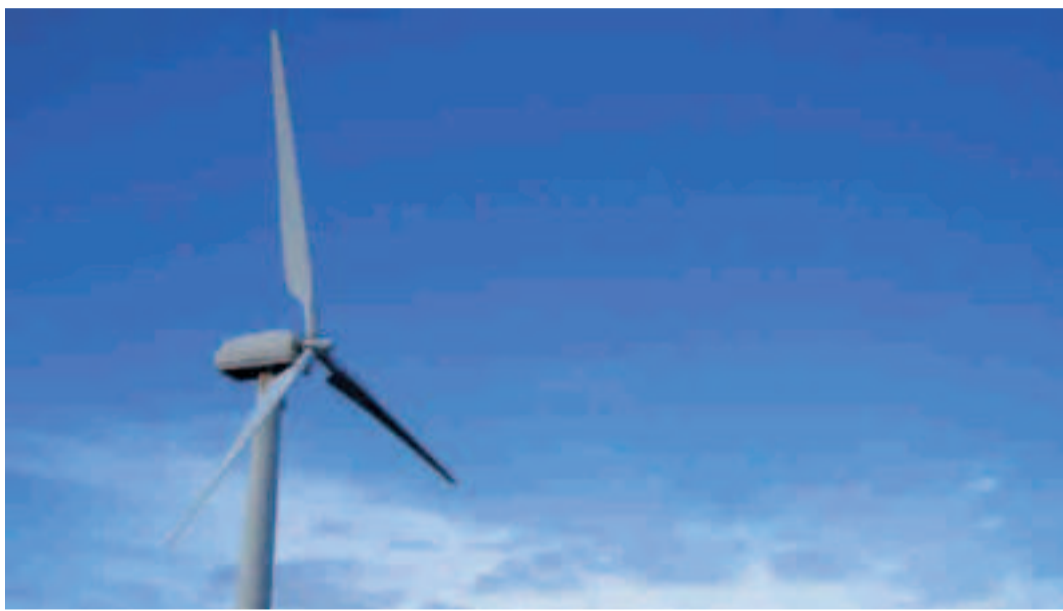
Aerogenerador en Monteagudo.