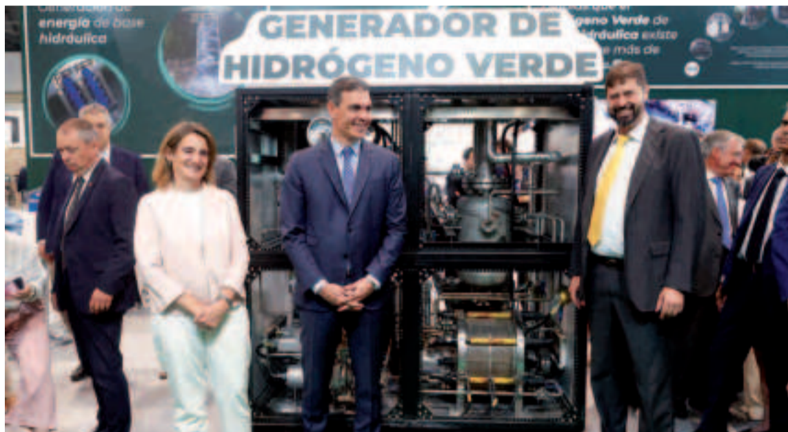
El presidente Pedro Sánchez y la ministra Teresa Ribera en Ifema Madrid.