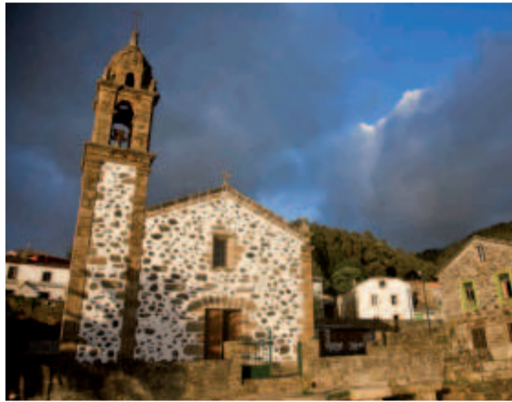
Santo André de Teixido (Cedeira).

La sensación de respeto que transmite este lugar de culto se ilumina con la luz de docenas de velas que resplandece delante de los exvotos. Estas figuras de cera con forma de una parte del cuerpo son dejadas aquí, en expresión de gratitud, por aquellos a quien el santo ya les hizo algún favor. Mientras contempláis esta escena, es hora de seguir con los rituales para rogar por nuestro segundo deseo. Encended una vela y acercaros a la vecina Fonte