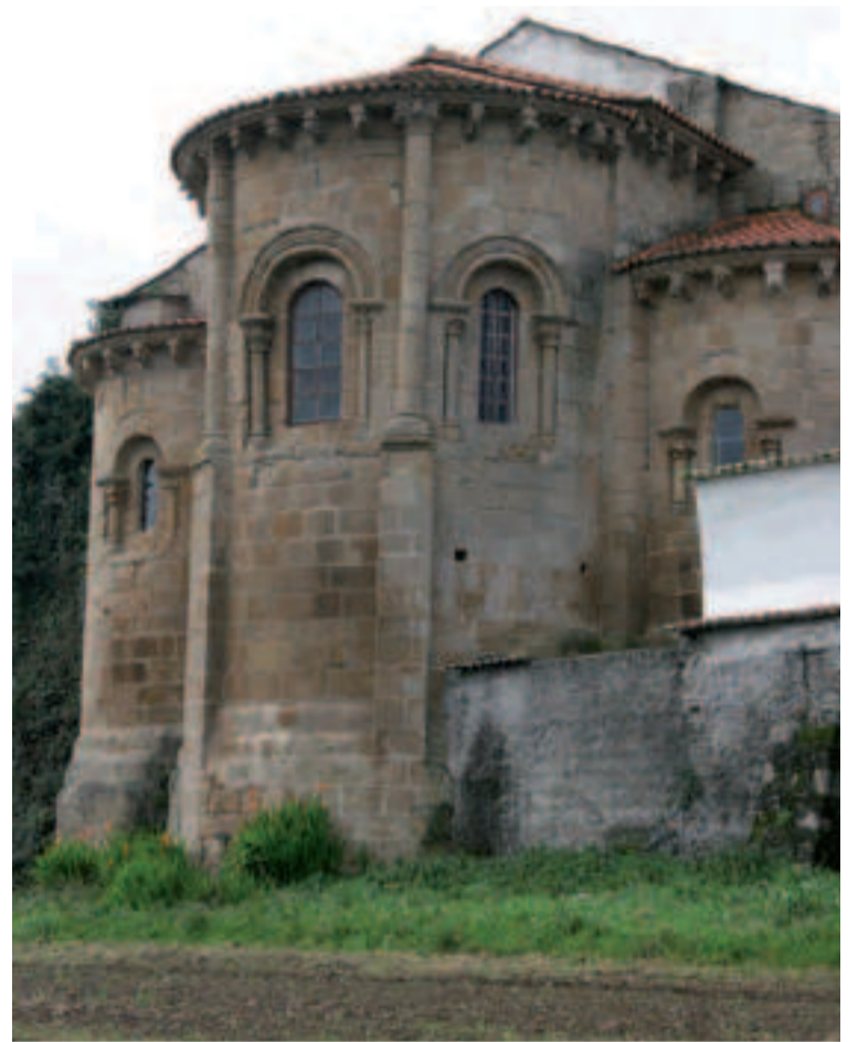
San Martiño de Xubia (Narón).