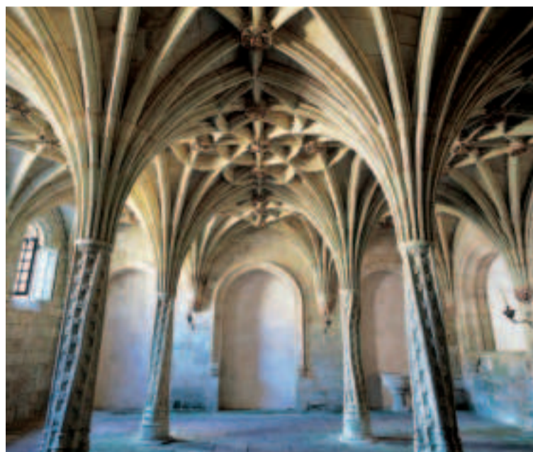
Santa María Real de Oseira.