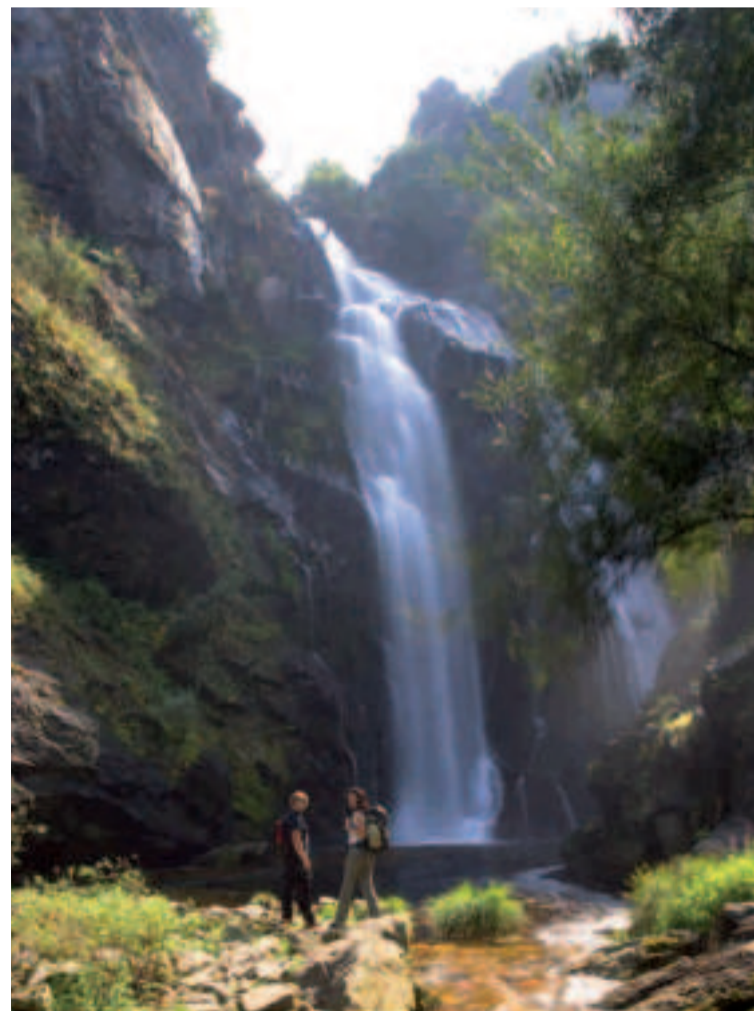
Cascada del río Toxa.

Este plato típico del invierno es una referencia en el calendario gastronómico de toda Galicia, pero sobre todo, en el municipio de Lalín, donde esta reunión gastronómica atrae cada año millares de personas a estas tierras de historia, tradiciones y supersticiones.