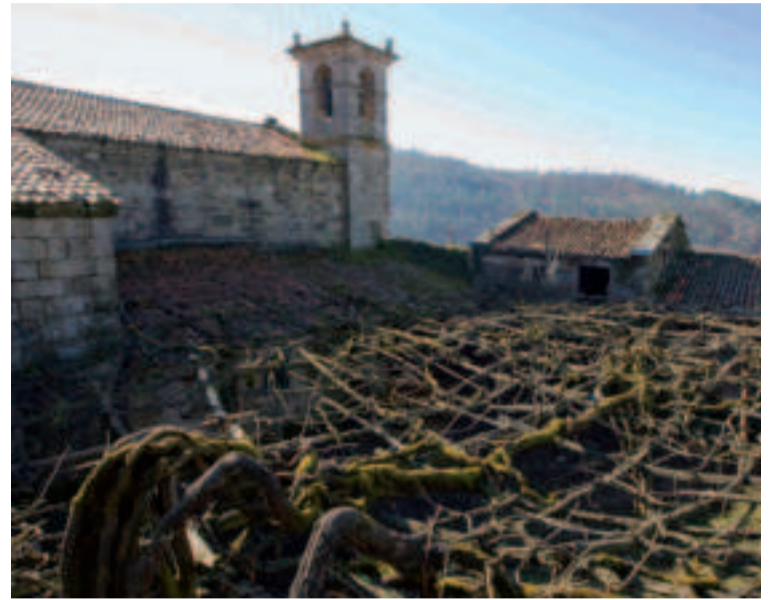
Monasterio de San Lorenzo de Camanzo - Vila de Cruces.

Paseando por los estrechos callejones de adoquines, entre los puestos de columnas y mostradores de piedra, casi podemos oler los productos del campo o sentir los animales que venían a vender los agricultores y tratantes de los alrededores. Tras la recuperación de este enclave, la vida vuelve a los Pendellos cada mes de agosto en forma de feria de artesanía tradicional.