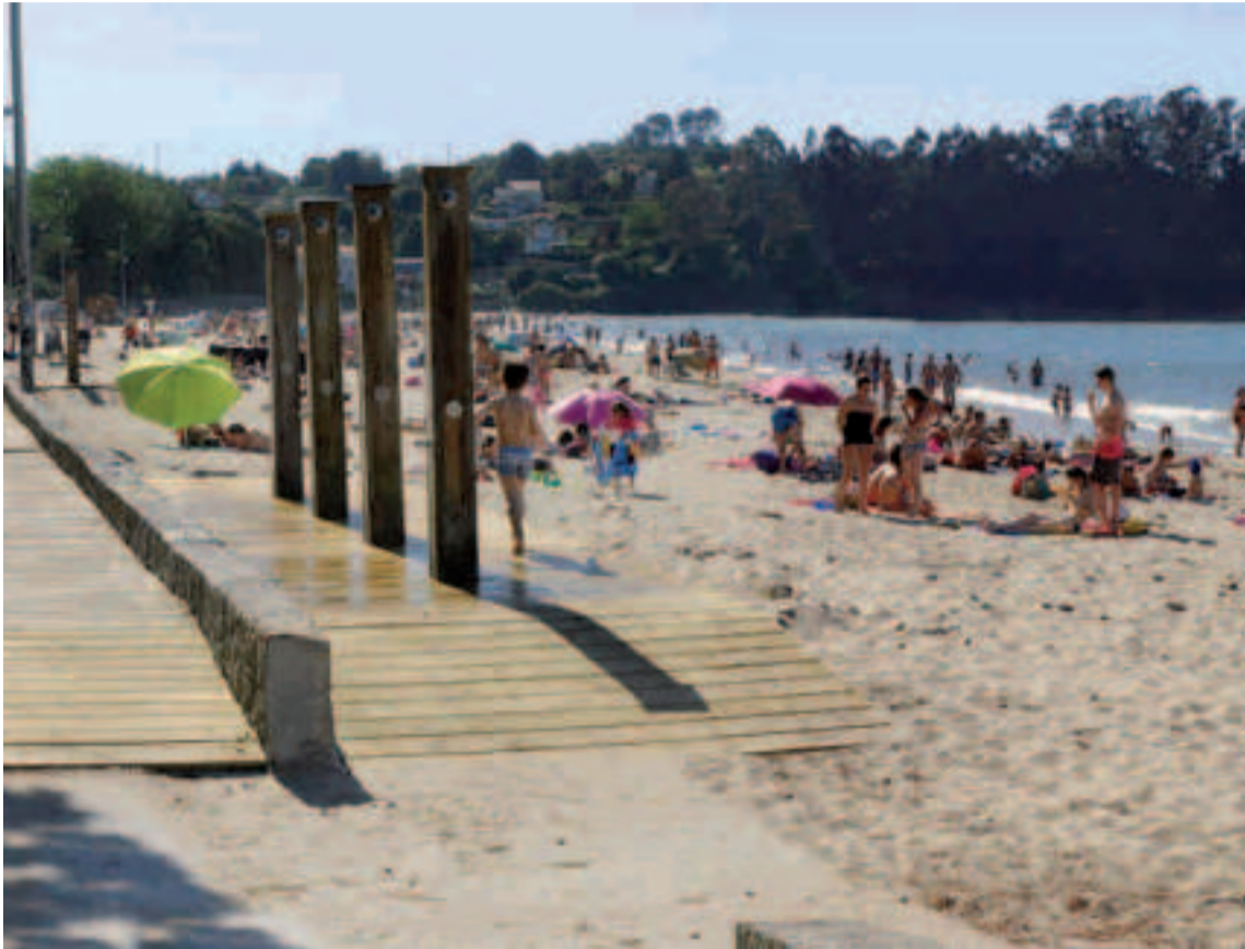
Playa de Gandarío en Bergondo.