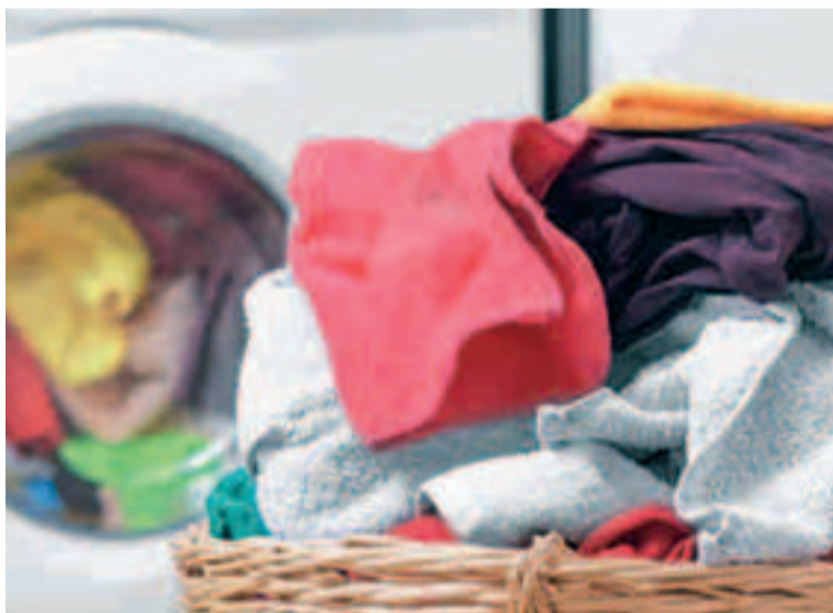
La ropa deportiva está fabricada con materiales destinados a la absorción de la humedad, como la lycra, el spandex o el poliéster.

No utilices la secadora. Al igual que antes apuntábamos que el exceso de calor en el agua con la que lavamos las prendas puede deteriorar mucho los materiales, también debemos recordar que esto ocurre igual con el aire caliente. Por eso, la mejor opción es siempre tender la ropa deportiva, para que se seque de la forma más natural posible.