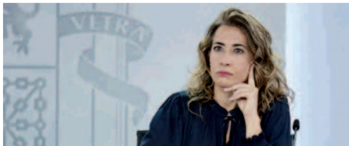
La ministra de Transportes, Movilidad y Agenda Urbana, Raquel Sánchez.

Sepes urbaniza los terrenos para obtener las parcelas aptas para albergar la edificación de vivienda pública en régimen de alquiler asequible.