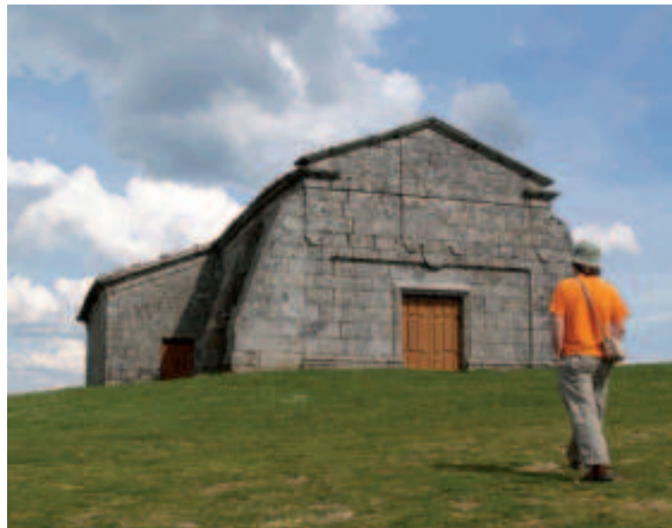
Ermita de Nosa Señora do Monte Faro.

Este lugar sagrado es muy conocido por ser escenario de curaciones de endiablados y por la práctica de exorcismos a la puerta de la iglesia, para lo que el párroco de este templo tiene autorización del mismo Vaticano. Hoy en día, los psiquiatras buscan explicación a estos extraños síntomas en las enfermedades mentales pero en el culto popular aun hay quien habla de posesiones diabólicas. En todo caso, podréis intentar sentir el halo de este lugar mágico conforme entréis en el atrio donde se juntaba todo tipo de gente para “quitar el hechizo”, “echar al demonio fuera” o curar “el ramo cautivo”. En los puestos de alrededor del templo también venden amuletos contra el mal de ojo y la envidia, así como para preservar la salud.