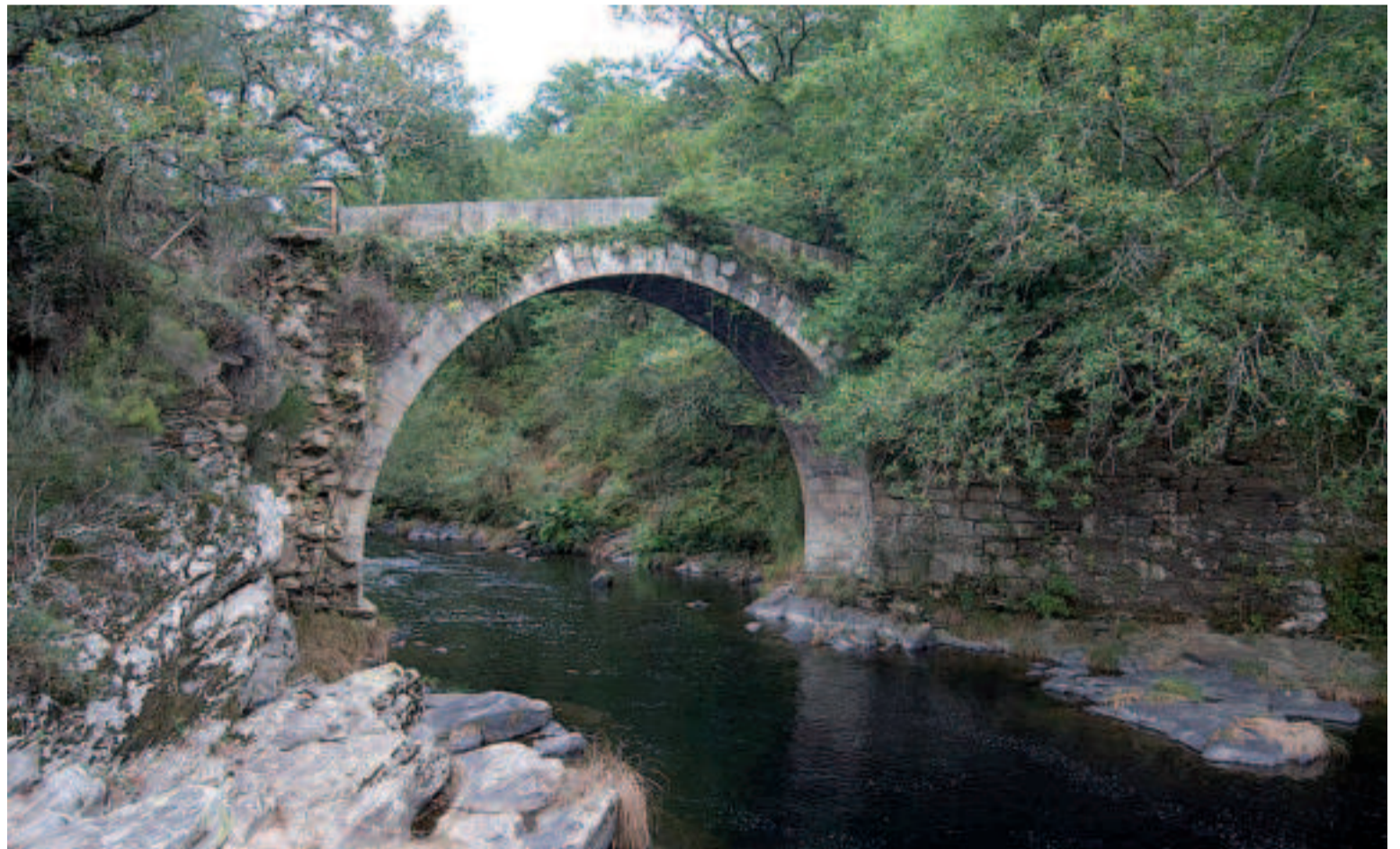
Puente de O Demo.