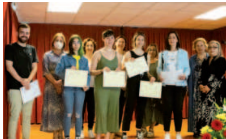
Fueron 11 las obras que recibieron galardón en esta edición.