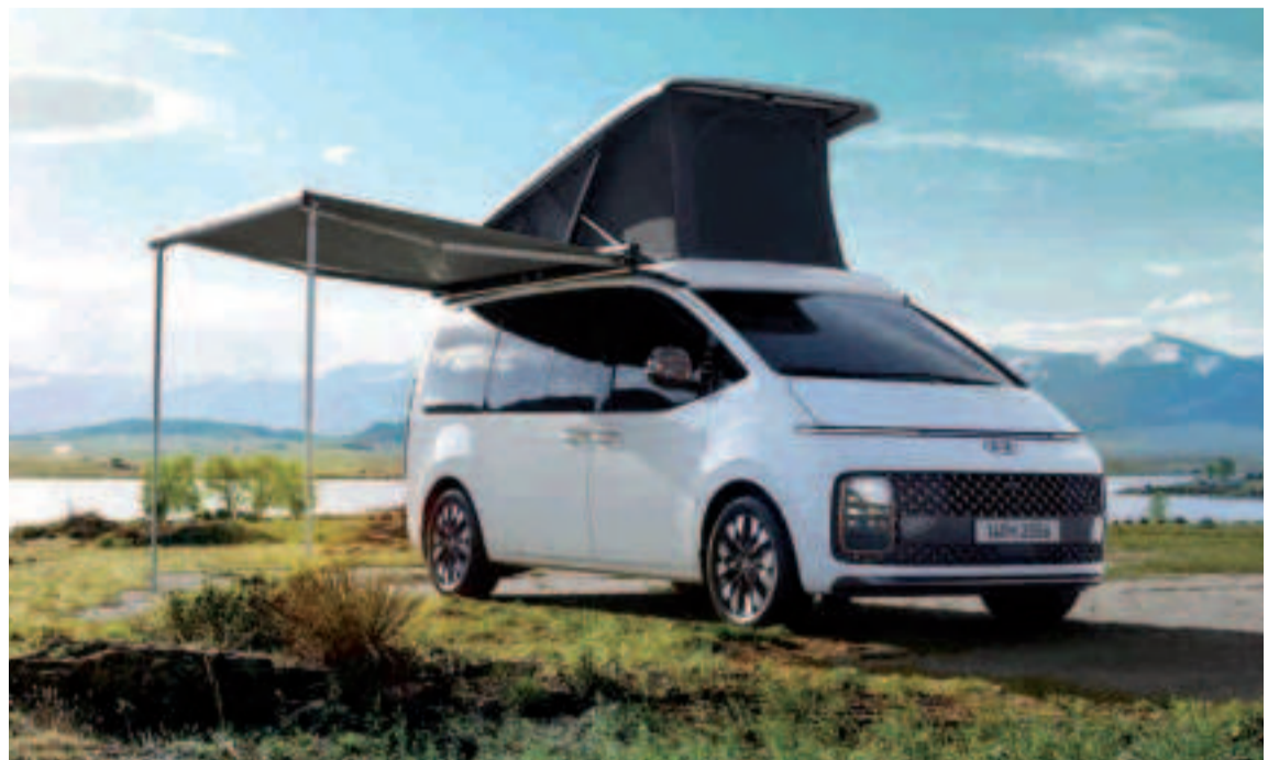
El Hyundai Staria, el nuevo monovolumen de Hyundai.