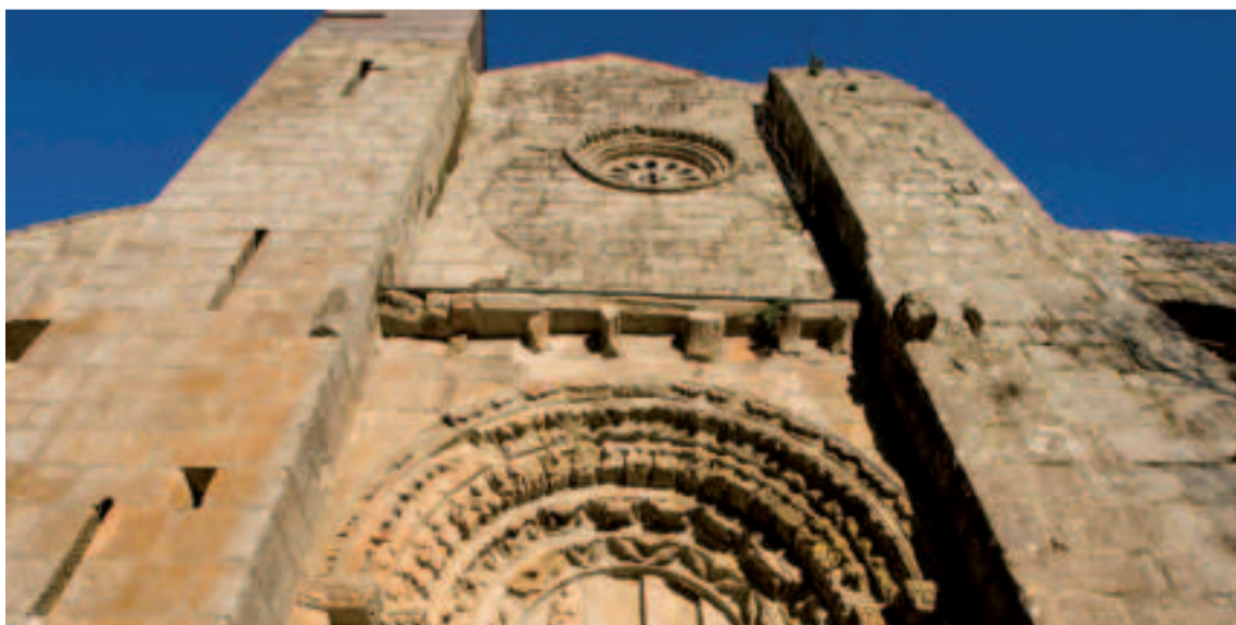
Fachada del Monasterio de Carboeiro.