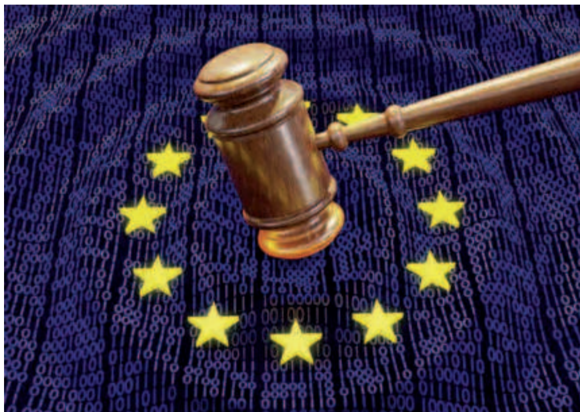
Desde Adine se están llevando a cabo las gestiones pertinentes para informar a todos sus asociados.

utilizada por la Comisión para calcular la diferencia entre el precio de los neumáticos chinos en Europa y el de la industria europea. Otro motivo ha sido la falta de respeto a los derechos de defensa de los productores chinos, a quienes se les negó el acceso a cierta información, incluida la metodología exacta utilizada para determinar el nivel de supuesto dumping. Desde Adine se están llevando a cabo las gestiones pertinentes para informar a todos sus asociados y conocer con exactitud el alcance de la sentencia, así como los posibles efectos y consecuencias que se deriven de la misma. La asociación recuerda que las partes involucradas tienen el derecho de apelar el fallo de la sentencia y, por tanto, el fallo definitivo podrá demorarse en el tiempo.