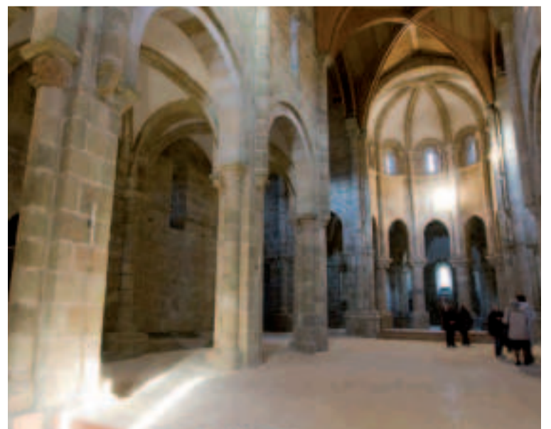
Interior del Monasterio de Carboeiro.