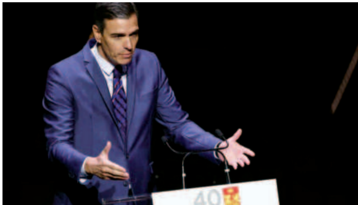
El presidente del Gobierno, Pedro Sánchez, ha defendido el aumento del gasto en Defensa.

El presidente del Gobierno, Pedro Sánchez, ha defendido el aumento del gasto en Defensa que a su juicio debe acometer España ante las amenazas que se presentan y dado que la seguridad no está garantizada de forma indefinida, según ha sostenido. En su intervención en el acto de conmemoración del 40 aniversario de la OTAN, ante el secretario general de la Alianza Atlántica, Jens Stoltenberg y el Rey Felipe VI, Sánchez ha señalado que es "imprescindible" reforzar las capacidades de disuasión y que estas solo se adquieren con el aumento de la inversión en Defensa. "Somos muy conscientes de ello", ha afirmado. Sánchez ha añadido que los aliados así se lo van a transmitir a sus sociedades. "Debemos hacer ese esfuerzo" ha apuntado, porque "es mucho mayor el coste de quedarse de brazos cruzados", mientras se pone "en jaque" la libertad y el modelo de convivencia pacífica, ha transmitido.