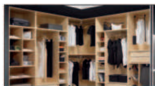
muebles a medida