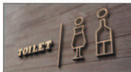
rotulación / señalética