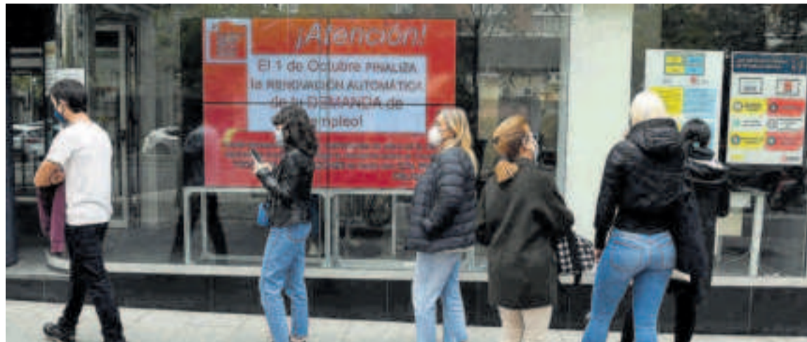
El paro registrado bajó en febrero de este año en 35.734 personas.

En términos desestacionalizados, el paro registrado bajó en febrero de este año en 35.734 personas. En el último año el desempleo acumula un descenso de 897.105 pa-