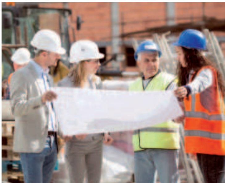
Trabajadores de la construcción.