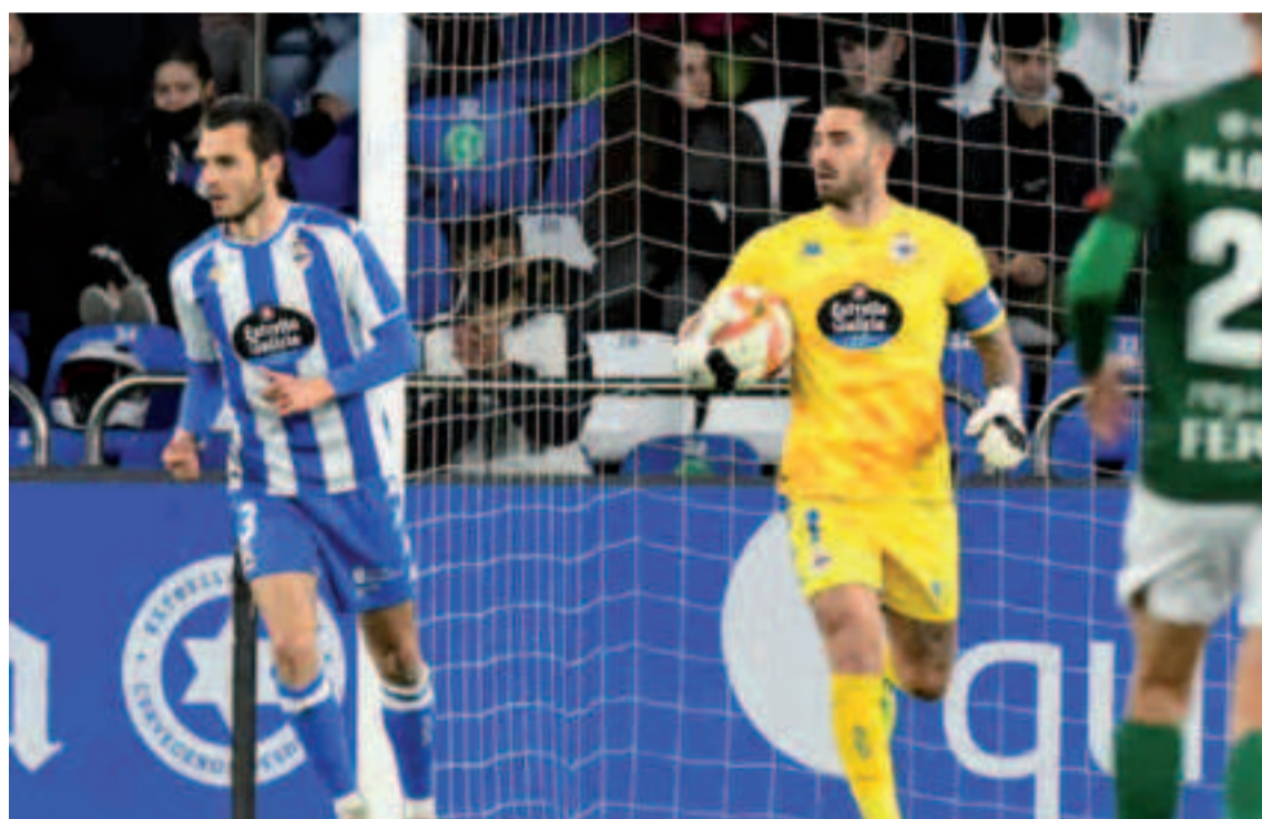
El Deportivo sigue sin encontrar el camino hacia el gol.