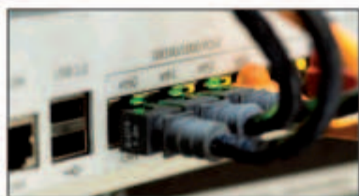
instalación de redes