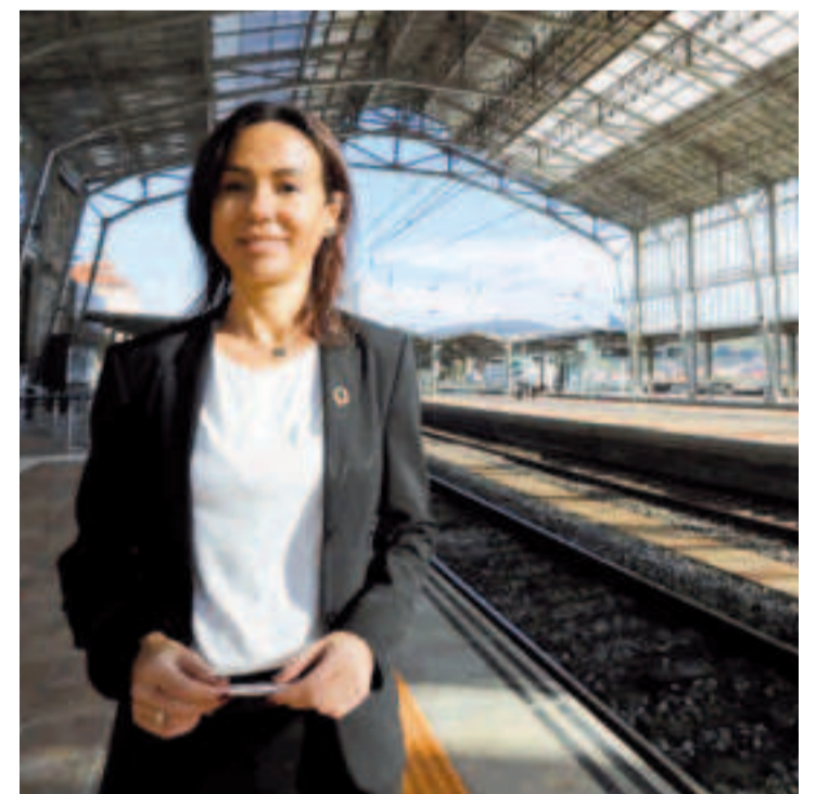
La nueva secretaria de Estado de Infraestructuras, Isabel Pardo de Vera.

Preguntada por el estado de las infraestructuras en la provincia de Lugo, ha reconocido, como gallega y lucense, haber experimentado esa "sensación de abandono", pero ha subrayado el "enorme trabajo" que se ha hecho. "Se han licitado más de 70 expedientes para la modernización de la línea y su electrificación. De los 145 millones de euros que vamos a destinar, más de la mitad están licitados para obras como la del túnel del Oural. No se puede trabajar más para Ourense - Lugo", ha apuntado Pardo de Vera.