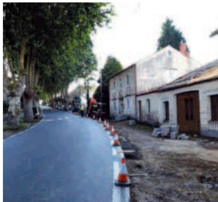
Vista actual de las obras.