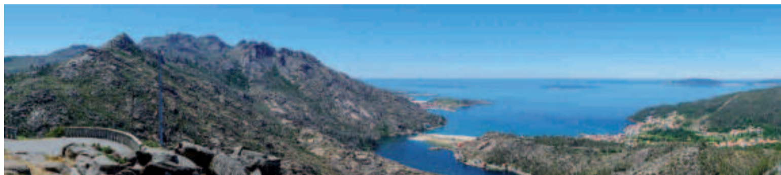
Mirador de O Ézaro.

El recorrido deja el paso por playas como Gures y ofrece una nueva perspectiva del punto de inicio, el cabo Fisterra, que desde lejos parece descansar sobre el océano. La mole granítica de O Pindo aparece frente a la carretera, cada vez más cerca. O Ézaro es un núcleo pequeño, agrario y mariner. Sus playas de aguas azul intenso conviven con dos colosos, la inmensidad de O Pindo y el cabo Fisterra en el horizonte. A la altura del puente de O Ézaro, un nuevo desvío dirige el recorrido hacia la cascada del Xallas.