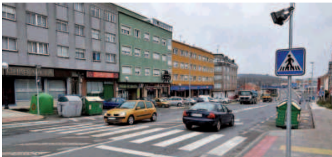
Un paso de cebra en Vilarrodís, en la carretera AC-552.