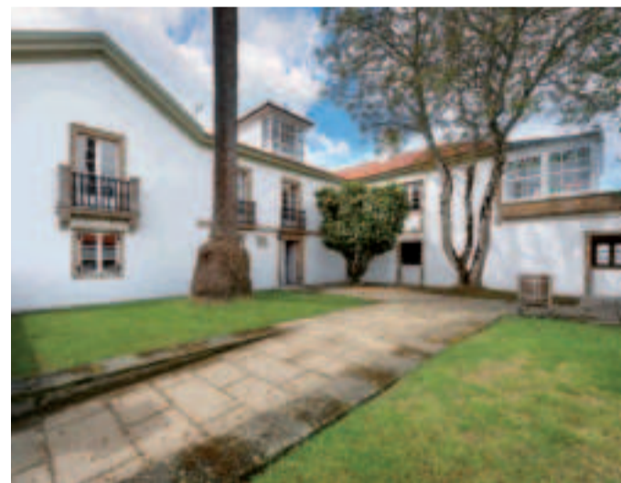
Pazo de Arenaza es municipal pero con uso cedido a la Diputación para espacio de trabajo compartido.

Este pazo de los años veinte fue en su día una propiedad enorme, de 50.000 metros cuadrados, con caballerizas árboles frutales, jardín, huerta, hórreo y pozo. Tras un proyecto urbanístico se construyó una urbanización de chalés al lado y el pazo pasó a ser propiedad del Ayuntamiento que lo destinó inicialmente a residencia de mayores y tras unos años cerrado y sin uso, ahora es espacio de emprendimiento.