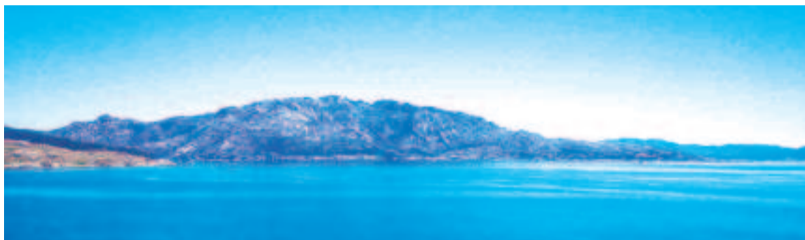
Vistas desde Cabo Cee.

A pesar de su escasa entidad y baja altitud, su posición ofrece vistas continuadas del litoral de Corcubión, Cee, Dumbría y Carnota e incluso del sector norte de las Rías Baixas. La proximidad al monte Pindo garantiza una perspectiva diferente de este espacio referen-