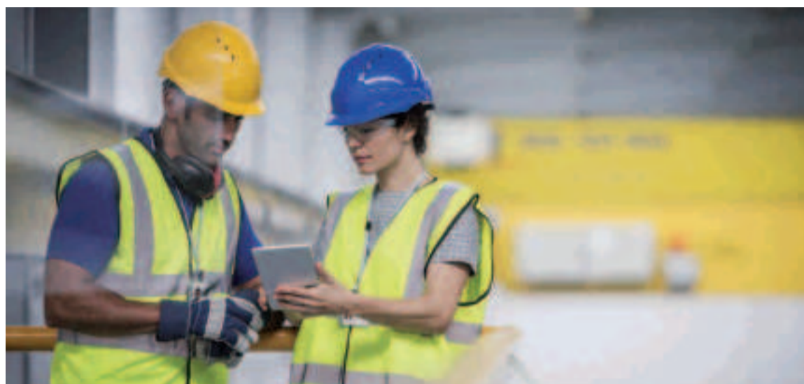
El número de afiliados a la Seguridad Social en Galicia se situó en julio en 1.036.272.

Por su parte, la afiliación a la Seguridad Social alcanzó en julio una media de 19.591.728 ocupados, un nuevo máximo histórico que