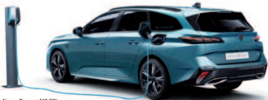
Nuevo Peugeot 308 SW.

pronunciada entrada de luz que ofrece la sensación de que el coche está más pegado al suelo, que es el secreto de su presencia. El diseño del marco de las ventanillas laterales, que tiene una mayor caída que el techo, crea una variación en el material que otorga al nuevo 308 SW una línea particularmente dinámica en su segmento. La parte trasera cuenta con los pilotos full LED ultrafinos de la berlina, pero sin la franja negra que los une. El nuevo Peugeot 308 SW busca aumentar la cantidad de chapa percibida, especialmente en la aleta trasera, para reflejar su mayor volumen y atraer la mirada hacia su superior espacio.