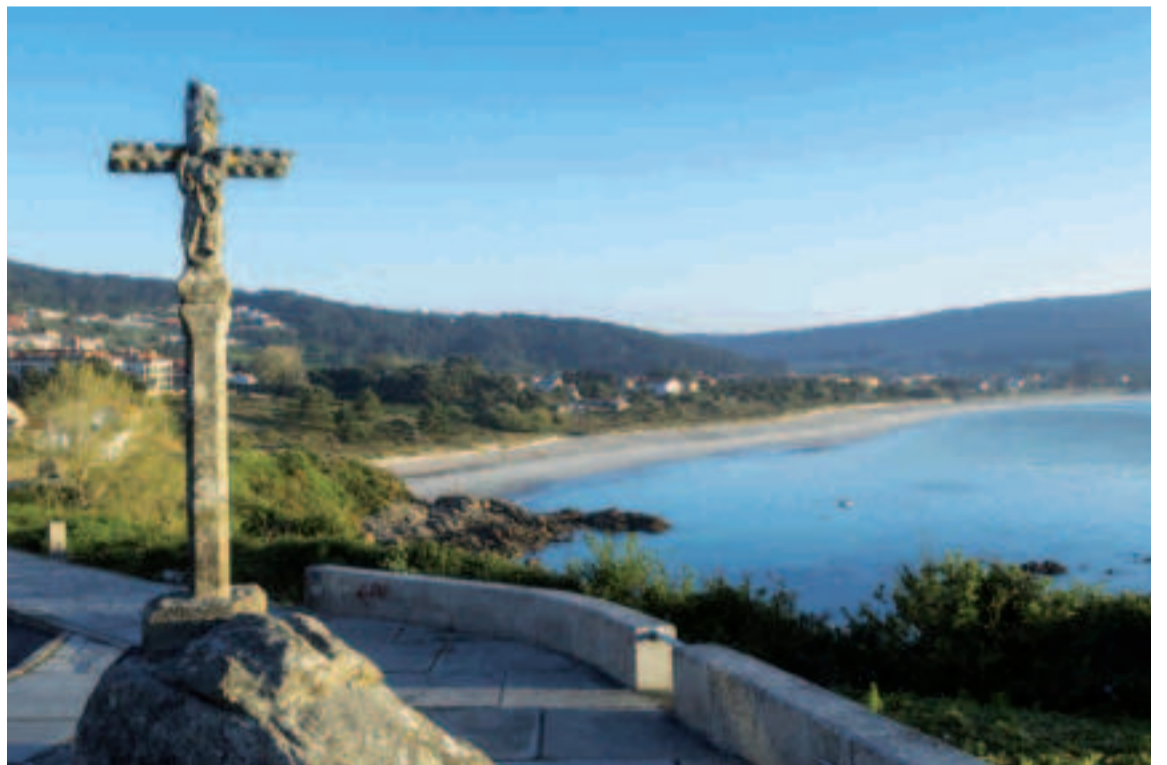
Ensenada de A Langosteira.

Saliendo del pueblo, la ensenada de A Langosteira alberga la playa del mismo nombre, un largo arenal de aguas transparentes que mira en la lejanía al monte Pindo. El paso por Sardiñeiro deja vistas y accesos a nuevas playas, más pequeñas como son Restrelo o Estorde. Un desvío nos llevará hacia A