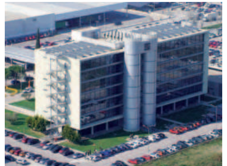
En la imagen, la fábrica que Seat tiene en la localidad barcelonesa de Martorell.

Durante el último mes, mercados como Francia (-13,6%), Alemania (-15,7%), Italia (-13,3%), Reino Unido (-16,7%) o Portugal (-25,2%) siguen registrando cifras negativas en comparación con el mismo periodo de 2019, aunque demuestran una mejor evolución que el mercado interno (-25,8%) que sigue siendo el que mayor caída registra. Este dato cobra especial importancia, teniendo en cuenta que uno de cada cuatro vehículos vendidos en España es de producción nacional.