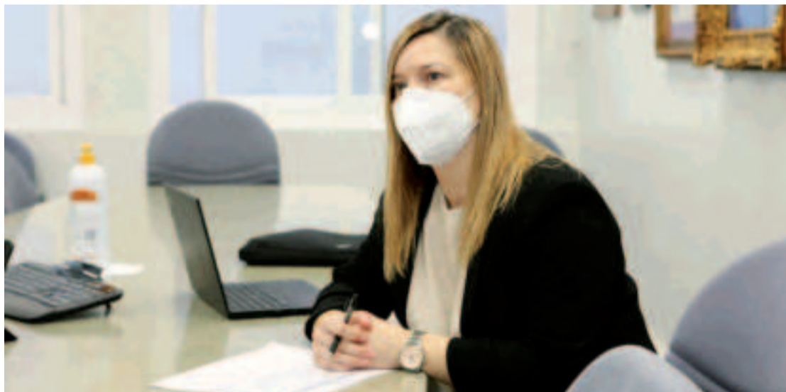
A deputada de Deportes, Cristina Capelán.

A través destas axudas financiaranse iniciativas como torneos e probas deportivas, novos programas deportivos para a mocidade, eventos, iniciativas de promoción, xornadas escolares, congresos, cursos, talleres de iniciación ao deporte, andainas ou carreiras.