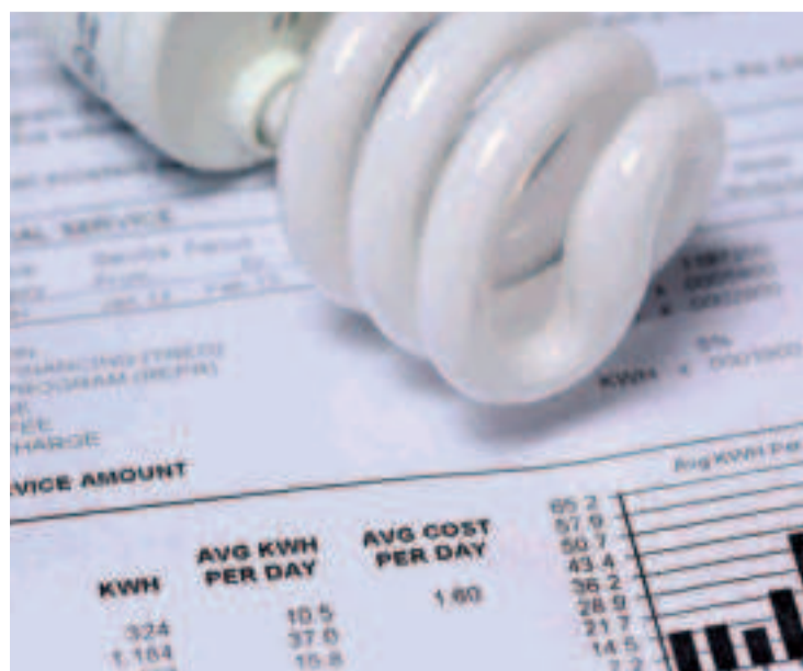
El precio de la luz, la gasolina y el gas, por las nubes en pleno verano.

La OCU también recomienda limpiar el lavavajillas por fuera, para lo que no se requieren cuidados especiales, ya que se pueden usar los mismo productos que para el resto de muebles de la cocina.