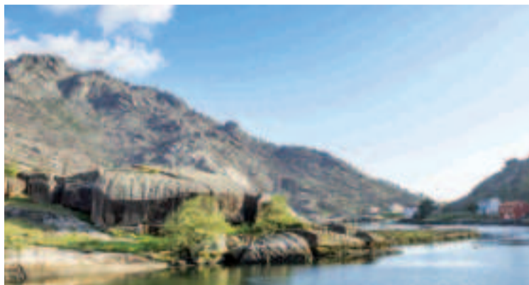
Monte O Pindo.

cial. El faro de Cabo C es conocido por algunos como faro del cabo Cee y por otros como faro del cabo de Corcubión, pareciendo el curioso nombre actual un pacto de buena vecindad entre ambas poblaciones. La edificación es una sencilla torre octogonal de mampostería con una pequeña vivienda anexa, de planta cuadrada y cuatro aguas, para el servicio del faro. Aprobado en 1847, no entró en funcionamiento hasta 1860, siendo automatizado en el 1934.