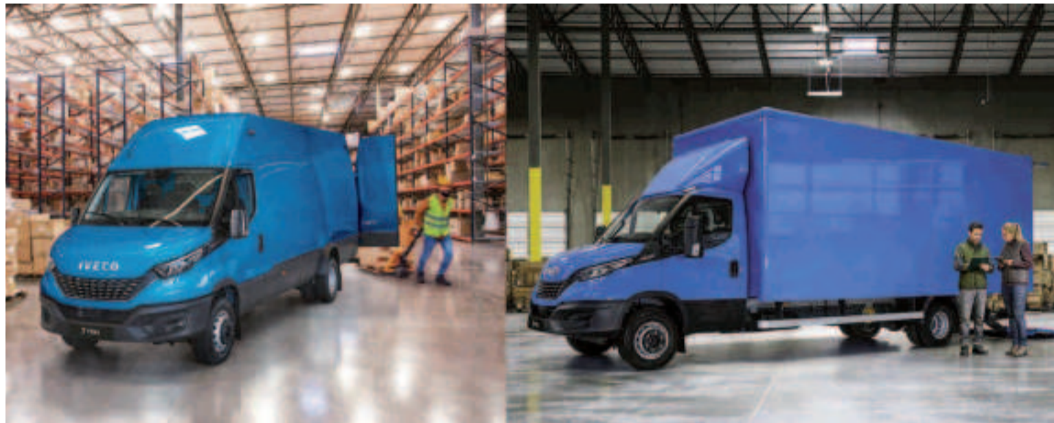
Las variantes de furgoneta de la Daily 7-Ton, que se extienden desde los 16 m3 hasta los 19,6 m3, líderes en su clase, son una base ideal para el transporte de carga o las conversiones.

La Daily 7-Ton también está disponible con un motor de gas natural comprimido que produce 136cv y 350nm con una reducción de hasta el 95% de CO2 cuando se utiliza con biometano.