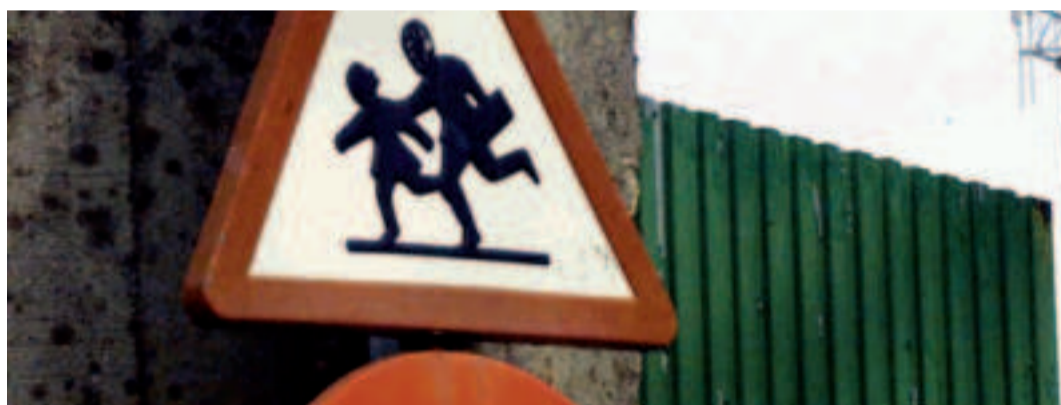
El proyecto se llevará a cabo en Vilaboa, O Burgo y Cordeda.

De las actuaciones, destaca, por el número de usuarios, las que se llevarán a cabo en Domingo Sierra y rúa Calzada (que será peatonalizada) para mejorar la entrada en el CEIP Sofía Casanova. En la primera se elevarán los tres pasos de peatones.