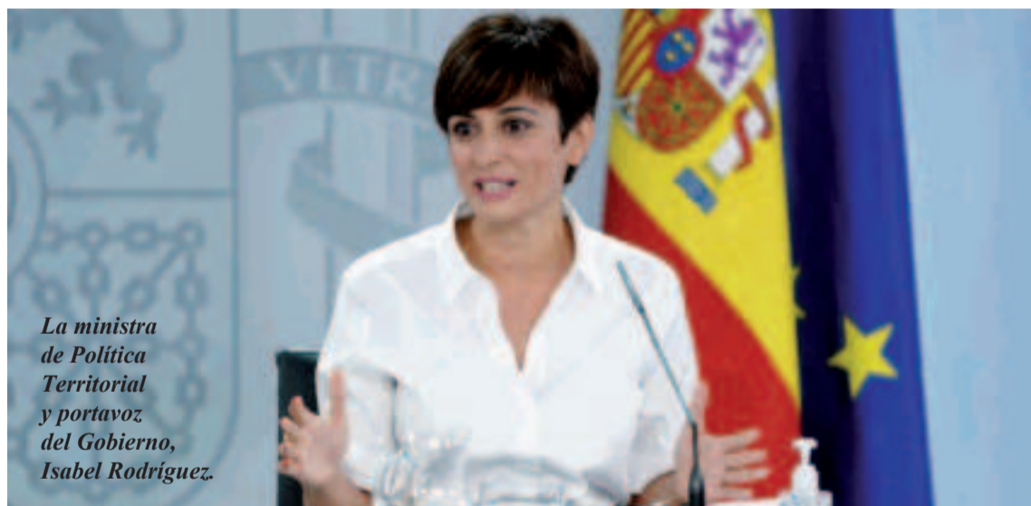
La ministra de Política Territorial y portavoz del Gobierno, Isabel Rodríguez.

"Una prórroga a ese escudo social que es la protección de los más vulnerables en el ámbito de los suministros energéticos, de protección de la vivienda, para evitar que tengan que abandonar sus hogares como consecuencia de la situación de pandemia, y en la protección de los servicios esenciales a las víctimas de violencia de género, hasta el 31 de octubre", ha explicado la ministra de Política Territorial y portavoz del Gobierno, Isabel Rodríguez. En la rueda de prensa posterior al Consejo de Ministros, el último antes de las vaca-