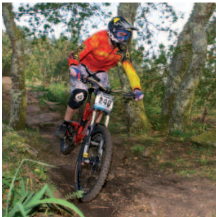
Ante a imposibilidade de usar o seu escenario habitual de Coruxo, a organización, demostrou o seu saber facer nesta especialidade do BTT.

O rider do Teamjustbikes-Transition impúxose na VigoBikeContest, a cita que nos montes da parroquia olívica de Saiáns repartiu dez títulos autonómicos. Ante a imposibilidade de