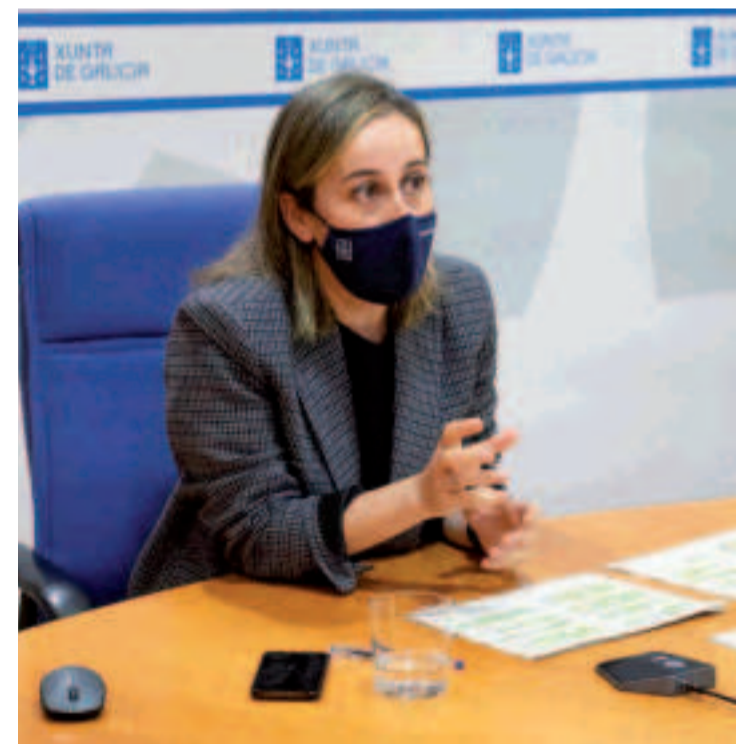
Preocupación por las escasas frecuencias de trenes y la no reposición de los servicios cuando la situación sanitaria lo permitía.

la batalla y mantendrá ante el Gobierno de España su reivindicación de que los gallegos dispongan de servicios de tren competitivos y de calidad y su rechazo a que la pandemia sirva al Gobierno de España de excusa para recortar prestaciones y puestos de trabajo en el tren. Según informó la Xunta en un comunicado, la conselleira lamentó que las respuestas obtenidas a ese medio centenar de escritos se limitasen a decir que los servicios se recuperarían cuando aumente la demanda. Eso, en palabras de la titular de Infraestructuras y Movilidad, "es un círculo vicioso, ya que si no se oferta un buen servicio a los ciudadanos es imposible que se recupere la demanda".