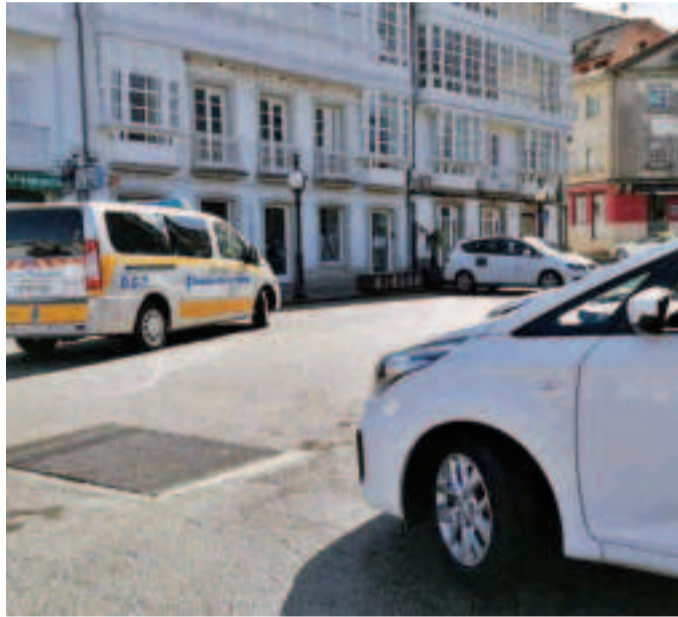
Trátase de actuacións de pavimentación e sinalización horizontal e vertical.