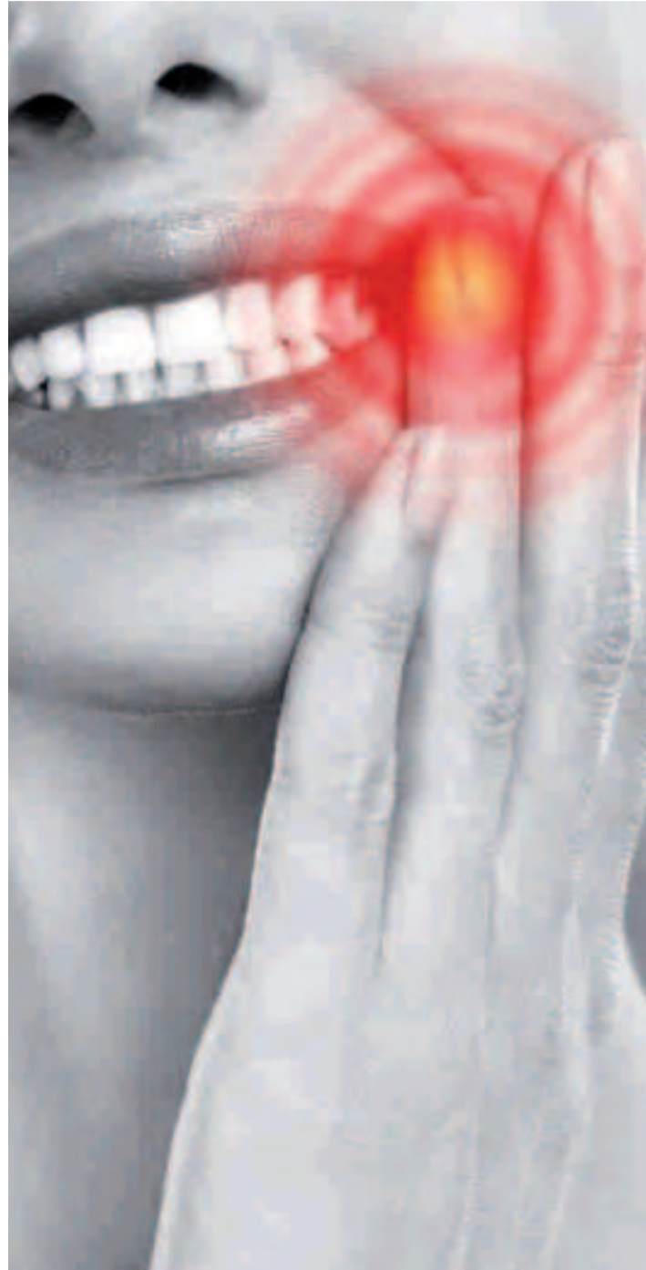
Adoptar malas posturas mientras se teletrabaja desde casa puede favorecer la aparición de bruxismo.

Así, más allá del estrés, trabajar desde casa y no contar con una silla adaptada o regulable o no utilizar el ordenador en una mesa acorde con nuestras necesidades puede llevar a adoptar malas posturas. De esta forma trabajar en el sofá o en mesa del comedor o hacerlo encorvado produce posturas incorrectas que pueden acabar afectando a la articulación temporomandibular (ATM) (encargada de la oclusión