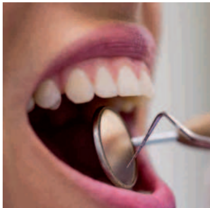
Cuanto más relajado esté nuestro cuerpo, menos tensión tendremos en la mandíbula.

dentaria y que permite masticar, tragar y hablar) y ocasionar bruxismo. “Una mala postura durante el día puede provocar que apretemos los dientes mientras dormimos. Cuanto más relajado esté nuestro cuerpo, menos tensión tendremos en la mandíbula”.