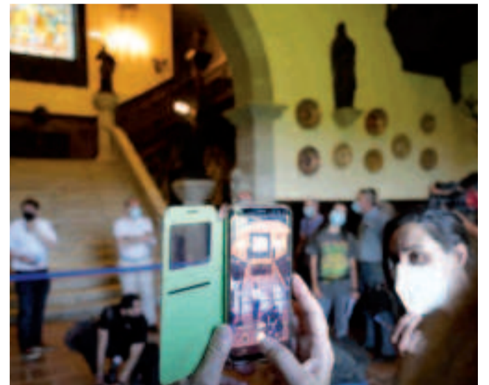
As visitas guiadas realizaranse en grupos de 20 persoas.

As visitas guiadas realizaranse en grupos de 20 persoas como máximo previa reserva no correo electrónico reservaspa-zo-demeiras@sada.gal ou a través dos teléfonos 981620075(Ext 264) onde confirmarán data e hora da visita. Os grupos completos deberán facer obrigatoriamente a reserva por correo electrónico.