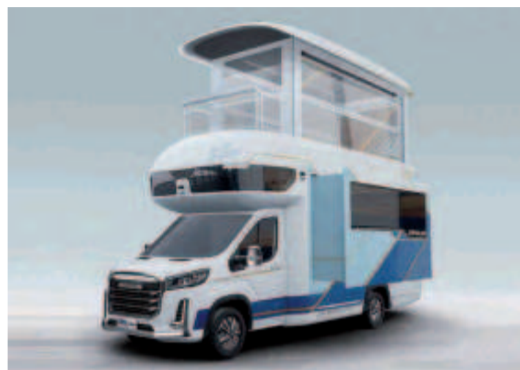
Autocaravana china con dos plantas, terraza y ascensor.

tres opciones de longitud (L1H2, L2H2 y L3H2) y tres alturas, con tracción delantera o trasera. Además, está disponible tanto en furgón como en chasis cabina y tracción trasera con dos longitudes. Su precio arranca en los 20.738 euros de la versión L1H1 Comfort. La gama de furgonetas Maxus se distribuirá en España por un total de 30 concesionarios, según ha informado Bergé Auto.