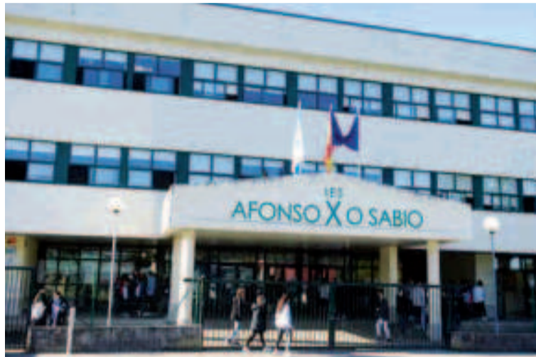
IES Afonso X O Sabio.