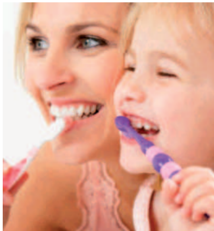
Una buena higiene y acudir a las revisiones periódicas del dentista es esencial para evitar posibles complicaciones.

diabéticos o que tienen cardiopatías”. El primer paso, por tanto, será mantener una buena higiene. “No podemos escudarnos en que llevamos mascarilla y nadie va a ver si tenemos los dientes más o menos limpios. En este momento, más que nunca, es imprescindible una boca sana”. El segundo paso, acudir a revisión para detectar precozmente cualquier posible problema. “No hay que tener miedo: las clínicas dentales son espacios seguros (asegura el doctor Castro). Entre otras razones, porque, con el auge de las enfermedades infectocontagiosas, como las hepatitis, los dentistas fuimos los primeros en adoptar protocolos estrictos para protegernos a nosotros y a nuestros pacientes. La utilización de mascarillas, guantes y batas desechables, así como la desinfección de superficies, ha sido norma desde hace tiempo. Ahora, con el coronavirus hemos ampliado aún más las distancias de seguridad”.