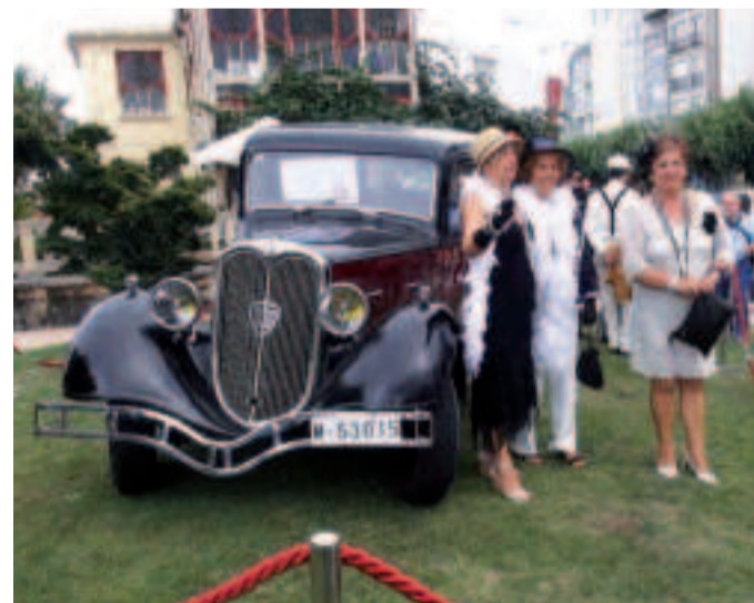
La “Feria Modernista” se celebrará el 31 de julio y 1 de agosto.

indicando el lugar de la celebración de la misma. Por otra parte, el Ayuntamiento está trabajando en un programa de fiestas en un entorno de seguridad, acorde a la situación sanitaria programando actividades en formato pequeño de carácter familiar para crear ambiente en la calle durante este verano. En las Fiestas del Carmen, 16, 17 y 18 de julio se celebrará el "Festival do Carme", un formato de pequeños conciertos y artes escénicas. Además, se programa el Mercado Marineru y también la presencia de los Patexeiros. La “Feria Modernista” se celebrará el 31 de julio y 1 de agosto en una versión condicionada por las restricciones sanitarias vigentes. Confirman el Picnic modernista, pasacalles así como actividades musicales y de ocio en pequeño formato. Sada celebrará las Fiestas de Agosto del 13 al 18, sin sardiñada y sin orquestas, pero con ambientación en la calle con actividades, incluyendo en la programación el concierto de Ellas son Artistas el 15 de agosto.