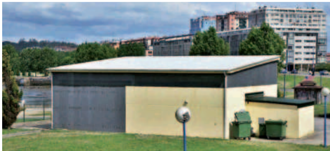
Estación de bombeo de Acea de Ama.