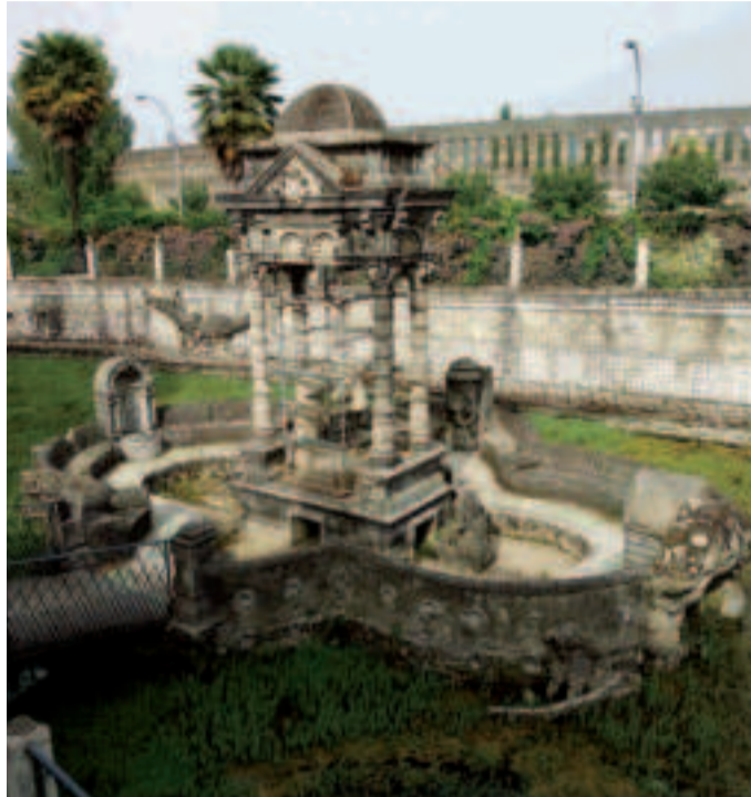
Estanque del Retiro de El Pasatiempo en Betanzos.