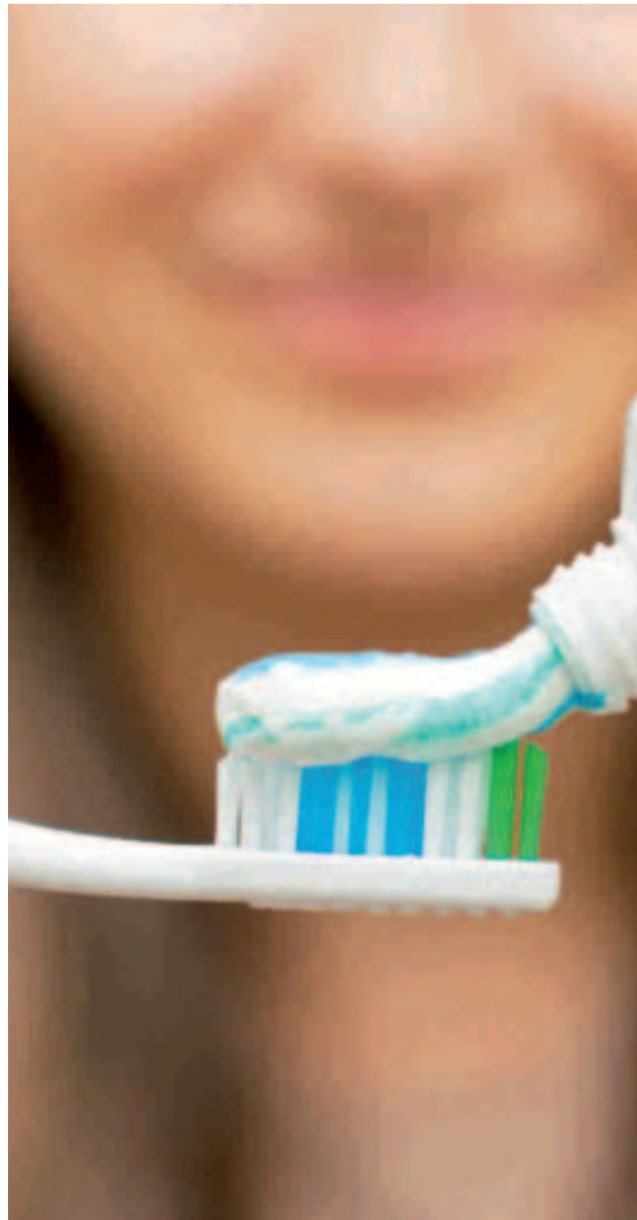
La boca y la covid-19 están estrechamente relacionadas.

Son numerosos los estudios que ponen de manifiesto esa relación entre una inadecuada salud bucodental y otras enfermedades sistémicas. No debemos olvidar que los patógenos de la boca pueden pasar al torrente sanguíneo y alcanzar órganos como los pulmones, los riñones o el corazón. “Es muy importante combatir estas bacterias patógenas orales para así prevenir enfermedades respiratorias, renales, cardiovasculares o metabólicas. Y esto es ahora más importante aún: una higiene ineficaz provoca inflamación de las encías, y esta inflamación eleva el riesgo de complicaciones en pacientes con covid-19, especialmente en aquellos que están inmunodeprimidos, que son