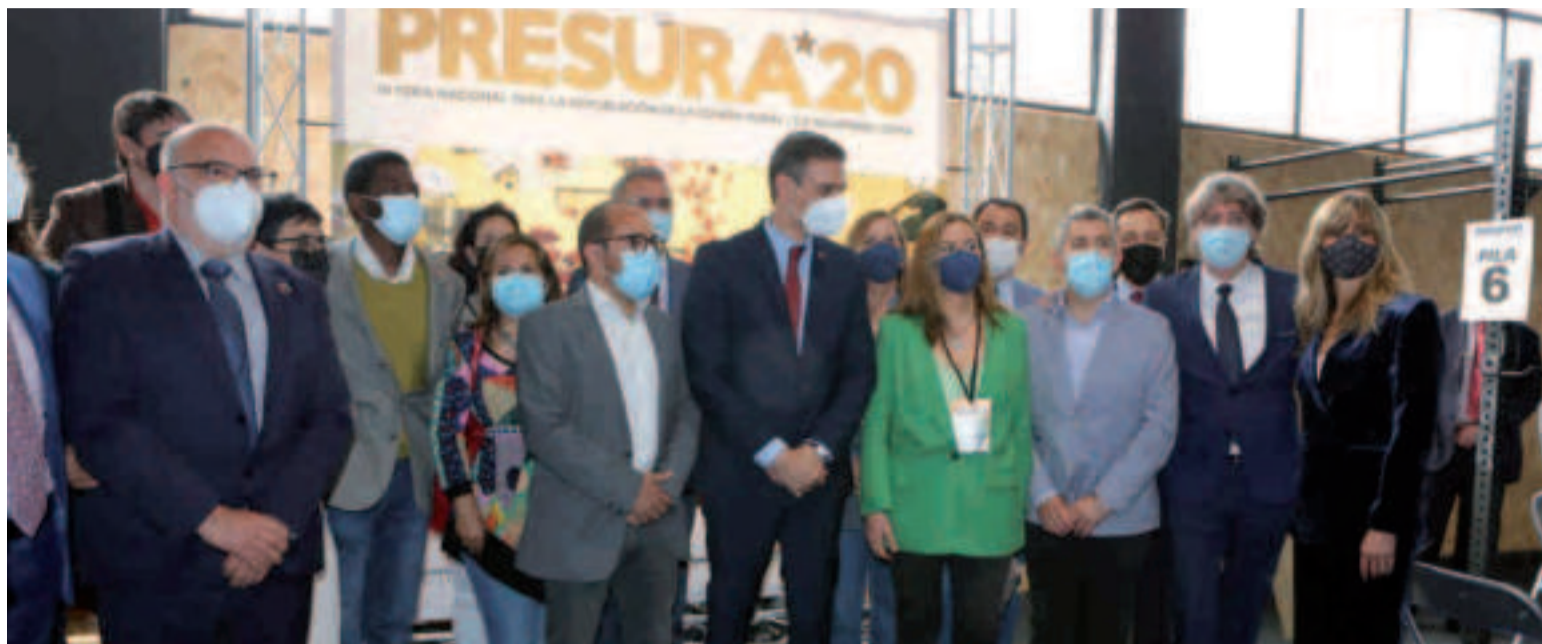
El presidente del Gobierno, Pedro Sánchez en la inauguración de la IV Feria Nacional para la Repoblación de la España Rural "Presura 20" en Soria.