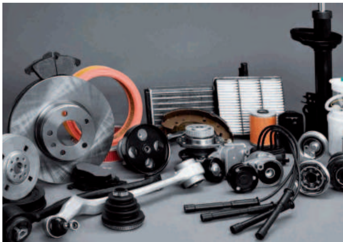
La memoria concluye que la distribución de recambios para V.I. ha crecido un 7% el primer trimestre.

“El sector se encuentra animado y con fuerzas para remontar. Hace unos meses esperaba crecer un 6,2% este 2021 y en pocos meses esa cifra ha crecido casi cuatro puntos. Es una señal de que el sector está trabajando en su recuperación y de que se podrían alcanzar los niveles de 2019 durante este año”, ha indicado Miguel Ángel Cuerno, presidente de la asociación.