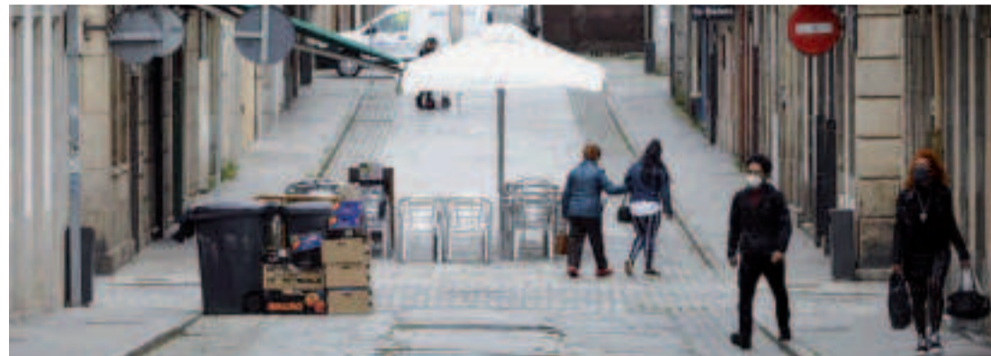
Ambos grupos municipales incluyen en sus propuestas una rebaja de las sanciones, ante la situación económica que se está viviendo.