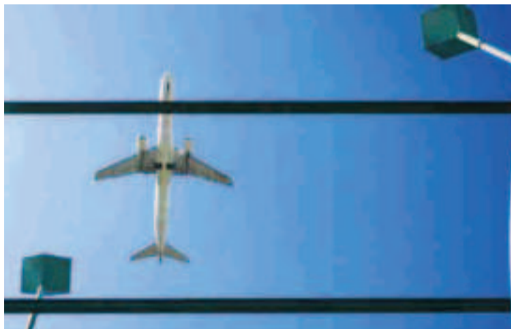
Un avión pasa por encima de los postes del ILS de Alvedro.

El gestor del espacio aéreo ha bajado en menos de un año dos veces los límites de esta decisión porque, en esta cabecera, que es la única que tiene ILS para ayudar a los pilotos a tomar tierra en condiciones de escasa visibilidad, el radioaltímetro ofrecía lecturas erróneas cuando funcionaba en categoría II, que es la que se usa cuando la visibilidad es casi nula. El último cambio entró en vigor el 16 de agosto y ahora está recogido en la nueva carta topográfica que se empezará a utilizar el 10 de octubre. Estas modificaciones se realizan para evitar desvíos ya que, cuando el ILS funcionaba en categoría II, a veces, el radioaltímetro