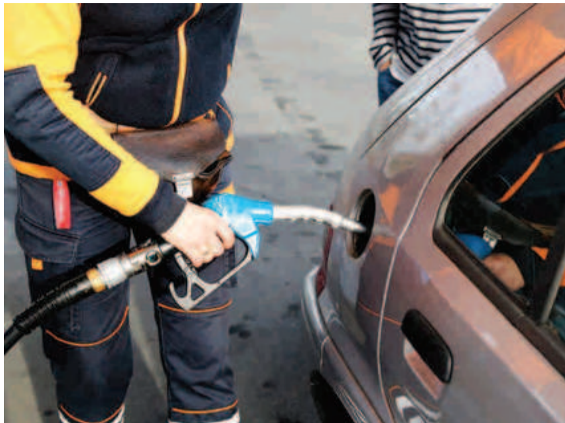
La operación retorno en Galicia, con los carburantes más caros en cuatro años.

La red de gasolineras en Galicia es cosa de tres: Repsol (que tiene la mayor cuota, y que no puede abrir ya más estaciones, al superar el 30 % del mercado en las cuatro Provincias, Cepsa y Galp. Pero ese trío tiene algo menos de peso en el conjunto de la comunidad por la irrupción, lenta, de nuevos operadores, pequeñas estaciones independientes que en los tres últimos años se están beneficiando de un procedimiento administrativo que les da prioridad. Actualmente ya suponen cerca del 25 % de todos puntos de suministro de la comunidad, según los datos que maneja la Consellería de Economía. La teoría apunta a que este tipo de instalaciones, no abanderadas por ninguno de los grandes, tiran de los precios hacia abajo, y mejoran la competencia, algo muy necesario en una comunidad como Galicia, con los carburantes más caros de la España peninsular.