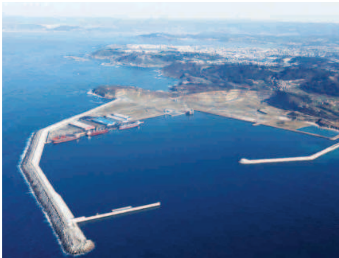
Panorámica del Puerto Exterior de A Coruña.

Con gran probabilidad y a poco que la economía Europea siga