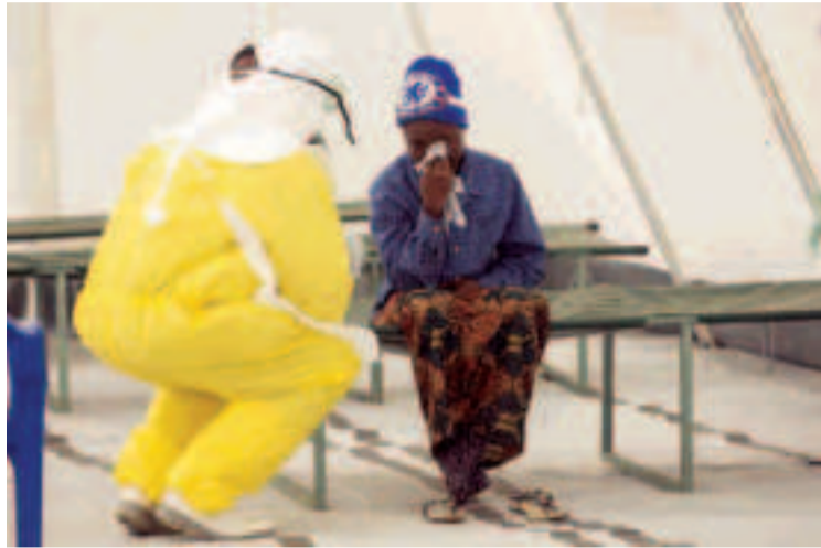
Un médico atiende a un paciente con ébola en Sierra Leona.

Desde que se identificó el primer virus humano, el que provoca la fiebre amarilla, en 1901, se han descubierto 263 virus que infectan a nuestra especie. Los responsables del proyecto, liderado por la ONG EcoHealth Alliance y USAID (la Agencia de los Estados Unidos para el Desarrollo Internacional), calculan que quedan por descubrir alrededor de 1,67 millones de especies que habitan dentro de mamíferos y aves, los huéspedes más habituales de estos microorganismos. De esos, estiman que entre 631.000 y 827.000 tienen potencial para infectar a humanos.