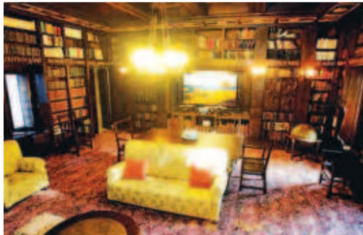
Imagen del interior del Pazo.