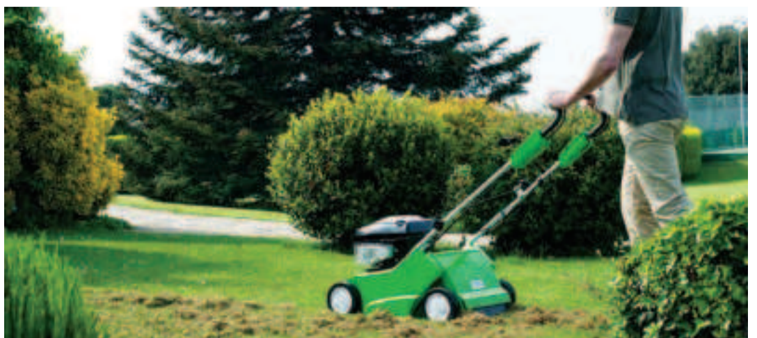
Un césped que se escarifica una o dos veces al año crece mejor y más sano.

el musgo y las malas hierbas. El escarificado debe realizarse con tiempo seco y con una temperatura de suelo superior a 10°C. Después del escarificado conviene hacer un buen enarenado, abonado y en caso de grandes calvas hacer una buena resiembra.