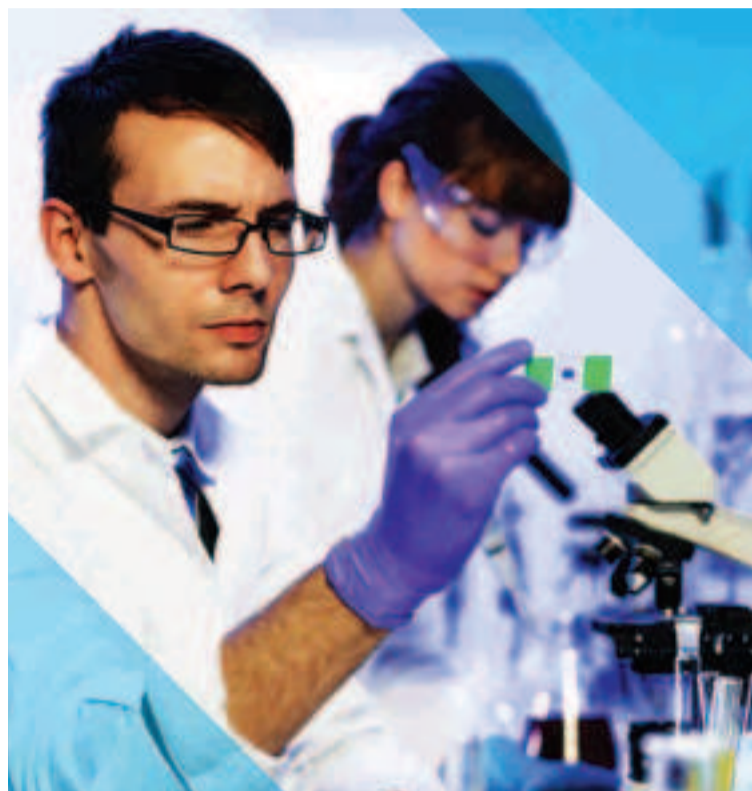
Hay 1.500 plazas a repartir entre todos los jóvenes españoles de edad inferior a 30 años.

Hay 1.500 plazas a repartir entre todos los jóvenes españoles de edad inferior a 30 años. El plazo de solicitud dura hasta que se agoten. Según el último comunicado oficial, el 1 de febrero de 2018 había 1.440 visados concedidos y 67 en trámite. La principal ventaja del visado es que otorga un año de visa y permiso para trabajar a jornada completa (40 horas a la semana). Los inconvenientes son la