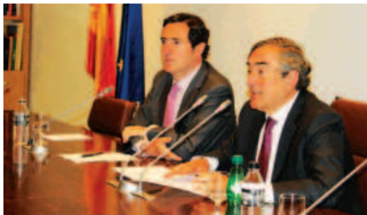
El vicepresidente de la CEOE, Antonio Garamendi, y Juan Rosell.