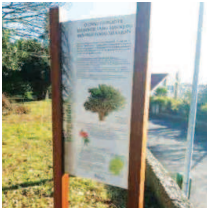
Señal del tejo de Baldomir.

Esta actuación completa la realizada hace poco con fuentes y lavaderos de todo el municipio, que también tienen ya sus señales explicativas.