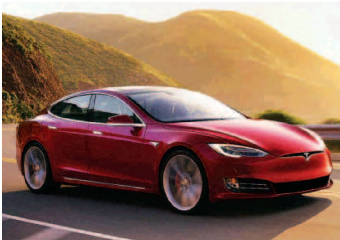
Tesla Model S.

Sin embargo, éste límite de gasto no solo ha afectado a los modelos Premium de las grandes marcas, sino que también ha hecho mucho daño a otros fabricantes enfocados a la fabricación de coches eléctricos, especialmente Tesla. Los usuarios no pueden adquirir un Tesla Model S básico en Alemania por menos de 60.000 euros, justo la cantidad que marca el límite. "Esta es una acusación completamente falsa. Cualquier persona en Alemania puede pedir una versión básica del Model S sin el paquete confort, y hemos entregado dichos