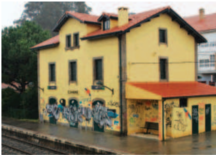
Vía férrea a su paso por la estación de Cambre.