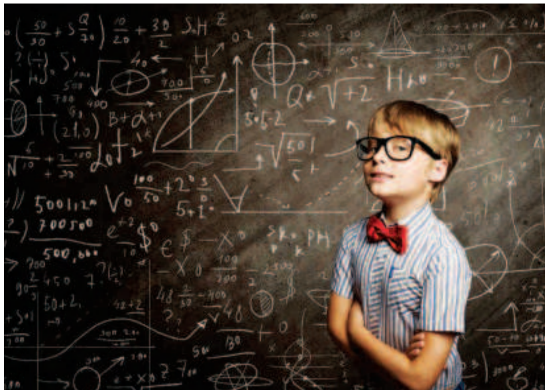
Expertos denuncian la falta de programas eficaces para los superdotados.

El 8 por ciento de ellas fueron realizadas por profesionales de enseñanza media y universitaria y un 4%, por maestros de escuelas. La mayor parte de las peticiones atendidas se focalizaron en dos tipos de problemas: alumnos con altas capacidades no atendidos por los centros educativos (40%) y estudiantes valorados por psicólogos privados, que recurren a la asociación para recabar información (30%).