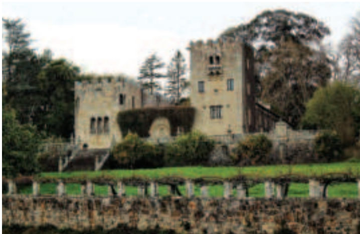
Pazo de Meirás.

No podemos seguir fingiendo que todo va bien y que Sada es idílica pues las oportunidades se presentan una vez y no suelen repetirse, si se pierden no hay otra oportunidad y al final los que pagaremos las consecuencias seremos todos los habitantes de Sada.