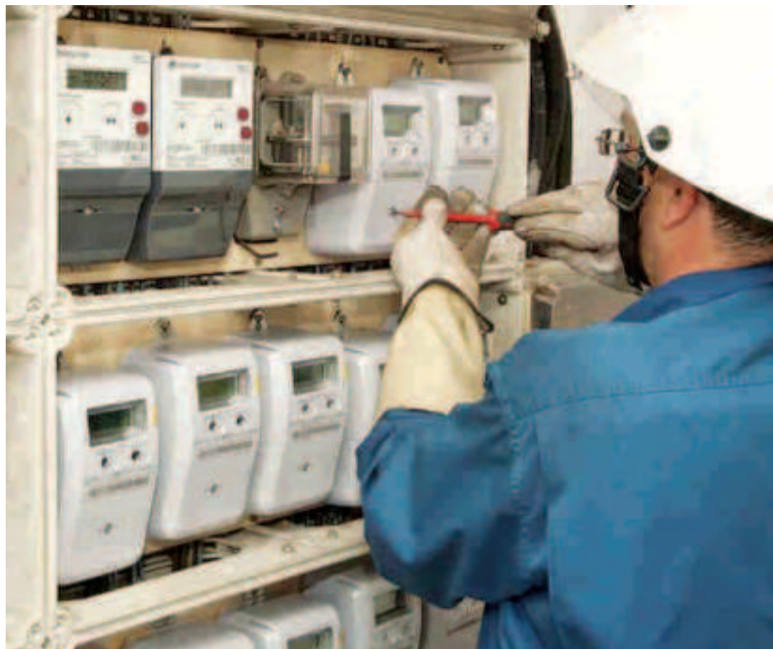
El recibo de la luz ha subido un 12% y el del gas un 4,5% en lo que va de año.

Instalación de contadores de luz. La factura de la luz y el gas vuelven a dispararse con la llegada del fin de año como ya ocurriera en los meses finales de 2016 pese a los esfuerzos del Gobierno de Energía por contener el recibo energético. El precio de la electricidad para el consumidor medio ha aumentado un 4,6% en lo que va de diciembre, mientras que la materia prima del gas también ha sufrido un fuerte incremento lo que motivará que el recibo aumente en enero un 6,2 % de media, cuando se haga la revisión trimestral.