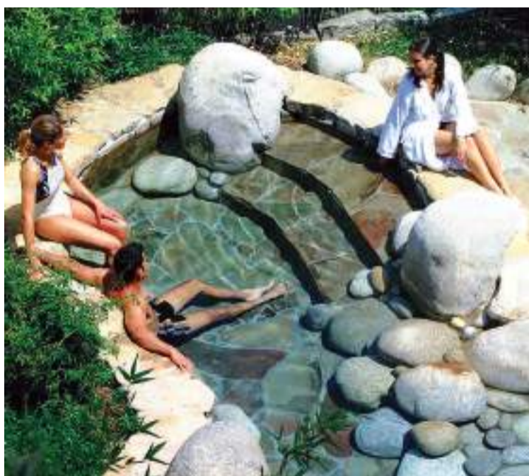
Balneario de Mondariz.

Desde el estuario, avanzamos en esta segunda jornada hacia el norte por una inusual y recta costa que contrasta con las sinuosas rías gallegas. De camino a Baiona, podéis hacer una parada en el convento de Oia, fundado en 1137. Su silueta parece la de un castillo-fortaleza a las orillas del mar. De hecho, en diversas ocasiones ejerció de bastión defensivo.