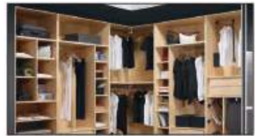
muebles a medida