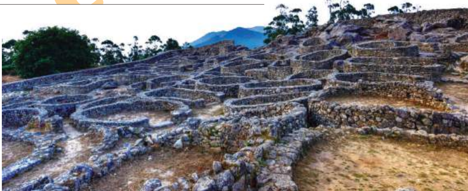
Castro de Santa Trega.

Aunque os parezca un poblado caótico, hay un orden lógico alrededor de "unidades familiares" que os podríais animar a descubrir; así como los petroglifos que se encuentran fuera y dentro del recinto, o la Pedra Furada (Piedra Agujereada), una gran roca hueca con una ventana natural. Es posible que aquí viviesen hasta cinco mil personas. Tenían una economía autónoma y también elaboraban cerámicas, joyas, tejidos e instrumentos a los que podréis ponerles forma en el museo arqueológico situado en el pueblo.