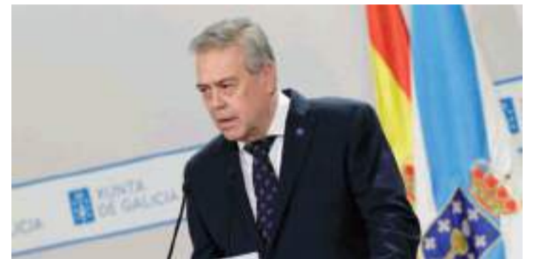
El conselleiro de Sanidade, Antonio Gómez Caamaño.

400.000 euros por paciente. Así lo ha concretado el presidente autonómico en la comparecencia de prensa posterior a la reunión semanal de su Gobierno. También ha intervenido ante los medios el conselleiro de Sanidade, Antonio Gómez Caamaño, quien se ha hecho eco de esta inversión, al tiempo que ha destacado los «buenos» resultados del plan de compra centralizada de la Administración autonómica.