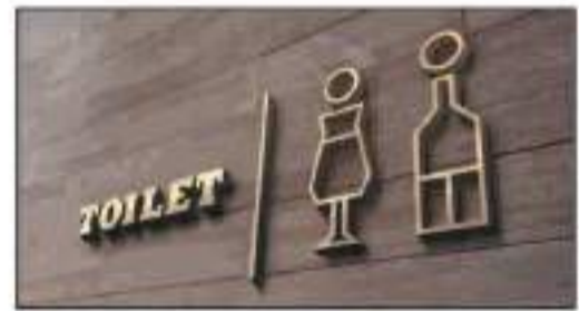
rotulación / señalética