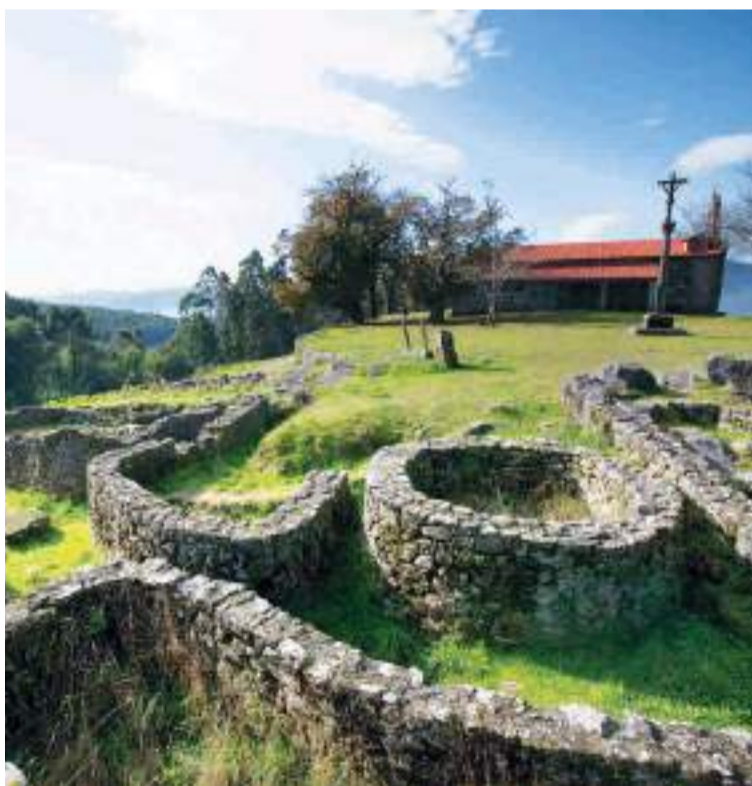
Castro de Troña.

en el camino para visitar el conjunto etnográfico de los molinos de Folón y de Picón, en el municipio de O Rosal. El recorrido de 3,5 km que une los 67 molinos hidráulicos de los s. XVII y XVIII y observarlos en perspectiva, con su disposición en escalera para aprovechar la fuerza del agua.