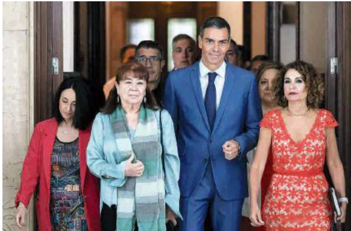
Pedro Sánchez, ha anunciado nuevas medidas destinadas a mejorar el acceso a la vivienda de los jóvenes.

Según ha explicado Sánchez, la nueva ayuda de casi 30.000 euros está ideada para que las personas de hasta 35 años "puedan residir durante años en una vivienda con protección permanente y terminar adquiriéndola".