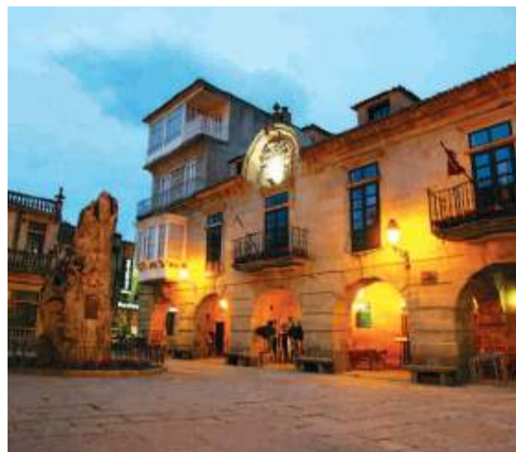
Pazo de Mendoza - Baiona.

gen y ocupación se sitúa entre el s. VI a. C. y el s. II d. C. y actual-