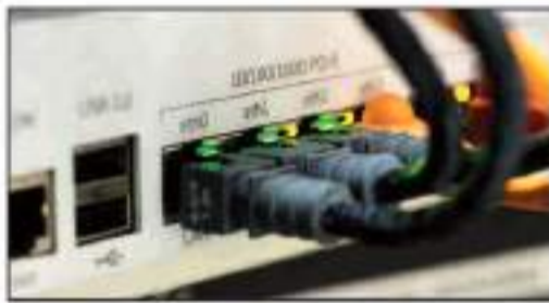
instalación de redes