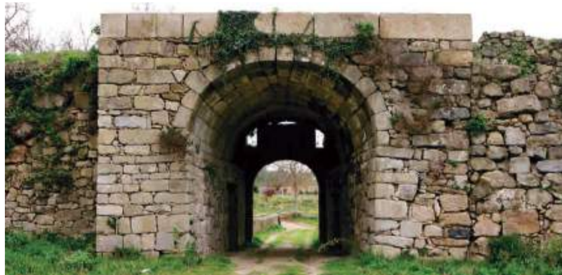
Castillo Militar de Goián.