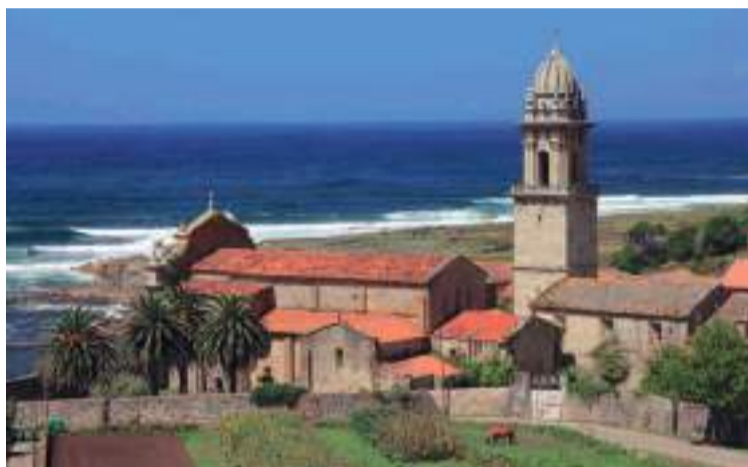
Monasterio de Santa María de Oia.

Desde el estuario, avanzamos en esta segunda jornada hacia el norte por una inusual y recta costa que contrasta con las sinuosas rías gallegas. De camino a Baiona, podéis hacer una parada en el convento de Oia, fundado en 1137. Su silueta parece la de un castillo-fortaleza a las orillas del mar. De hecho, en diversas ocasiones ejerció de bastión defensivo.