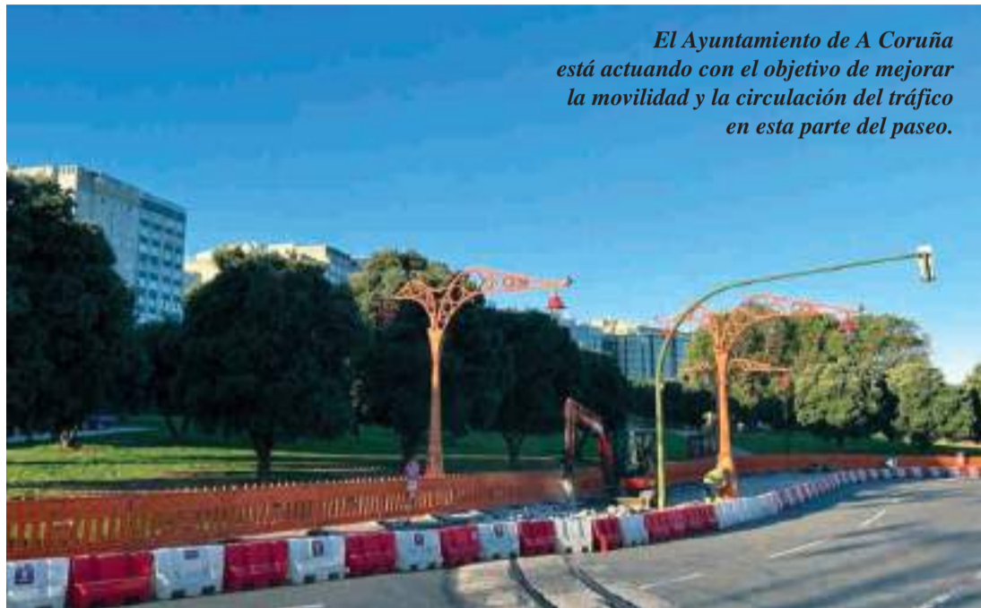
El Ayuntamiento de A Coruña está actuando con el objetivo de mejorar la movilidad y la circulación del tráfico en esta parte del paseo.