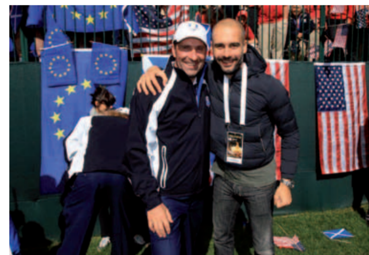
Olazábal y Guardiola.

Sergio García: "La Ryder Cup me vuelve loco, no hay nada igual. Ha sido increíble. Sabíamos que lo teníamos crudo pero también estábamos convencidos de que no todo estaba acabado y había una oportunidad, que no hemos dejado pasar. Estoy contentísimo, no sólo por haber ganado sino por nuestro Capitán; José María ha hecho mucho por el golf y se merece más que nadie esta victoria. Hoy está feliz. Ha sido un placer y un orgullo poder competir para él, no sólo es un gran Capitán sino también una excelente persona". Miguel Ángel Jiménez: "Tenemos al mejor equipo europeo que ha habido en la historia de la Ryder Cup, y a un magnífico Capitán que se merece esta victoria. Estoy feliz, contentísimo, y me alegro un montón por mi gran amigo el "vascorro". Ha sido una semana muy especial, una experiencia que jamás olvidaré".