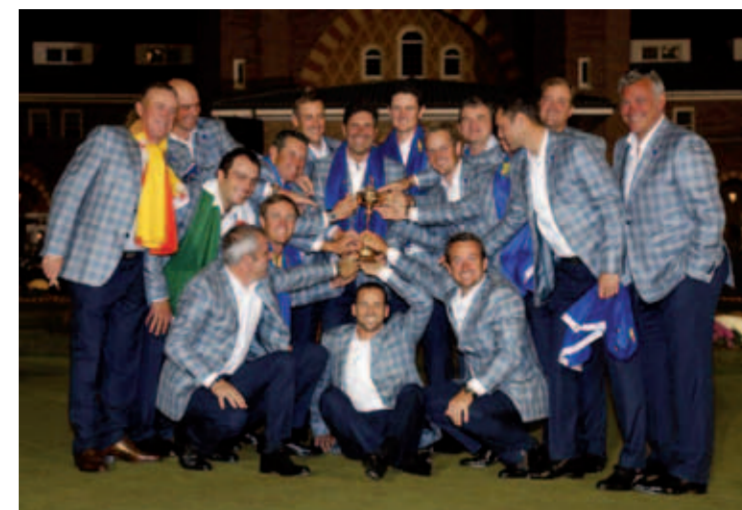
Equipo europeo victorioso.

A Davis (Love III) nada le va a consolar, no se le puede decir nada porque no hay consuelo posible, a nosotros nos pasó lo