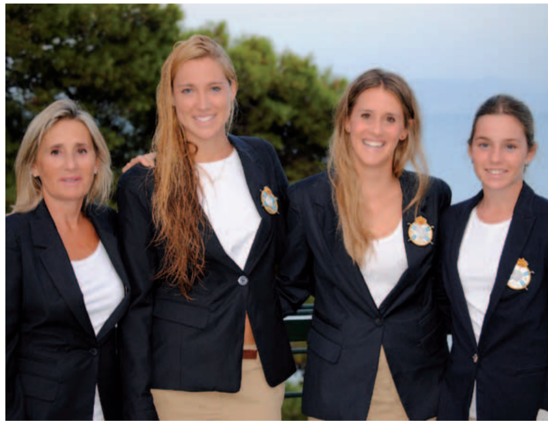
Europeo de Clubes Femenino 2012 (Basozábal)

El equipo de Basozábal se ha impuesto, mediante una sólida y brillante actuación, en el Campeonato de Europa de Clubes Femenino que se ha celebrado en el campo griego de Corfú Golf Club, sumando con ello el segundo triunfo de un combinado español en la historia de esta competición.