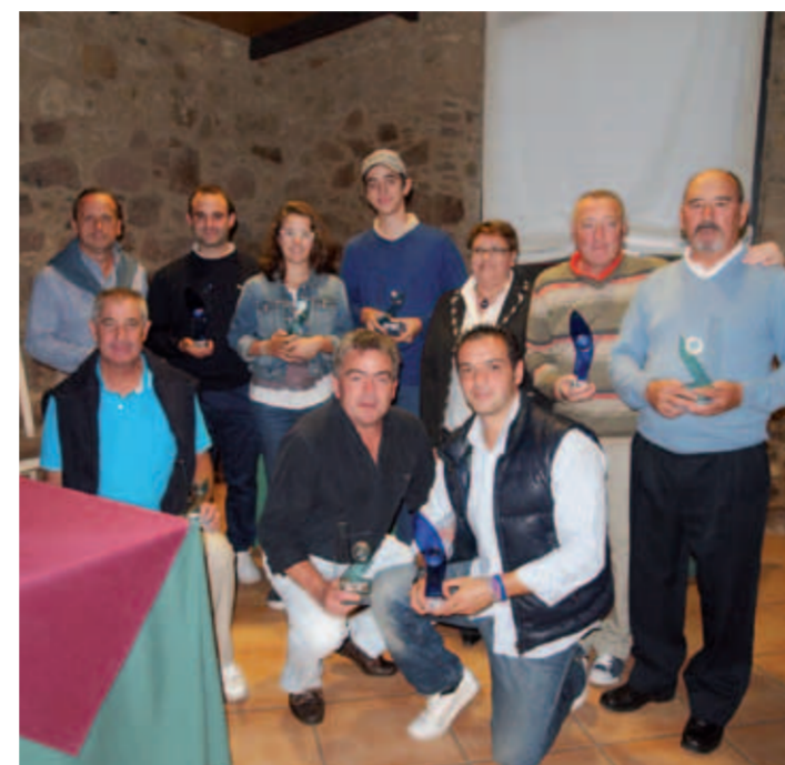
Foto de los premiados

A finales de septiembre se celebró en el Club de Golf Campomar la octava edición del TORNEO CIDADE DE NARÓN, un clásico ya en nuestro campo ya que lleva celebrándose desde su apertura. Dicho torneo fue la clausura a una semana con diferentes actividades para todos los ciudadanos de la comarca. La intención de esta semana es promocionar y dar a conocer el deporte del golf y las maravillosas instalaciones que hay en Narón para aquellos que no las conozcan por un lado y por otro celebrar y organizar diferentes eventos entre los ya jugadores del golf.