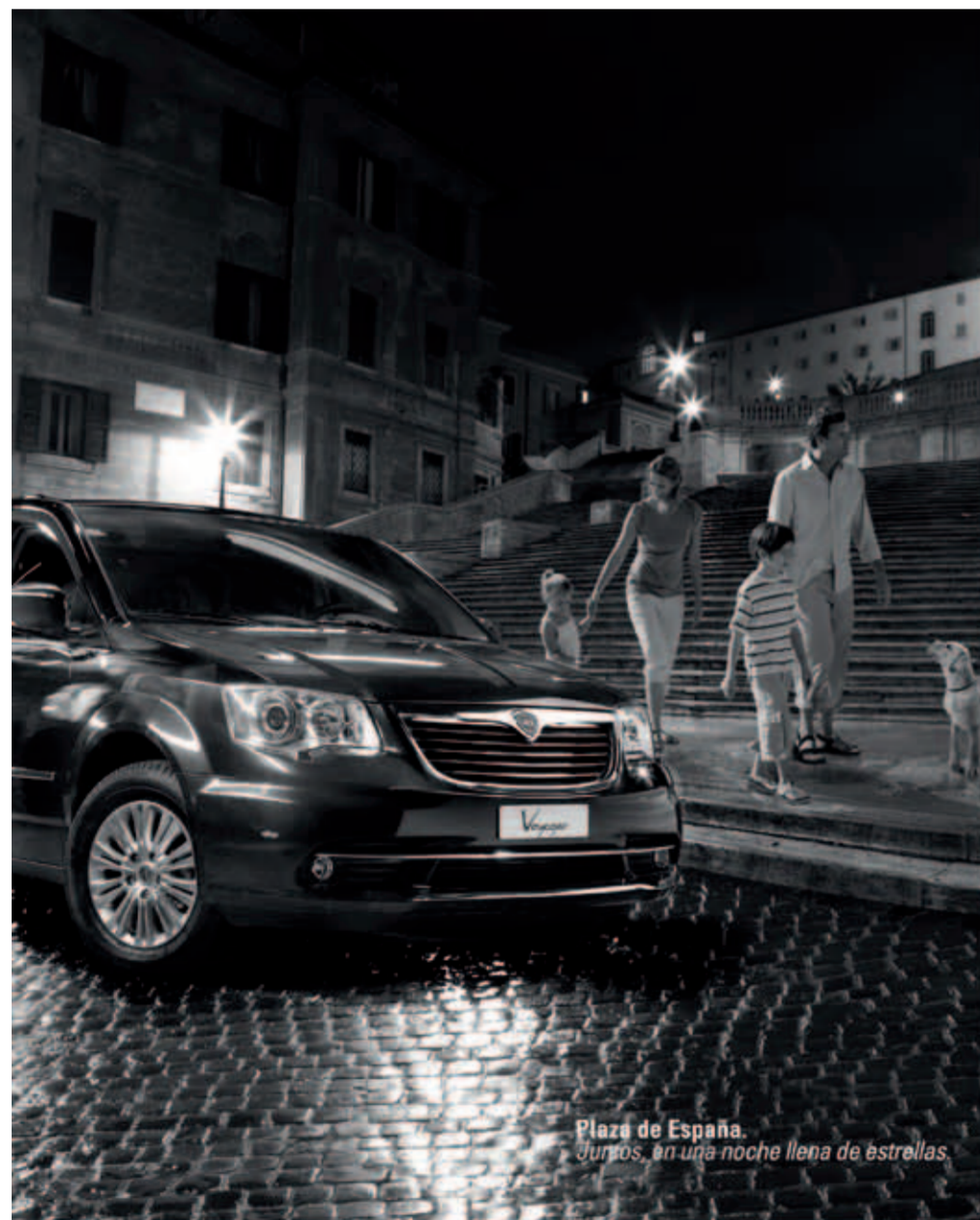
Plaza de España. Juntos, en una noche llena de estrellas.

de la Escuela Nacional Blume asisten diariamente a sus clases correspondientes, como cualquier otro alumno, en un centro concertado especializado que permite compatibilizar horarios con los entrenamientos técnicos matinales (de 11:00 a 14:00 horas) y físicos vespertinos. Para mantener el tono competitivo al más alto nivel, la RFEG promueve que estas jóvenes promesas participen todos los fines de semana que se pueda en diversas competiciones. Además, todos ellos son sometidos a un exhaustivo reconocimiento médico y psicológico, cuyos resultados y posibles tratamientos o cambios en la dieta, para obtener un mayor rendimiento a todos los niveles, son comunicados a sus familias.