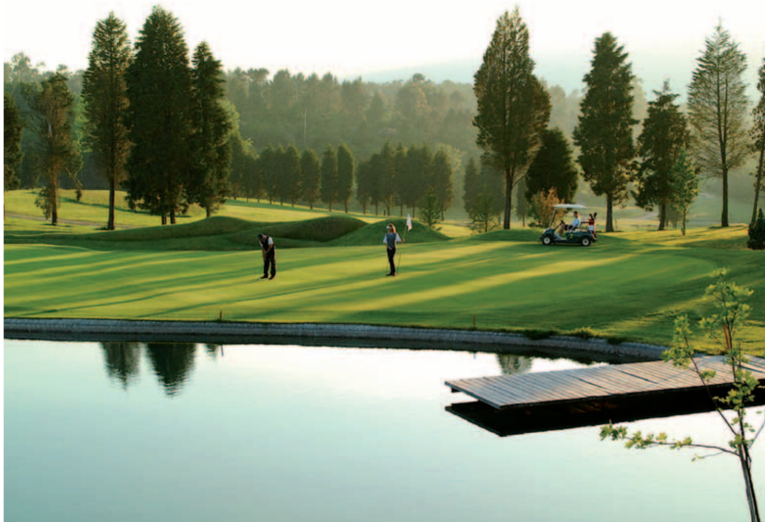
En el torneo se repartieron, como es tradicional, una gran cantidad de premios para las participantes

Descanso, relajación y práctica del golf, todo ello al más alto nivel, una mezcla perfecta que constituye la propuesta realizada a las participantes del torneo del Circuito Lady Golf 2012 que se celebró en el Balneario de Mondariz, en Pontevedra, el 20 de septiembre.