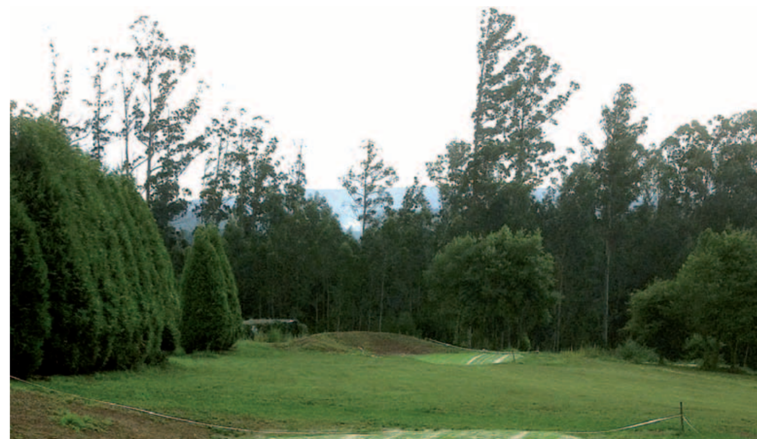
La finca que se encontraba medioambientalmente muy degradada ha sido totalmente saneada, convirtiéndose en un espacio idóneo para el disfrute de este deporte

Desde el Puente del Pedrido, tomamos la carretera hacia Betanzos y tras un kilómetro, después de pasar la localidad de Viñas, nos desviamos a la izquierda tomando un cruce que se encuentra después del doble carril. Desde ese punto son también tres kilómetros hasta el campo.