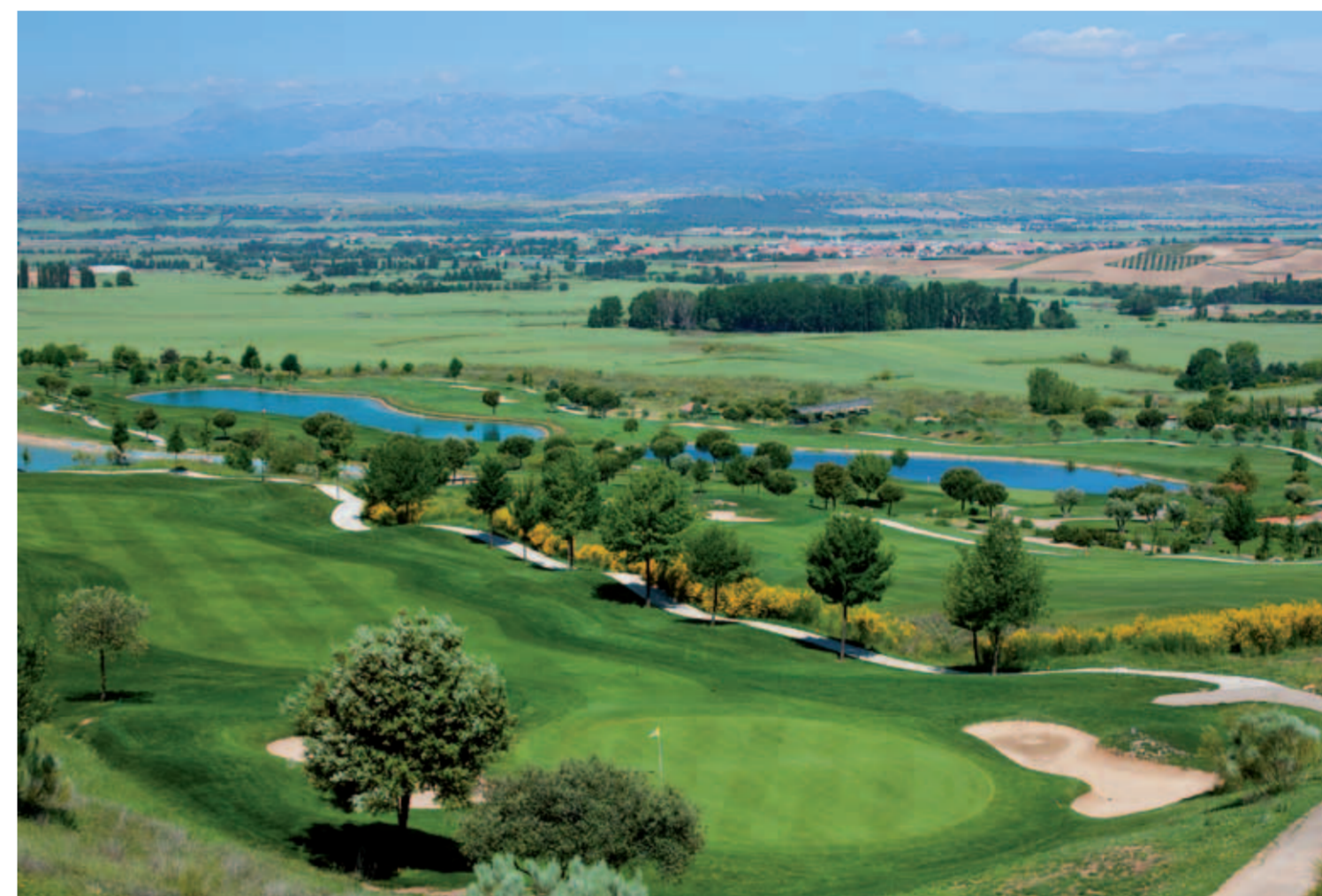
Retamares. Es una de las principales pruebas de la Federación de Golf de Madrid con dos títulos en juego: Campeón Absoluto y de Madrid

El Campeonato Abierto de Madrid Amateur Masculino vuelve este fin de semana al Club de Golf Retamares, en Alalporro, donde tendrá lugar del 14 al 16 de septiembre. Es una de